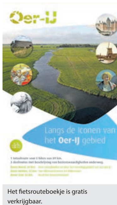
Het fietsrouteboekje is gratis verkrijgbaar.

ving van de omgeving wordt steeds een onderscheid gemaakt tussen zes tijdfasen. Elke periode kent zijn eigen iconen en bijzondere plekken, die elk voor zich een verhaal over ontstaan en gebruik van het gebied vertellen. Het fietsrouteboekje is gratis verkrijgbaar. Onder meer bij archeologiemuseum Huis van Hilde in Castricum, bezoekerscentrum De Hoep van PWN in Bakkum, Museumgemaal 1879 in Akersloot en Brouwerij Egmond in Egmond aan den Hoef. Kijk op www.oerij.eu voor meer adressen. Daar is ook een digitale versie van het routeboekje met GPX