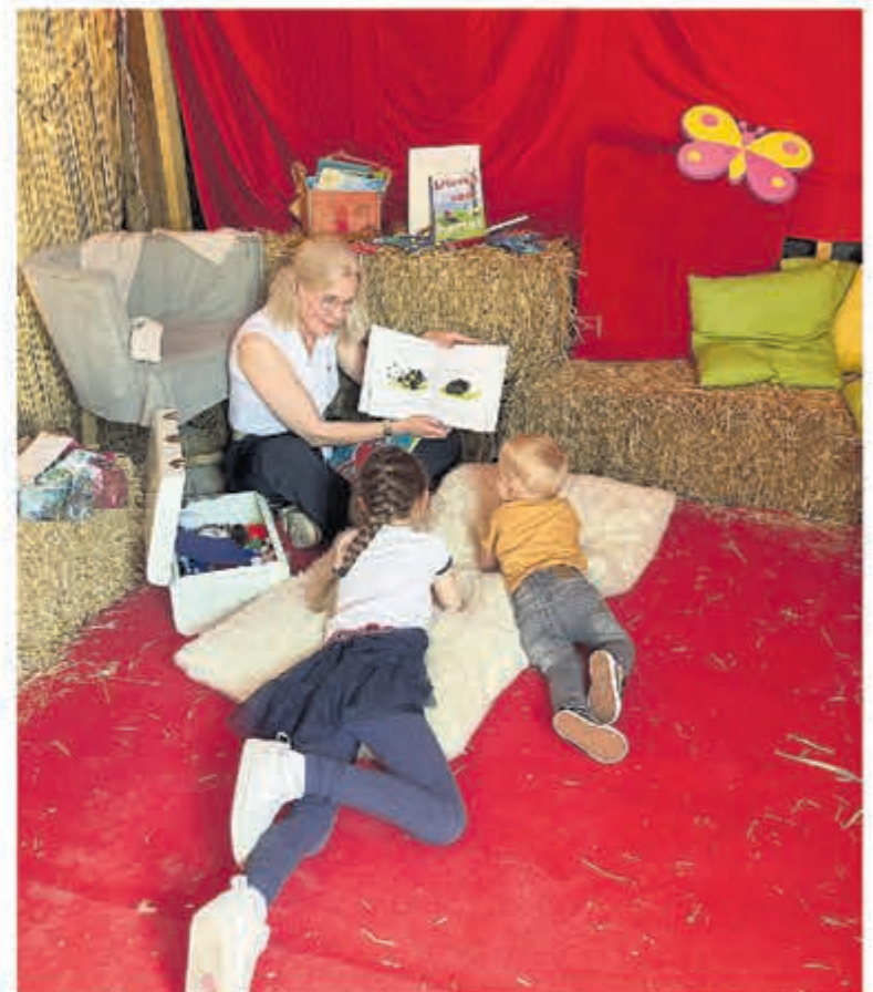
In de kindertent kunnen kinderen hun verlies samen delen.

Ga voor meer informatie, programma en deelnemers naar: Troostdag.nl