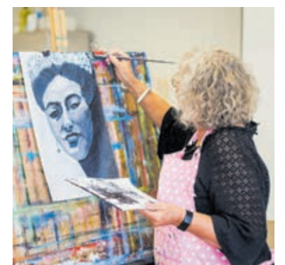
Tijdens de open dag kunnen bezoekers deelnemen aan diverse workshops.

Natuurlijk laten cursisten en docenten van Toonbeeld zich tijdens de open dag ook zien en horen: op verschillende plekken in en rond het gebouw zijn optredens en exposities. Met zoveel leuke activiteiten mag je de open dag van Toonbeeld Geesterhage niet missen! Je vindt Toonbeeld in cultureel centrum Geesterhage aan de Geesterduinweg 7. Tot zaterdag 17 juni!