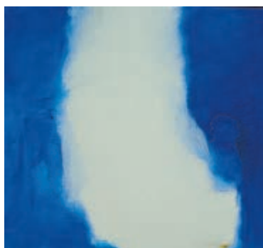
Teska Seligmann.

De expositie is te bezichtigen tot 7 augustus tijdens de openingsuren van De Oude Keuken. De feestelijke opening is op 11 juni om 16.00 uur.