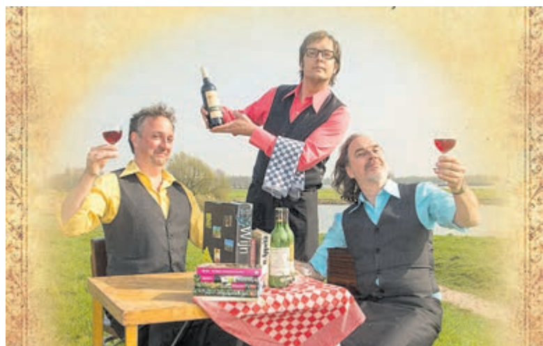
De Aimabele Schoften geven letterlijk een voorproefje van hun voorstelling WIJNCABARET.

Het Castricum UIT Festival start om 10.30 uur en duurt tot 18.00 uur. De optredens vinden plaats op het THEATERpodium (in Geesterhage), het TERRASpodium (voor Geesterhage), het PLEINpodium (op het parkeerterrein bij de visboer) en het STRAATpodium (bij snackbar de Toren). De workshops worden gegeven bij Toonbeeld. Alle optredens, workshops en activiteiten zijn gratis toegankelijk.