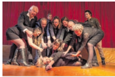
De laatste productie van Expressie.