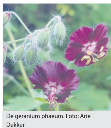
De geranium phaeum.