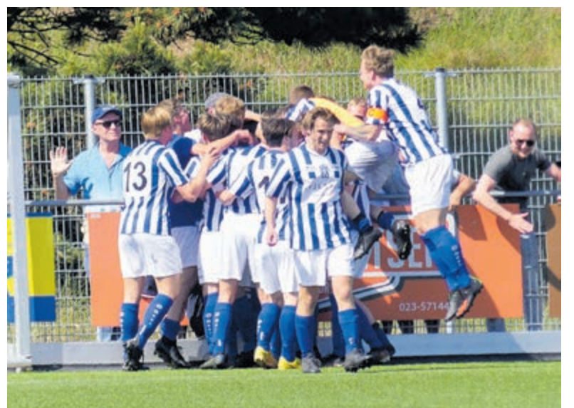
Ontlasting na de tweede treffer, waarmee het vonnis over Zandvoort geveld werd.