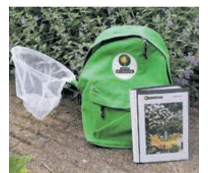
Deze rugzak met toebehoren gebruiken de kinderen tijdens het lopen van het natuurpad.

Bertho is aanwezig om een rondleiding te geven en bij de kas zijn eenjarige planten en tuinkruiden in de uitverkoop. Op het terras aan de vijver is het heerlijk genieten van een kopje koffie of kruidenthee!