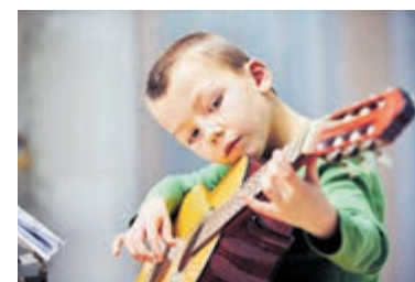
Altijd al een instrument willen bespelen? Kom het proberen tijdens de open dag!

Castricum - Het is zover! Op zaterdag 17 juni tussen 11.00 en 16.00 uur opent Toonbeeld Geesterhage haar deuren voor de jaarlijkse open dag. Tijdens deze open dag ontdek je alles wat het kunstencentrum van Castricum te bieden heeft aan muziek, beeldende kunst en theater. Ben je beginner of ervaren, piepjong of net wat minder jong: voor iedereen is iets leuks en uitdagends te doen en ontdekken.