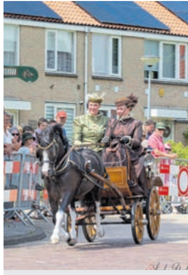
Het jaarlijkse ringsteken in Bakkum.

mers te paard in draf langs drie palen, waarop een aantal ringen zijn bevestigd. De ruiters moeten met hun steekstok door de ringen heen steken en ze proberen te verzamelen. Degene die de meeste ringen weet te steken, wint de wedstrijd. Het is een spectaculair gezicht om de ruiters te zien proberen de ringen te steken. Ringsteken heeft een lange geschiedenis die teruggaat tot de middeleeuwen. Het werd oorspronkelijk als een militaire oefening beschouwd, waarbij ridders te paard hun vaardigheden met de lans en het steekwapen konden tonen. Het was