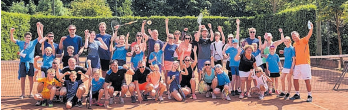
De deelnemers aan het ouder-kind-toernooi 2023.

Het was een leuk en gezellig toernooi; voor volgend jaar is hetzelfde weer besteld, dus het belooft dan wederom een groot succes te worden.