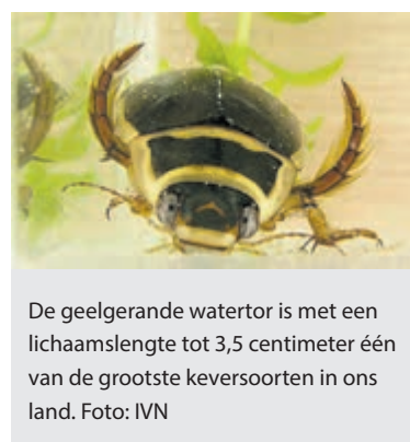
De geelgerande watertor is met een lichaamslengte tot 3,5 centimeter één van de grootste keversoorten in ons land.

en groene kikkers: het wemelt er van het leven. Gele lissen, egelskop en waterweegbree staan te shinen in het water naast een kruidenrijk weiland vol boterbloem, zuring, rolklaver, ogentroost en rietorchis. En al dat prachtigs is best een feestje waard! Kom je zondag van 10.00 tot 16.00 uur de sloot bewonderen en zoeken naar de rover der rovers: de geelgerande watertor? Meld jouw gezin of groepje kinderen aan voor een tijdslot! Per groepje is een deel, zoekkaart en schepnet beschikbaar. Meer kinderen? Er zijn wat extra netten, maar als je er eentje thuis hebt, neem die vooral mee! Laarzen, een setje droge kleren en zonnebrand zijn ook warm aanbevolen. Aanmelden gaat via www.ivn.nl/mkl en het aantal plaatsen is beperkt.