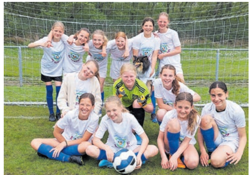
Het schoolvoetbalmeidenteam van kindcentrum De Kerkuil.

nodige fans, inclusief hondencoscotte Tico, naar Nieuw-Vennep afgereisd. Ook daar wisten ze na de poulewedstrijden de finale te bereiken. De finale was reuze spannend, waar de meiden zich van een 2-0-achterstand terug knokten naar een gelijke 2-2-stand. Helaas verloren ze deze penaltyserie en zijn ze trots huiswaard gekeerd met een tweede plaats in deze districtsfinale. De volgende dag is het team door de hele school gehuldigd op het schoolplein.