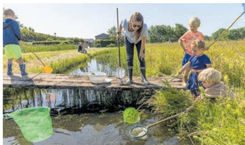
Deelnemers aan de slotjesdag in 2022.

waterschappen en natuurbeheerders wordt het oppervlaktewater beter beheerd en dat is te merken. Sloten en plassen zitten vol leven, zo ook de sloot bij het Zeerijdsdijkje in Bakkum. Waterschorpionen, keizerslibellen, kokerjuffers, staafwantsen