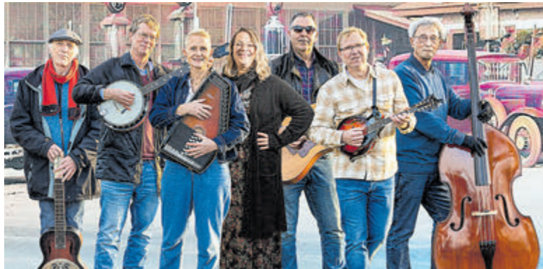
De band Clear Horizon.

u van het optreden genoten hebt kunt u, als u dat wilt, een bijdrage voor de muzikanten achterlaten. U vindt De Oude Keuken aan de Oude Parklaan 117. Kijk op www.deoudekeuken.net voor uitgebreide informatie.