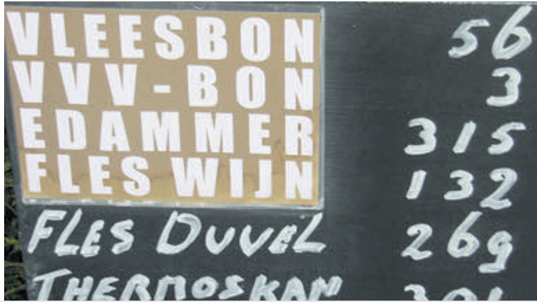
Het prijzenbord in vroegere tijden.