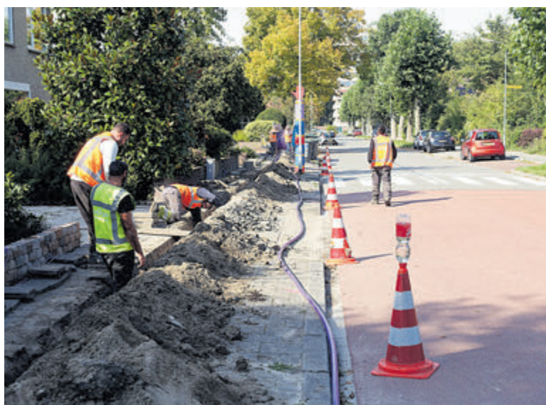
De straten hoeven niet meer voor een tweede keer open.

Als reden voor deze intrekking wordt in de brief gezegd dat gebleken is dat een andere partij in de gemeente is gestart met de aanleg van een glasvezelnetwerk. Dat klinkt niet erg plausibel, omdat deze constatering, zoals hierboven beschreven, al langere tijd bekend was. Voor de ontvangers van de brief geldt dat alle abonnementen worden geannuleerd en er geen kosten in rekening worden gebracht. Achteraf kan nog worden geconcludeerd dat de meeste inwoners niet rouwig zullen zijn om het wegvallen van een exploitant, want het voor de tweede keer opbreken van hun straat blijft ze nu bespaard.