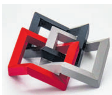
Een door Klaas Lakeman vervaardigd kunstobject.

gids) met start en einde bij het gemaal (aanvang 13.00 uur, aanmelden via info@oerij.eu ). Na de wandeling behoort bezoek aan het gemaal tot het arrangement.