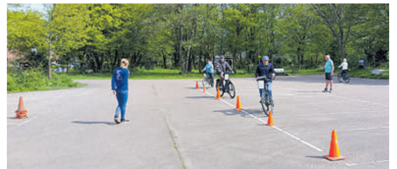
De fietslessen worden gratis aangeboden, maar vooraf aanmelden is verplicht.

elke positie: verdediging, middenveld en aanval. Daarnaast is FC Castricum met tegendoelpunten de absolute winnaar; slechts tien tegendoelpunten in dertien wedstrijden! Kortom, het seizoen is buiten verwachting goed verlopen door kampioen te worden in de hoofdklasse. MO 20-trainster Kim de Wit stelt dat één keer kampioen worden al prachtig is om mee te maken, maar twee keer op rij is heel bijzonder. De meiden hebben het echt verdiend met enorme inzet en teamwork. Ook dit jaar is het team enorm gesteund door de 'twaalfde man': naast de ouders en broertjes en zusjes wordt dit team altijd aangemoedigd door een grote groep opa's en oma's, die precies op de hoogte zijn van de standen en ook bij uitwedstrijden langs de lijn staan.