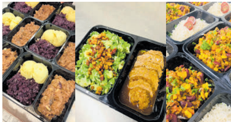
Volop keus uit heerlijke maaltijden, zoals rode kool met een rundstooftje en puree, raapstelenstamppot met een bal gehakt (100% rundvlees) en chili con carne met rundergehakt en basmatirijst.

Castricum - per 1 juni ondergaat Wesley Groente, Fruit en Delicatessen aan de Burgemeester Mooijstraat 37 een wijziging. Het concept wordt aangepast, de focus komt te liggen op het verzorgen van complete maaltijden en luxe belegde broodjes. Bij een nieuw concept hoort ook een nieuwe naam: Wesley's Meals, Delicatessen en Traiteur.