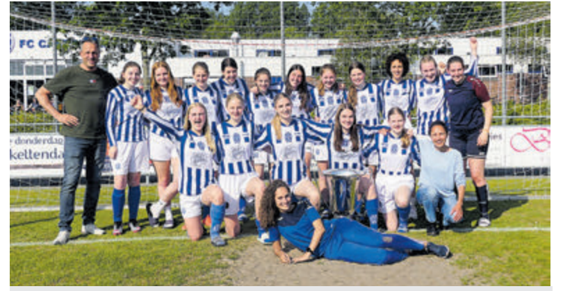
De meiden van FC Castricum team MO20.