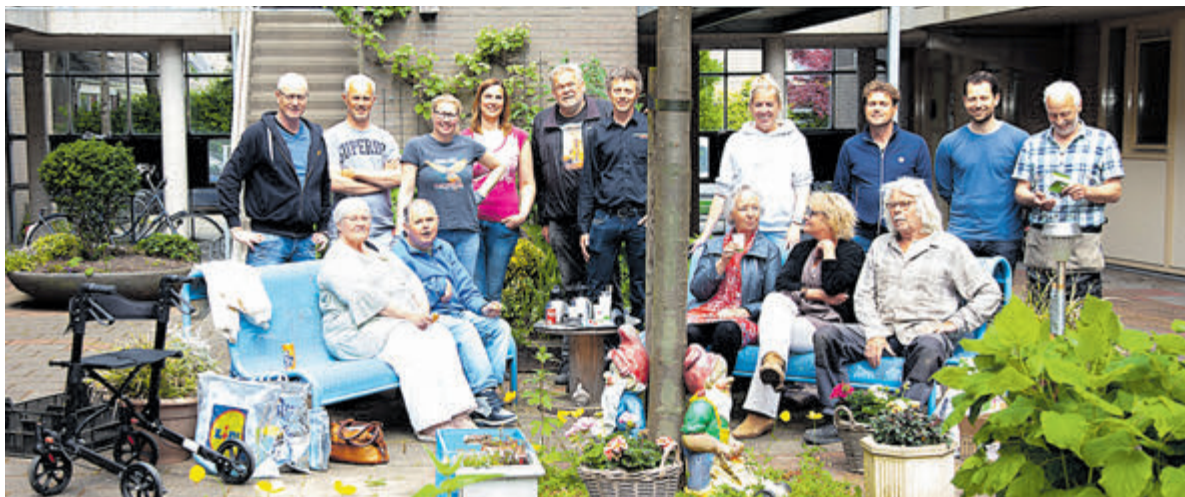
Deelnemers aan het initiatief Kennemer Wonen Geeft Thuis.