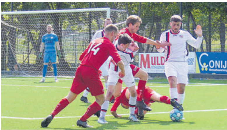
FC Castricum heeft het nakijken...