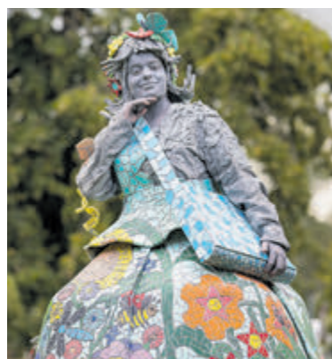
Levende standbeelden op drie locaties in Heiloo.

vinden. Als de volle kaart wordt ingeleverd krijg je iets lekkers. In Het Hoekstuk kun je de kaart ophalen bij Primera, in het Stationscentrum bij IJssalon Pinoccio en in 't Loo op het middenplein voor Bakkerij Hoetjes. Het belooft een spectaculaire dag te worden.