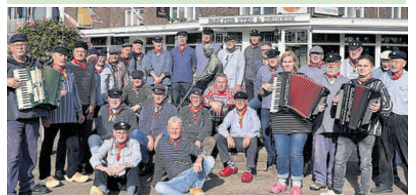
Shantymusiek De Skulpers organiseert het korenfestival.