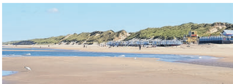
Het strand bij Heemskerk.

spannend wat er in het net zit. Doe mee en laat je verrassen door de geheimen van de Noordzee! De deelnemers verzamelen zich om 12.00 uur aan de vloedlijn ter hoogte van strandpaviljoen 'De Vrijheid' op het strand bij Heemskerk. De plek zal herkenbaar zijn aan de groene IVN-strandvlag. Deelname is gratis, maar om praktisch redenen graag wel vooraf via www.ivn.nl/mkl aanmelden.