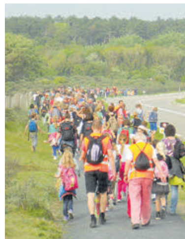
Jong en oud kan zich inschrijven voor deelname aan de Avondvierdaagse.

De kosten zijn dan 5 euro per persoon. Let op: een geldige duinkaart is verplicht!