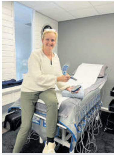
Afvallen en spieren versterken door middel van elektrostimulatie.

Limmen - VormVitaal Limmen heeft jarenlange ervaring in het begeleiden van mensen die alles op het gebied van afvallen al wel eens hebben geprobeerd, maar steeds weer terugvielen in het oude patroon. De werkwijze met het EMS-apparaat is veel intensiever ten opzichte van sporten. Daarbij ligt je lekker ontspannen op de comfortabele behandelbank, terwijl via ultrasound de vetcellen worden aangepakt en tegelijkertijd de spieren middels elektrostimulatie (EMS) worden getraind, zonder kans op blessures.