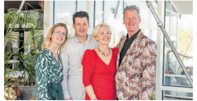
Bij Bistro 't Schippersrijk draait om het complete plaatje