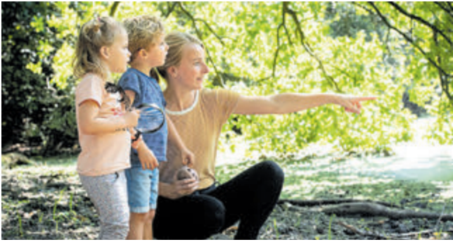
Forte heeft jou nodig!