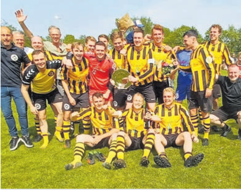
Meervogels '31 eindelijk kampioen.