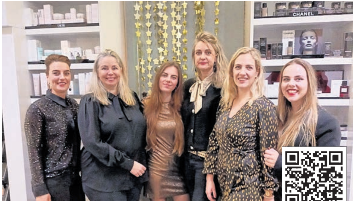
Het team van parfumerie MOOI Van den Haak.