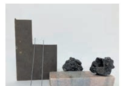
Sculpturen van Hester Timmers.

Hester Timmers: Zij maakt sculpturen van voorwerpen die zij gevonden