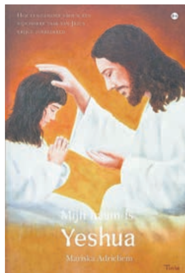
De omslag van het boek 'Mijn naam is Yeshua'.

De omslag van het boek 'Mijn naam is Yeshua' heeft de Limmense kunstenaar Tinie Hanck-Valkering geschilderd. Het 220 pagina's tellende boek kost € 21,99 en is verkrijgbaar bij boekscout.nl, bol.com en via de boekhandel.