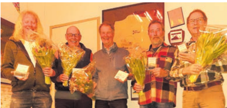
De strandviskampioenen van het seizoen 2022/2023 na hun huldiging.