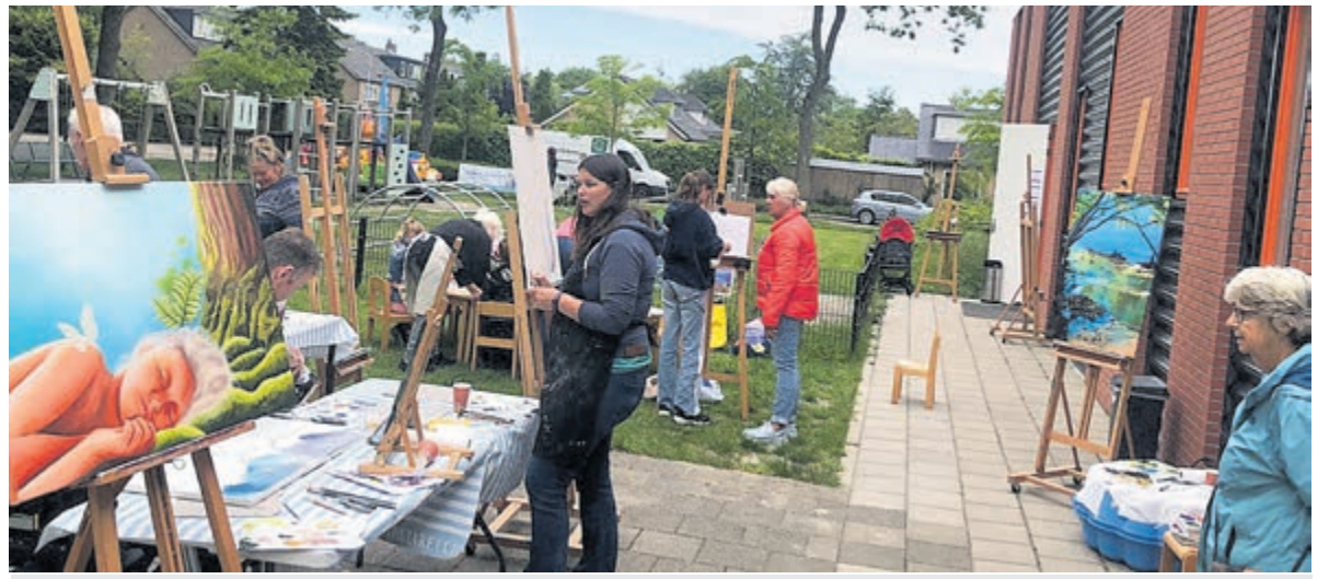
Sfeerimpressie van de vorige editie van de Kunstfietsroute bij het Buurt- en Biljartcentrum Castricum.

Het eerste CALorie-spreekuur in de bibliotheek voor alle vragen over verduurzaming is op 27 juni van 10.00 tot 12.00 uur.