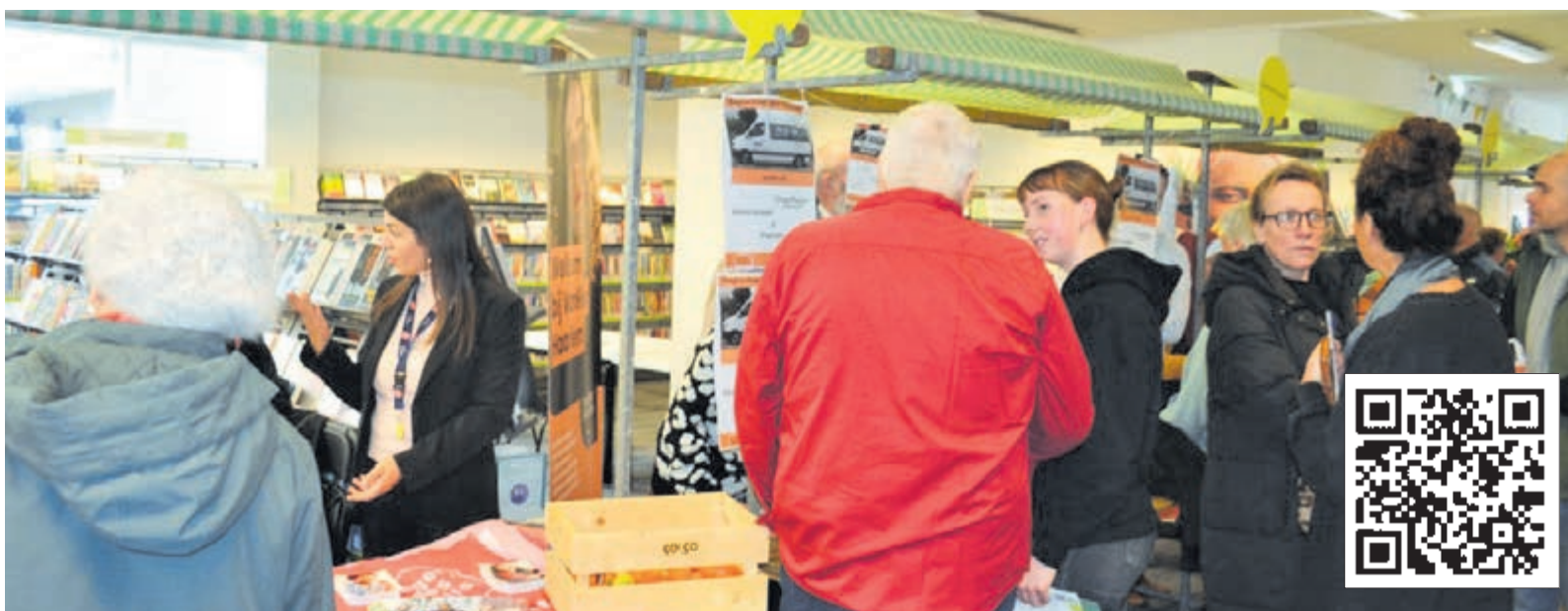
Werkzoekenden en werkgevers zoeken elkaar op.

Werkgevers kunnen zich aanmelden via de site van het WerkgeversServicepunt ( www.wspzki.nl/evenementen/werkfestival ) voor het Werkfestival. Werkzoekenden kunnen terecht op de evenementenpagina van ZKIJ Werkt Door ( https://zkiwwerktdoor.nl/event/werkfestival ).