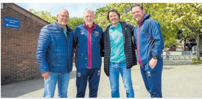
Van links naar rechts: Gert Stoppels, David Moyes, Arjan de Zeeuw en Kevin Nolan.

Kijk op www.gezondnatuurwandelen.nl/wandelen/vind-een-wandeling voor een wandeling bij u in de buurt. En lijkt het u leuk om zelf een wandelgroep in Castricum te begeleiden? Neem dan contact op via de website. De gratis wandelingen van Gezond Natuur Wandelen in Noord-Holland worden mede mogelijk gemaakt door het Oranje Fonds, Brentano's Steun des Ouderdoms en de provincie Noord-Holland.