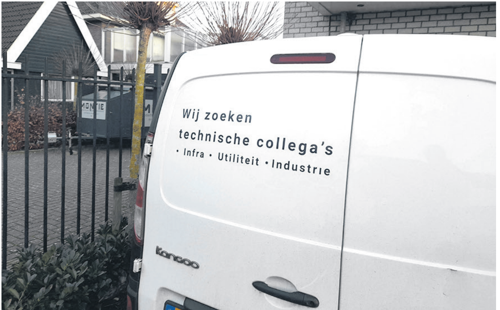
Steeds meer bedrijven hebben moeite om aan gekwalificeerd personeel te komen.