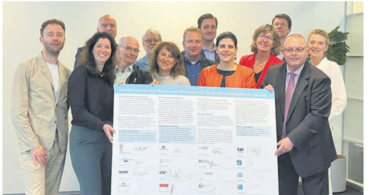
Partners slaan de handen ineen voor regionaal werkcentrum.

Vanwege de huidige arbeidsmarktsituatie voelen de samenwerkende partners de urgentie om zo snel mogelijk concrete stappen te zetten richting een regionaal werkcentrum. Binnen dit regionale werkcentrum wordt de dienstverlening aan werkenden, werkzoekenden en werkgevers versterkt waardoor ook de arbeidsmarkt wordt versterkt. Daarmee wordt de huidige dienstverlening die momenteel door partners wordt geboden in het Regionaal mobiliteitsteam ZKIJ bestendig.