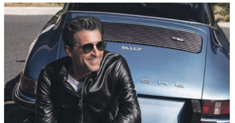
Bossinade Optiek heeft ruim vierhonderd zonnebrillen op voorraad.

netvlies goed beschermt. Juist daarom koop je een nieuwe zonnebril bij Bossinade. Kies je voor gepolariseerde glazen, dan neem je ook nog eens die hinderlijke schittering van wateroppervlakten of van het wegdek weg. Dat maakt het kijken een stuk comfortabeler! Tijdens de Zonnebrilweken geeft Bossinade 10% korting op alle zonnebrillen en krijg je bovendien de basisglazen op sterkte cadeau! Kies je voor een ander type glazen, dan betaal je alleen de meerprijs daarvoor, de prijs van de basisglazen wordt dan in mindering gebracht. Kijk op www.bossinade.nl voor meer informatie.