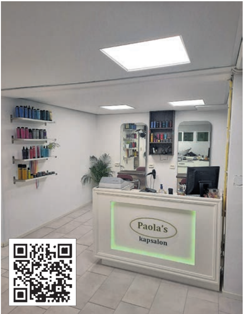
Paola's Kapsalon verhuist in juni naar Burgemeester Mooijstraat 32.