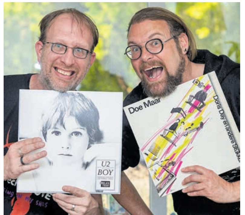
Er kan onder andere gedanst worden op muziek van U2 en de band 'Doe Maar'.

Het jaren-80-feest begint om 20.30 en duurt tot 01.30 uur. De entree bedraagt € 6,50 per persoon. Maar dan heb je ook wat!