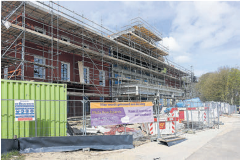
Het woonzorgproject van Philadelphia.

Castricum - Het is al ruim een half jaar geleden dat in deze krant informatie werd verstrekt over de laatste bouwprojecten op het landgoed Duin en Bosch. Inmiddels zijn vier van de vijf nagenoeg gereed of gestart. De vijfde locatie ligt er voorlopig nog maagdelijk bij.