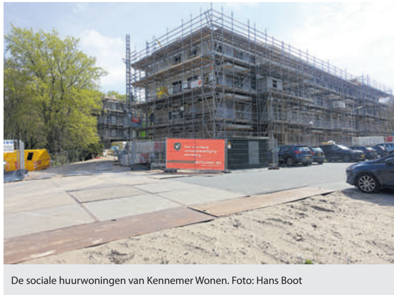
De sociale huurwoningen van Kennemer Wonen.

Daarover heeft de woningcorporatie laten weten dat de woningen naar verwachting in de loop van november van dit jaar in gebruik kunnen worden genomen. Enige tijd daarvoor worden de woningen geadverteerd via SVNK.