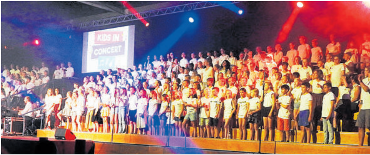
Indruk van 'Kids in Concert' in 2022.