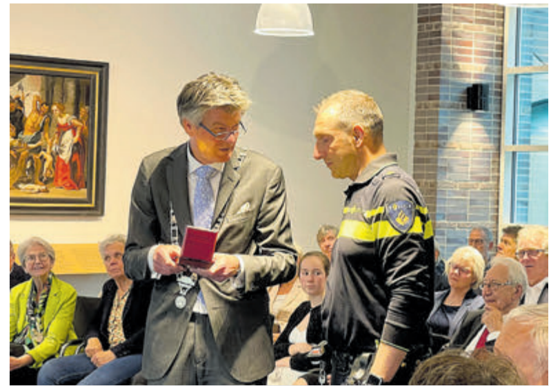
Van de politie ontving de vertrekkende burgemeester de 'coin' van basisteam Alkmaar/Duinstreek.

De vertrouwenscommissie kiest namens de gehele gemeenteraad uit de voordracht van de Commissaris van de Koning een burgemeester. Die keuze wordt dan weer ter goedkeuring voorgelegd aan de gemeenteraad.