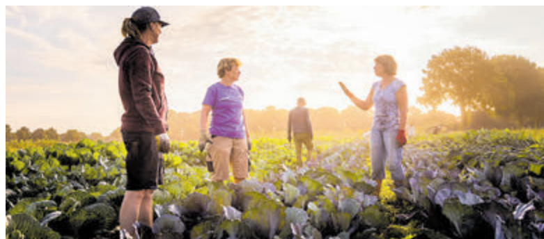
Overall in Nederland ontstaan momenteel Herenboerderijen. Naar verwachting zullen er in 2030 meer dan driehonderd van dergelijke coöperatieve boerderijen zijn.

Castricum - Een Herenboerderij is een coöperatieve onderneming, doorgaans eigendom van ongeveer tweehonderd huishoudens. De boerderij werkt exclusief voor deze huishoudens en levert ze het hele jaar door voedsel. In Castricum en omstreken hebben zich inmiddels meer dan 140 huishoudens aangemeld voor deelname aan zo'n Herenboerderij. Op 25 mei vindt in café DOK Geesterhage aan de Geesterduinweg 3 een informatiebijeenkomst plaats voor belangstellenden.