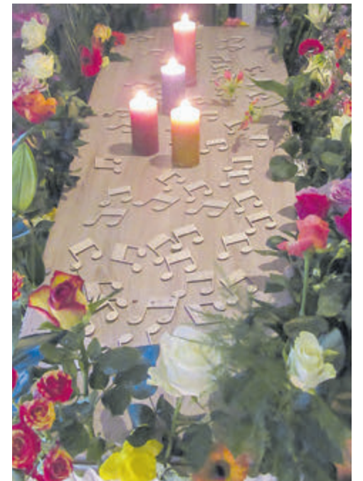
Een mooi afscheid dat past bij de overledene.

Lumen uitvaart is 24 uur per dag, 7 dagen per week bereikbaar op: 06 20822260. Zie ook www.lumenuitvaart.nl of volg Lumen uitvaart op Facebook.