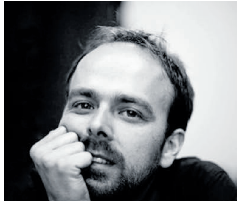
Joost Botman vertelt het verhaal van zanger Johnny Cash.

De G-disco duurt van 20.00 tot 22.00 uur en de entreeprijs bedraagt 5 euro inclusief twee consumptiemunten.