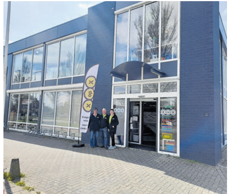
Kringloopwinkel X op X aan de Rijksweg 127 in Limmen.

winkel aantrekkelijk voor iedereen. Eens per kwartaal wordt een veel groter geldbedrag uitgekeerd aan een goed doel. Iedereen kan hiervoor via een aanvraagformulier een suggestie indienen. Een speciale sponsorcommissie, samengesteld uit vrijwilligers van de stichting, beslist uiteindelijk welke doelen men ondersteunt. Eén van de voorwaarden is dat het om niet-gesubsidieerde goede doelen moet gaan. Kringloopwinkel X op X is elke dinsdag, donderdag en zaterdag geopend van 10.00 tot 15.00 uur. Er is een bushalte voor de deur en op het terrein achter de winkel zijn 22 gratis parkeerplaatsen. Aankopen kunnen tegen een geringe vergoeding worden thuisbezorgd. Voor het ophalen van gedoneerde goederen worden geen kosten in rekening gebracht. U bent van harte welkom tijdens de openingstijden.