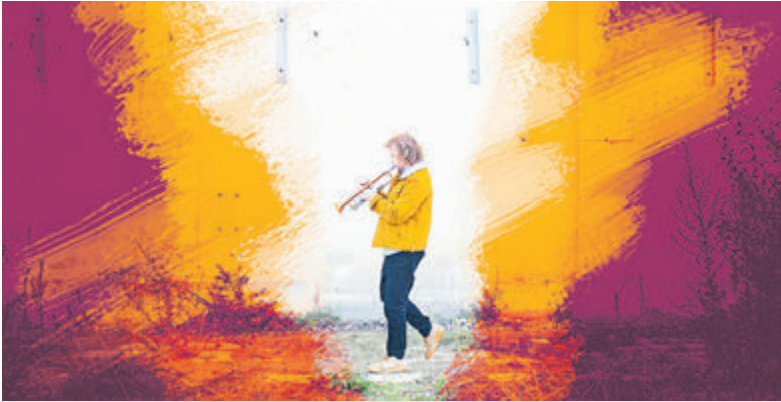
MARTH: twee muzikanten, zes instrumenten.

Castricum - De organisatie van het evenement Uit Je Bak heeft de eerste namen van optredende bands gepubliceerd. Lokaal en regionaal zeer getalenteerde bands staan deze zomer op het Castricumse podium in het park. Het zijn MARTH (multi-instrumentalisten), Fleebag (poprock met disco-invloeden) en Minor Citizen (hét geluid van de nieuwe generatie).