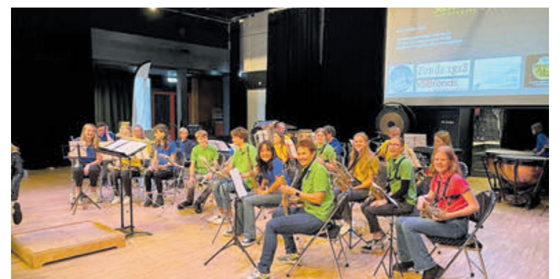
Het opleidingsorkest van Emergo.