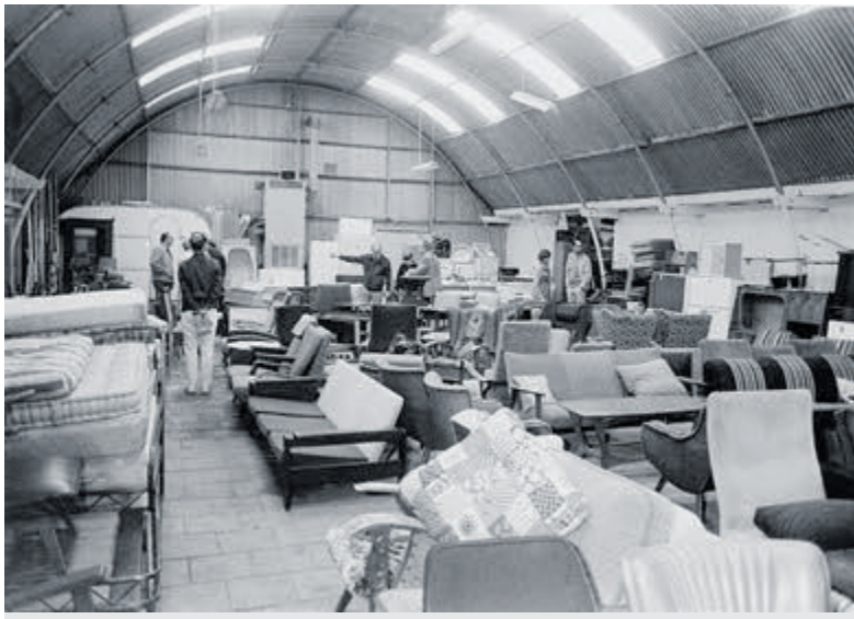
De loods aan de Oude Haarlemmerweg.