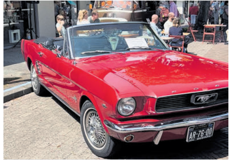
De Oldtimerdag Castricum in 2022.

Foto Loek Anderson is bijna twintig jaar gespecialiseerd in het digitaliseren van oude familiebeelden. Bij Anderson kunt u 8 mm films, alle soorten videobanden, cameratapes en dia's laten overzetten op een USB-stick, DVD en externe harde schijf. Informeer naar de mogelijkheden en haal een gratis informatiemap met een attentie. Drukkerij Elta en Foto Loek Anderson zijn geopend van maandag tot en met donderdag van 08.15 tot 17.00 uur en op vrijdag tot 16.00 uur. Tot ziens in de Trompstraat 1 in IJmuiden. Voor informatie: 0255 535818.