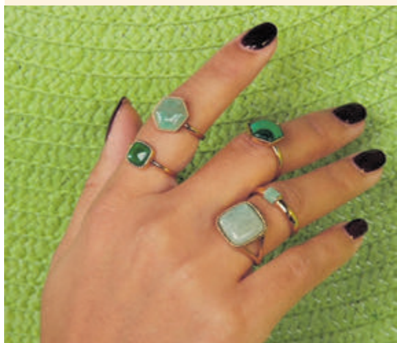
De veelzijdige sieraden van My Bendel zijn verkrijgbaar bij Nice2Have.

Deze sieraden zijn gemaakt van de beste materialen, zoals edelstaal. De extra zes micron dikke 14K goldplating is uniek en zorgt ervoor dat de sieraden lang mooi blijven en niet verkleuren of afgeven. Kortom: luxe sieraden, maar dan wel voor een betaalbare prijs! Bij Nice2Have aan Geesterduin 50 vind je ringen en oorbellen van dit merk, maar daarnaast is elk item uit de collectie van My Bendel eenvoudig in de winkel te bestellen.