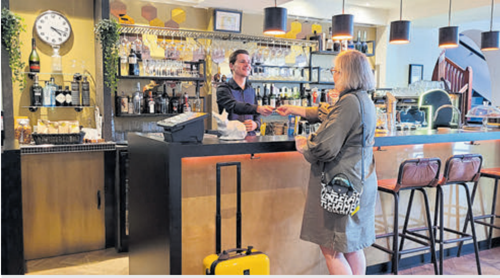
Het veelzijdige horecawerk bij Boutique Hotel Huize Koningsbosch.