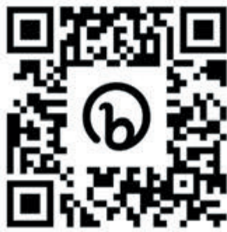
Scan de QR-code om een donatie te doen.

Uit Je Bak wordt dit jaar, zoals altijd, op de laatste zondag van juli gehouden: 30 juli. Uit Je Bak is gratis, maar voor dit jaar kan de organisatie jouw donatie extra goed gebruiken. Ga naar https://bit.ly/UJBdonatie om te doneren en pas het bedrag aan naar wens.