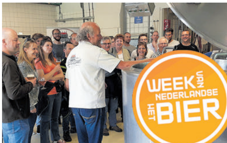
Bezoekers van de open dag krijgen informatie over het brouwproces.

Limmen - Op zaterdag 13 mei is in verband met 'De Week van het Bier' een open dag bij brouwerij Dampegheest aan de Achterweg 22. Iedereen die wel eens wil zien waar en hoe de bieren gebrouwen worden, is welkom van 11.00 uur tot 17.00 uur. De brouwers zelf geven u graag uitleg over hoe het brouwen in zijn werk gaat. Een week later, op zondag 21 mei, presenteert de brouwerij de nieuwe special Weizen van 15.00 tot 20.00 uur in het proeflokaal aan de Schoolweg 1. Het team van de brouwerij heeft dit bier al laten proeven aan enkele Duitse experts en zij vinden het geweldig, dus dit mag je niet missen. Kijk op www.dampegheest.nl voor meer informatie.