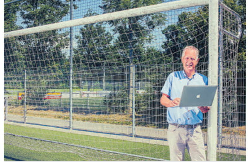
Iedereen die wil meepraten over de toekomst van sport en bewegen in Castricum, is welkom.