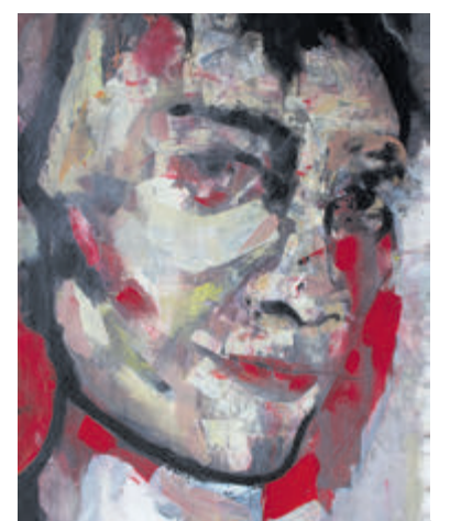
Polaroid no 4: L'incontro.