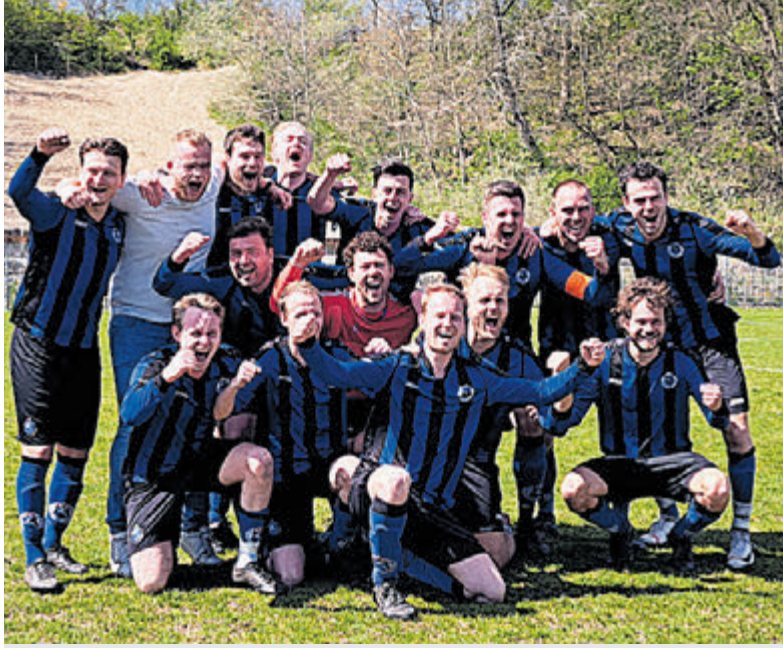
De vreugde was groot toen Vitesse na de penaltyreeks de overwinning had binnengesleept.