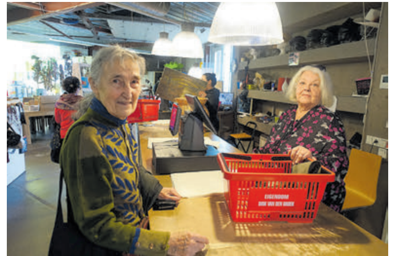
Altijd wel wat te beleven bij de kassa.