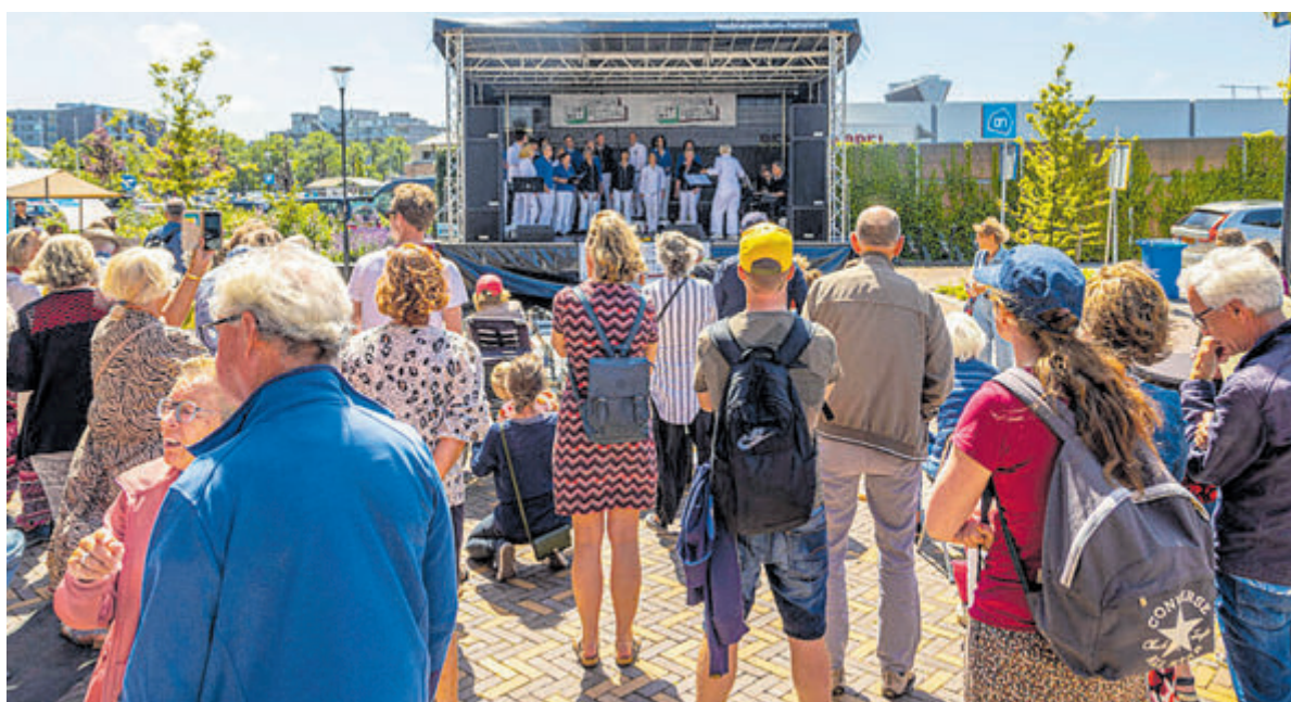
Sfeerimpressie van het Castricum UIT Festival vorig jaar.

momenten, waarop je zou willen dat je iets meer controle had gehad over je emoties en dat je tegen beter weten in toch met iets doorging wanneer je beter had kunnen stoppen.