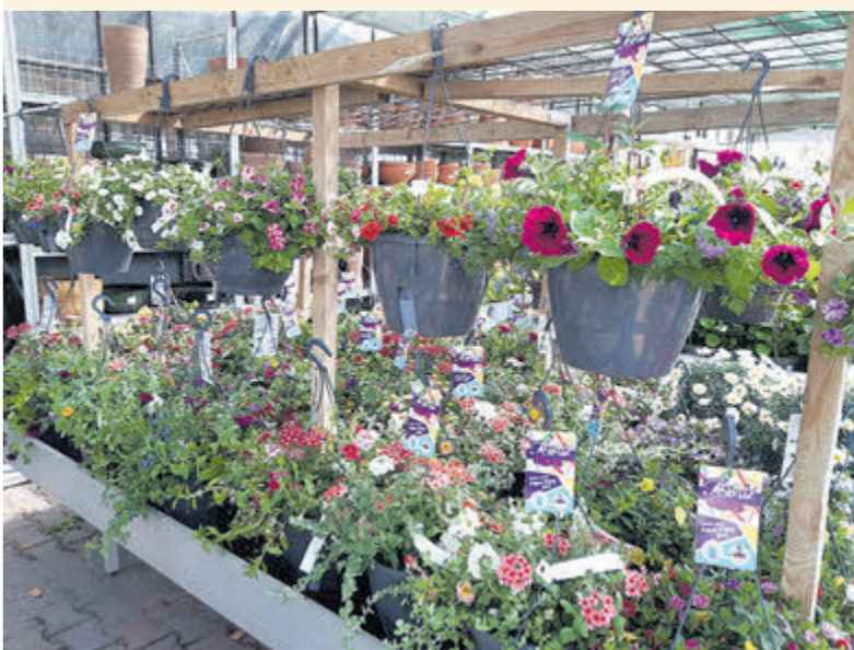
Een grote bloemenpracht bij Tuincentrum Tuinaanleg Frits Janssen.

Tuincentrum Frits Janssen aan het juiste adres; er is weer een mooie en uitgebreide sortering bloemenpracht samengesteld. Eenjarige planten, van boerengeraniums tot kuipplanten, kleurrijke zomerbloeiërs en hangende baskets; ze zijn in groten getale