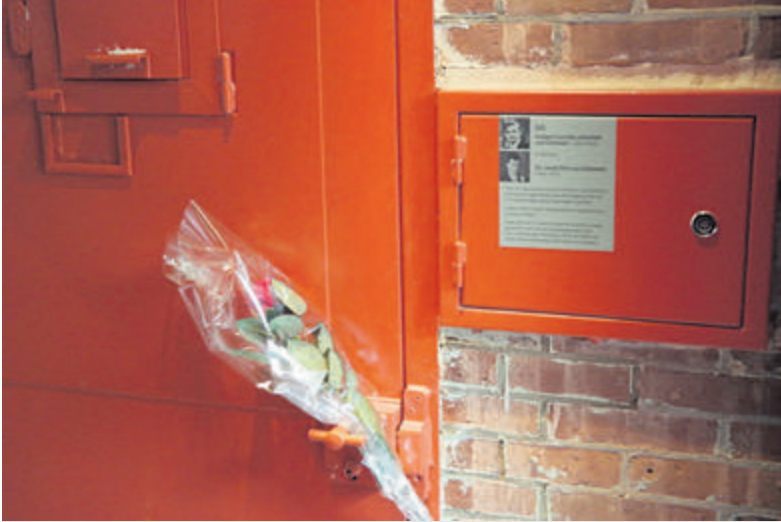
Bloemen aan de deur van de symbolisch geadopteerde cel in Scheveningen.