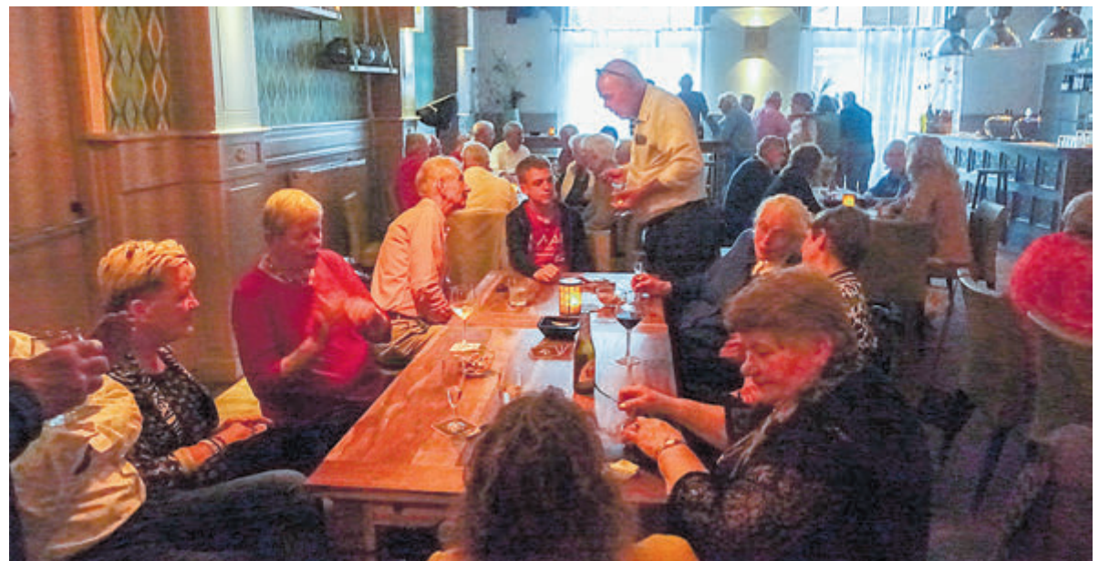
Even gezellig bijpraten.