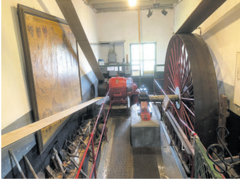
Bij extreme neerslag kan het gemaal het overtollige water wegpompen.

Akersloot - Op zondag 14 mei is Gemaal 1879 aan de Fielkerweg 4 (Klein Dorregeest) geopend van 10.00 uur tot 16.00 uur. Deze ruimere openstelling vindt plaats in het kader van de Molen- en Gemalendagen. Op die dag zal op het gemaal ruime aandacht worden besteed aan de