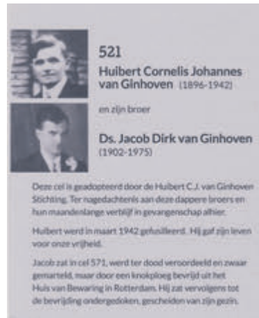
Het tekstbordje bij de deur van de cel.