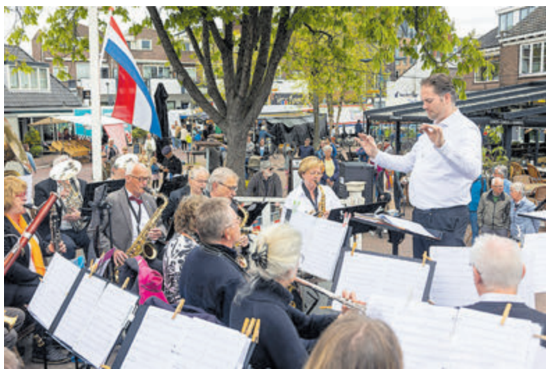
Het DOE-orkest van Emergo speelt op Bevrijdingsdag vrolijke klanken.