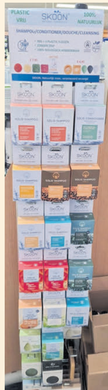
De producten van Skoon: plasticvrij, dierproefvrij en vegan.

Gezondheidsdruist Aker aan de Kerkweg 16 heeft diverse goede tips voor Moederdag. Dankzij de aantrekkelijke kortingen kunnen de moeders in onze regio flink verwend worden! Wat te denken van de make-up van Rimmel? Al sinds 1829 (!) een betrouwbaar merk in de wereld van zelfexpressie. Alle producten zijn dierproefvrij en daarom goedgekeurd door Cruelty Free International. En dan de producten van Max Factor, het cosmeticamerk dat ook door veel sterren in Hollywood is omarmd. Voor zowel Rimmel als Max Factor geldt nu tijdelijk: 1 + 1 gratis! Ook verkrijgbaar bij Aker: de bad- en doucheproducten van Skoon. Deze producten zijn 100% plasticvrij en gemaakt van uitsluitend plantaardige producten, dus volledig vegan. Nog meer inspiratie nodig? Kom naar de winkel en maak een keuze uit het ruime assortiment parfums en luchtjes, bodycrèmes en andere heerlijke bad- en doucheproducten. Volg Gezondheidsdruist Aker op Facebook voor acties en het laatste nieuws.