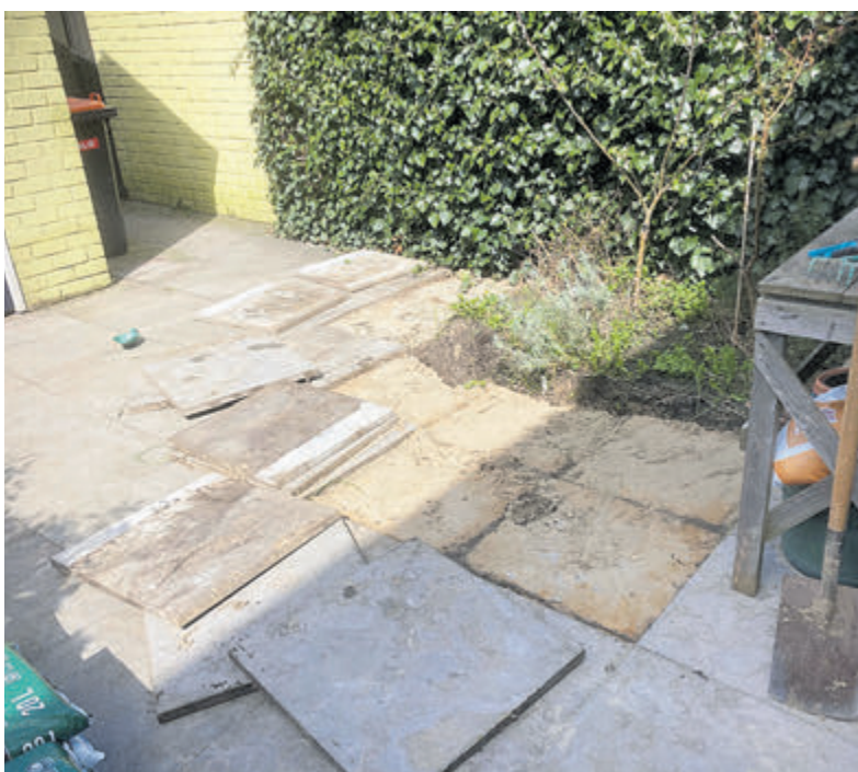
Tegels eruit, groen erin!

Regio - Tegels eruit en vervangen door groen, dat is het idee achter het NK Tegelwippen. De handige tegelophaalservice van de gemeenten Bergen, Uitgeest, Castricum en Heiloo vormden de aftrap. Inwoners gingen enthousiast aan de slag. In totaal werden meer dan 150 big bags aangevraagd voor deze actie. De big bags – gevuld met tegels – werden daarna weer opgehaald. De gewipte tegels worden hergebruikt in de wegebouw.