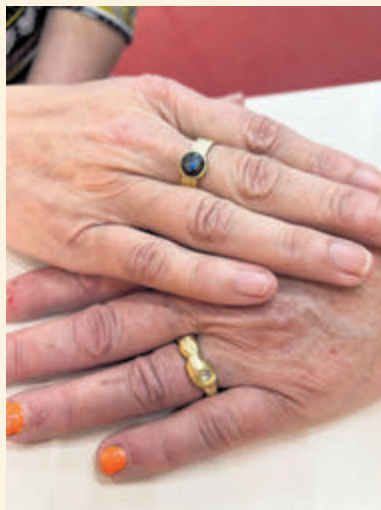
Twee nieuwe ringen met totaal verschillende ontwerpen.

Jeannette Witteman Jeann@Goudsmid Geesterduin 16, Castricum www.jeannettegoudsmid.nl