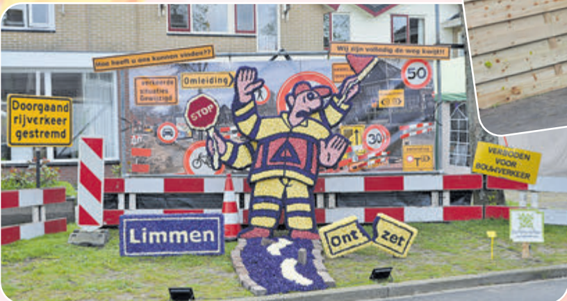
Prikploeg 'Een pakkende naam' noemde hun mozaïek 'Chaos', verwijzend naar de situatie rond de werkzaamheden aan de Rijksweg.