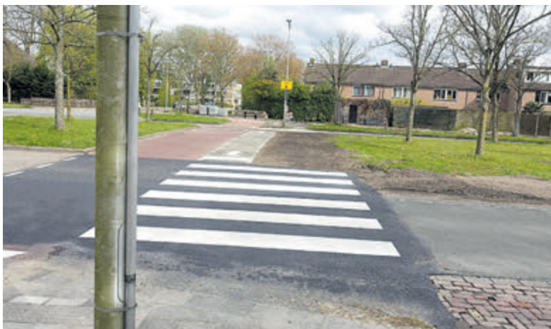
De nieuwe oversteek ter hoogte van de Walstro.

Castricum - De renovatie van de fietspaden langs de Soomerwegh vordert gestaag en wordt algemeen beschouwd als een flinke verbetering. Minder geslaagd is de heraanleg van de voetpaden op de oversteken tussen bijvoorbeeld de Mozartlaan en de Walstro of tussen de Beethovensingel en De Bloemen. Daarop is nauwelijks ruimte meer voor rolstoelgebruikers of mensen met een rollator of kinderwagen om elkaar te passeren.