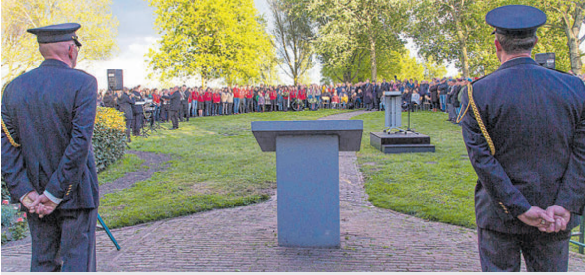
De herdenking op 4 mei krijgt een speciaal tintje.