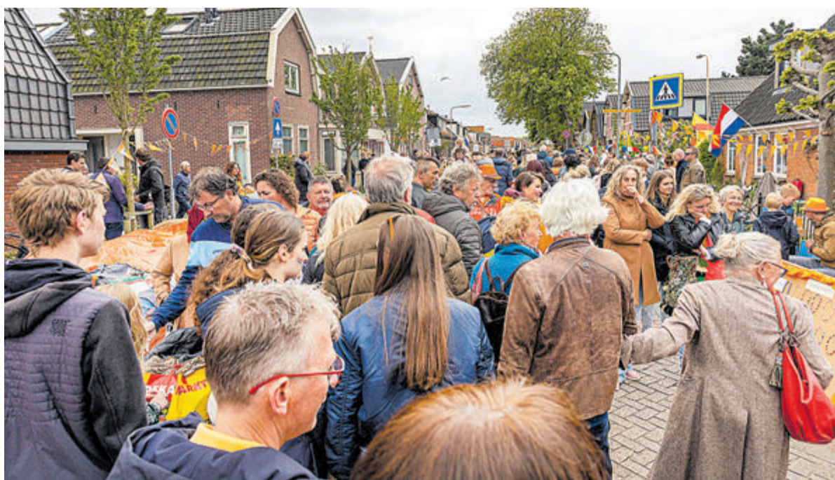
De vrijmarkt in Bakkum trekt altijd veel belangstelling.