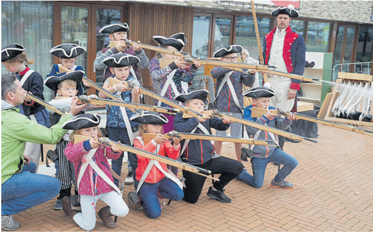
Bij de Soldatenschool kun je van alles leren.