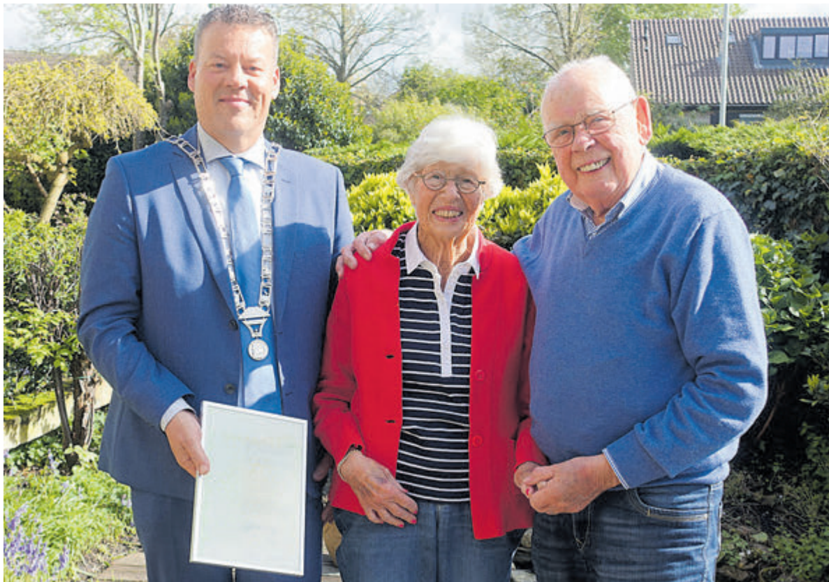
Het diamanten paar met burgemeester Tap en een kopie van de trouwakte.