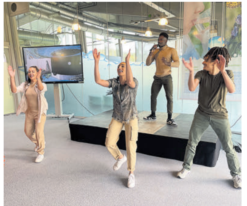
Aangevoerd door dansgroep Static Entertainment en met een gezamenlijke wave werd het bezoekerscentrum geopend.