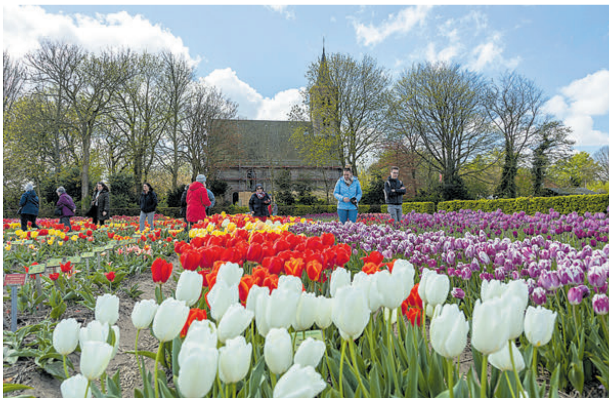
De Hortus Bulborum werd afgelopen weekend druk bezocht.

zich nemen. De plantenverkoop duurt van 09.30 tot 15.00 uur. Vanaf 11.00 uur is ook een theeterras geopend, waar naast thee, taart en koekjes ook soep wordt geserveerd. Met de opbrengst van de verkoop wordt een vlindertuin op het schoolplein aangelegd, in samenwerking met de Vlinderstichting. Tip: neem zelf een doosje of kratje mee voor de plantjes!