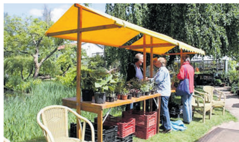
De groen- en kunstbeurs is een jaarlijks terugkerend evenement.

Kortom, het is zeer de moeite waard om dit weekend een bezoekje aan de Tuin van kapitein Rommel te brengen.