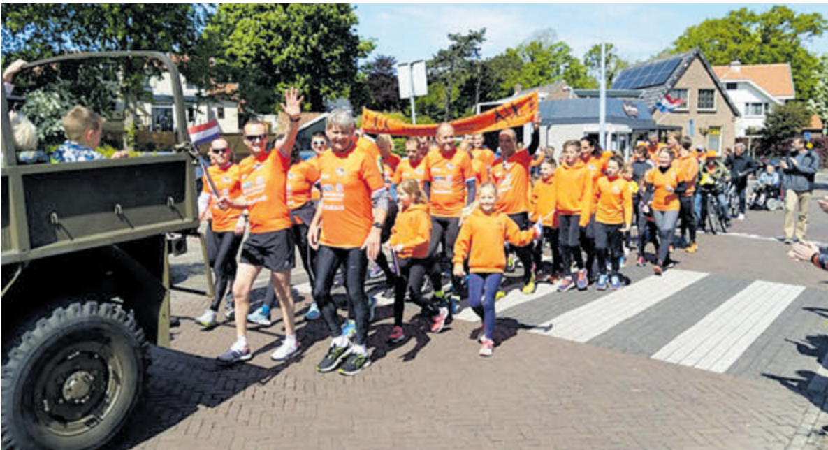
Atleten van Atletiekvereniging Castricum brengen het Bevrijdingsvuur vanuit Wageningen naar Castricum.

De herdenkingsdienst in de dorpskerk start dit jaar om 18.00 uur in plaats van 18.15 uur. Dit betekent dat de stille tocht vanaf de dorpskerk ook een kwartier eerder van start gaat (18.35 uur). Het complete programma treft u volgende week aan op de Gemeentepagina.