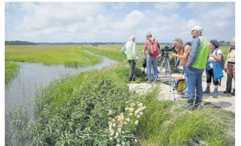
Wandelen door de omgeving in combinatie met historische informatie.

Via www.huisvanhilde.nl kunnen deelnemers zich inschrijven voor 'Wandelen door het Land van Hilde'.