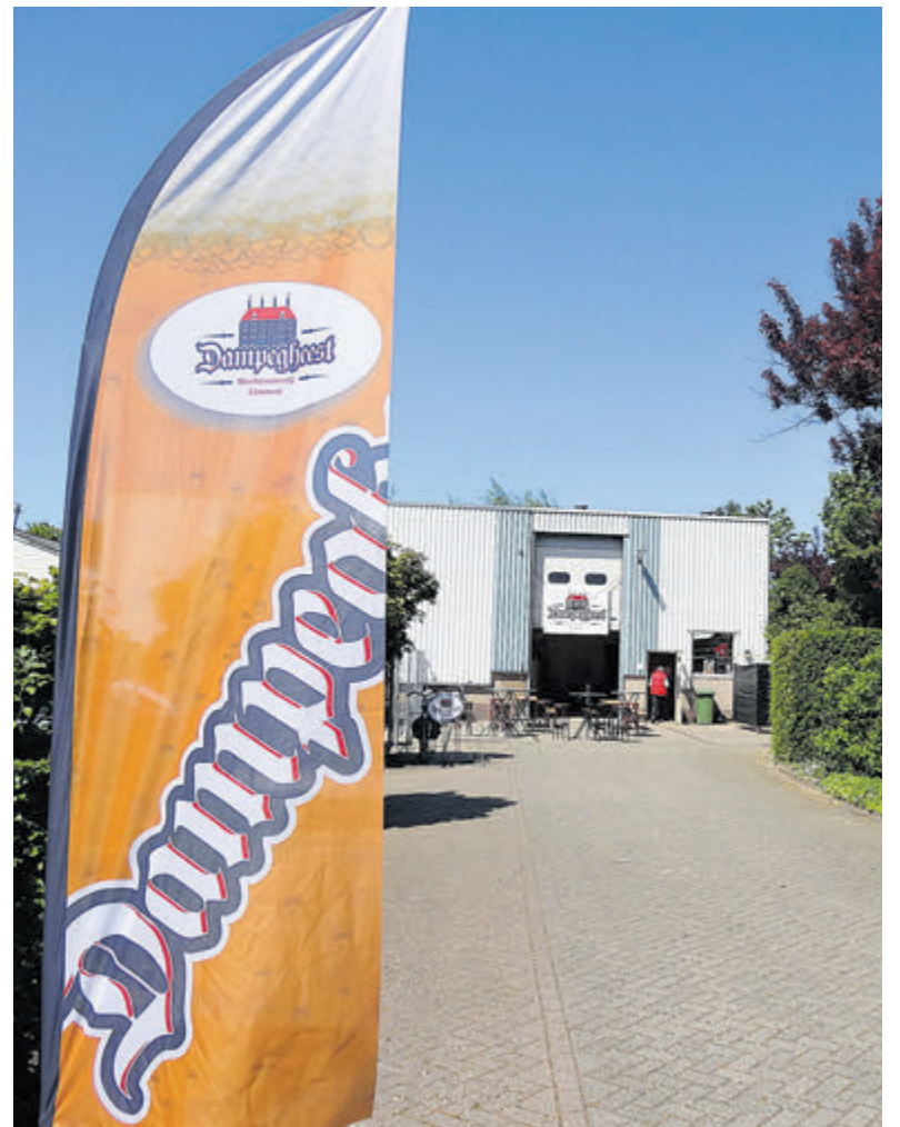
Brouwerij Dampegheest.

Aanstaande zaterdag, vroeg in de avond, is het moment suprême en worden de prijswinnaars in Vredeburg bekend gemaakt. De vakjury beoordeelt de werkstukken op kleurcombinatie, afwerking, idee en algemene indruk met een cijfer tussen 1 en 10. Het kan wel eens reuze spannend worden.