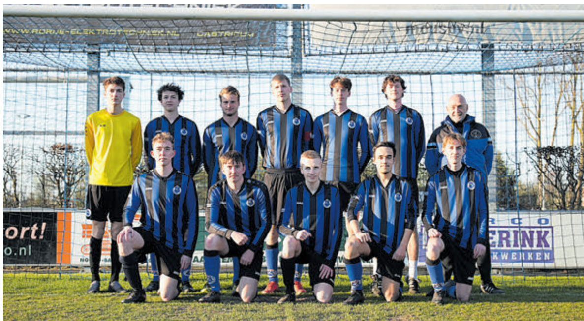
Het team van Vitesse 9.

De sfeer was opperbest en iedereen trok ook in kleiner verband met elkaar op. De meesten hebben nieuwe contacten gelegd met cursisten uit andere lesgroepen met wie ze de liefde voor het Italiaans en Italië delen. Vol taalindrucken en mooie ervaringen keerden de meeste cursisten zaterdag weer terug naar huis. Anderen lieten hun partner overkomen of reisden zelf door naar de kust of andere Toscaanse steden. De volgende taalreis staat gepland voor de week van 21 tot 27 april 2024. De bestemming zal dan Napels of Salerno zijn.