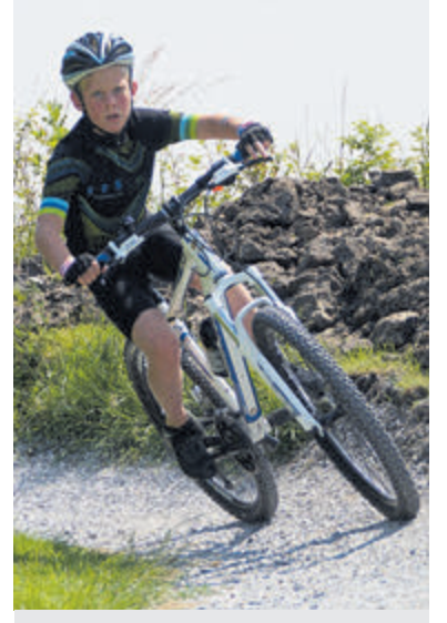
Ook mountainbiken behoort tot de mogelijkheden met JouwSportPas.

Iedereen die in de gemeente Castricum of Heemskerk woont of naar school gaat, kan gratis of voor maximaal 5,50 euro drie of vier lessen volgen bij één van de deelnemende verenigingen. Met JSP kun je ontdekken welke sport er bij jou past. Je komt niet direct voor hoge kosten te staan, zoals voor kleding, materiaal en contributie. Lid worden van de vereniging na de kennismaking mag natuurlijk wel. Er is aanbod voor kinderen, jongeren en volwassenen. Er kan kennis gemaakt worden met tennis, mountainbiken, atletiek, hockey, scouting en avontuurlijk buitensporten. Kinderen vanaf 12 jaar en volwassenen tot 45 jaar met een (licht) verstandelijke beperking kunnen kennismaken met Para-Hockey. Zit jouw favoriete sport hier nu niet bij? Kijk dan vooral even op www.noordhollandactief.nl voor het meest actuele en complete aanbod. Op de website vind je meer informatie over de inhoud van de sporten, de locaties, data en tijden.