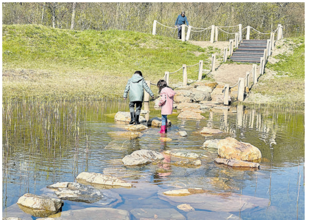
Het is een uitdaging om droge voeten te houden bij de stapstenen in de poel.