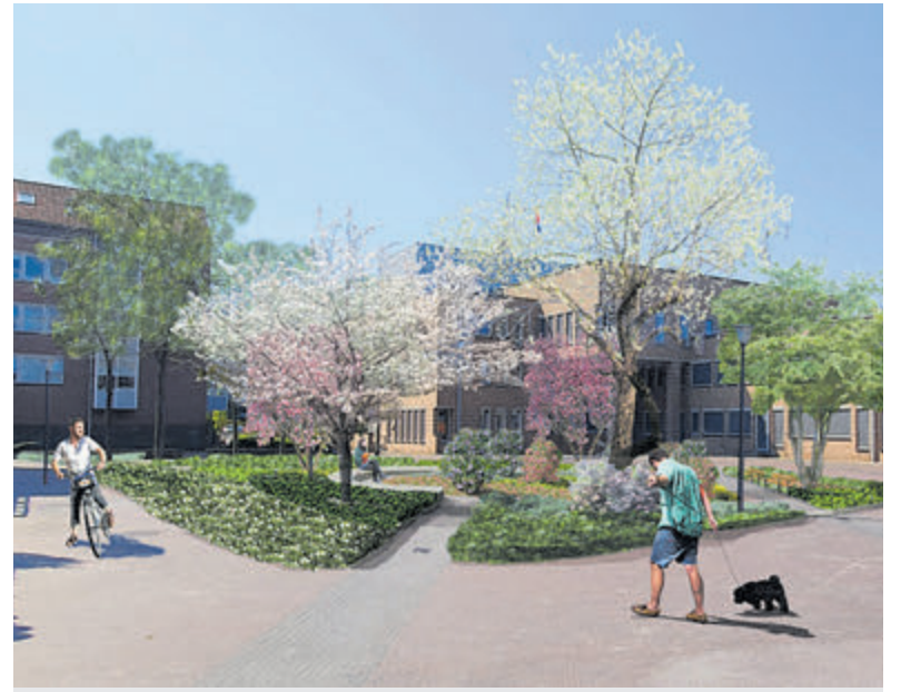
Artist impression van de herinrichting.