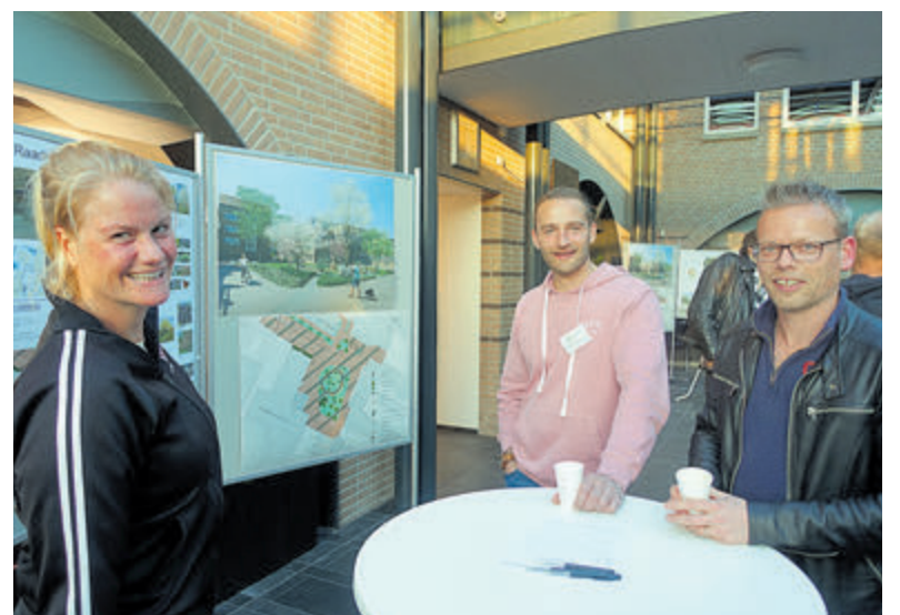
Ook deze bezoekers zien het nieuwe plein wel zitten.