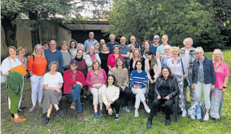
De cursisten na de laatste schooldag samen met hun docenten in de tuin van de taalschool in Lucca.

Castricum/Lucca - Ter afsluiting van het lesjaar zijn zevenentwintig leerlingen van taalschool La dolce lingua een week op taal- en cultuurreis geweest in Lucca, een volledig ommuurde stad in Toscane. Een week lang volgden de studenten iedere morgen Italiaanse les op hun eigen niveau. Sommigen vormden samen met hun medecursisten in Castricum een eigen groep. Anderen zaten in de klas met Europese, Aziatische en Amerikaanse medestudenten.