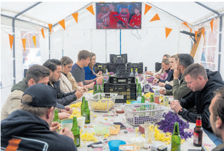
Leden van de prikploeg ‘Zilveren Gulp’ zijn gezellig met elkaar aan het bloemenritsen en het bij elkaar spelden van de hyacintbloempjes. De stemming wordt iets bedrukker als PSV voor de derde keer tegen Ajax scoort.

Het is een ongeschreven regel dat er van de ontwerpen niets naar buiten komt voordat de bloemmozaïeken aan de weg staan. De prikploegen weten onderling vaak wel van elkaar wat zij maken. Dit is handig omdat je hiermee doublures voorkomt. De verslaggever mag een blik binnen de werkruimten werpen, mits hij niets verklapt.