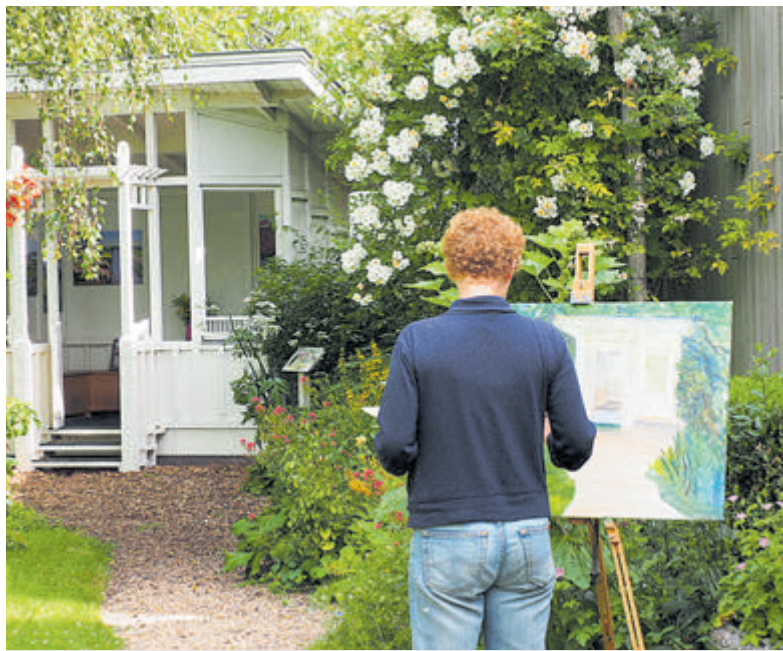
Vorig jaar was de groen- en kunstbeurs een groot succes.

Castricum - Op zaterdag 6 mei en zondag 7 mei bruist het weer in de Tuin van Kapitein Rommel. In dit weekeinde vindt de traditionele groen- en kunstbeurs plaats. De openingstijden op beide dagen zijn van 11.00 tot 17.00 uur. De tuin bevindt zich schuin tegenover het NS-station.