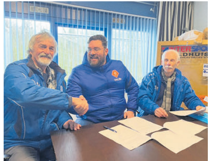
Touber tussen bestuursleden Van Splunter en Travnicek.

Inschrijven voor het derde JSP blok kan tot en met 12 mei. De kennismaking bij de vereniging of het sportbedrijf vindt plaats tussen 15 mei en 18 juni.