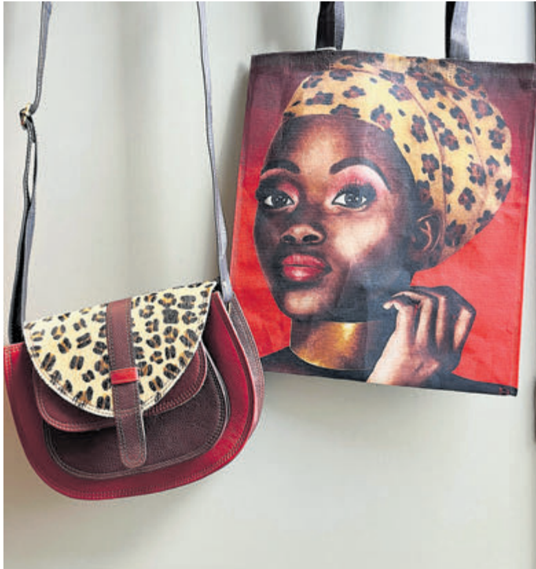
Wereldwinkel Castricum heeft tassen voor elke gelegenheid.