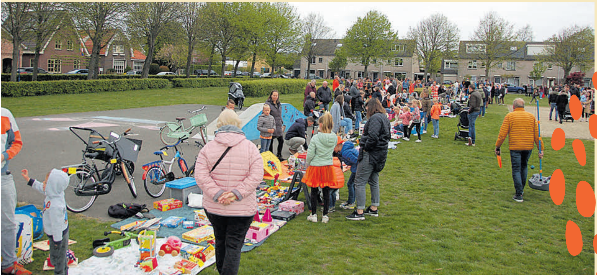
Sfeerimpressie van de activiteiten op Koningsdag in Limmen vorig jaar.