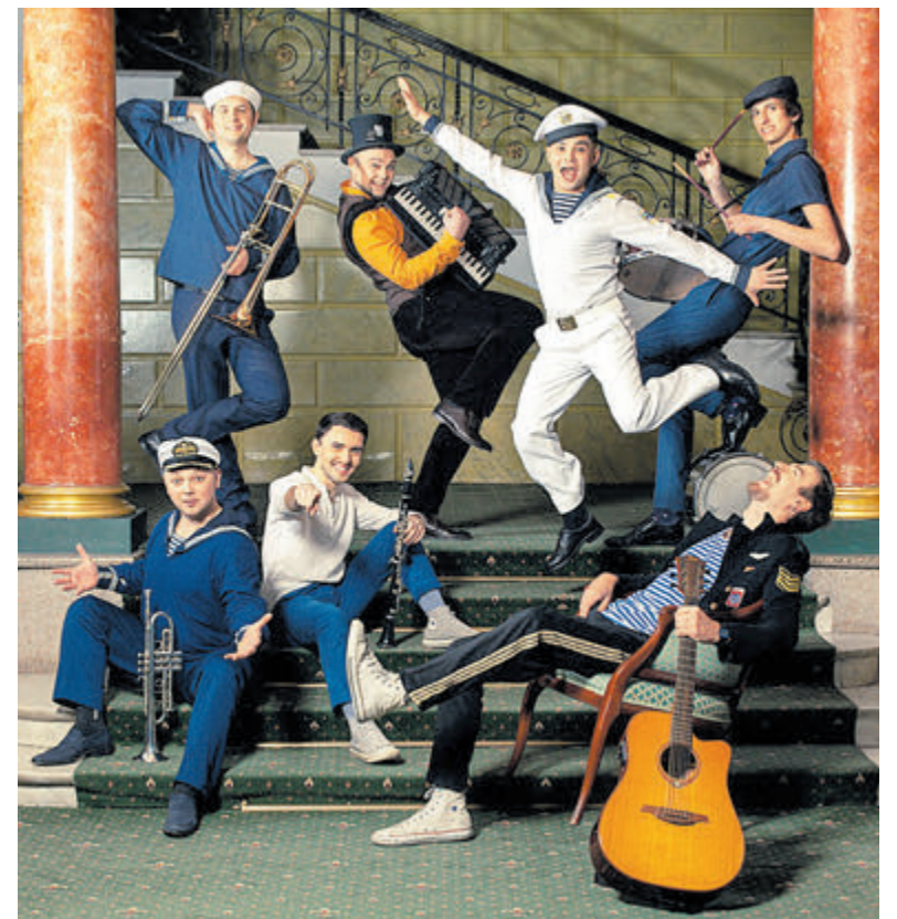
De band Kommuna Lux.