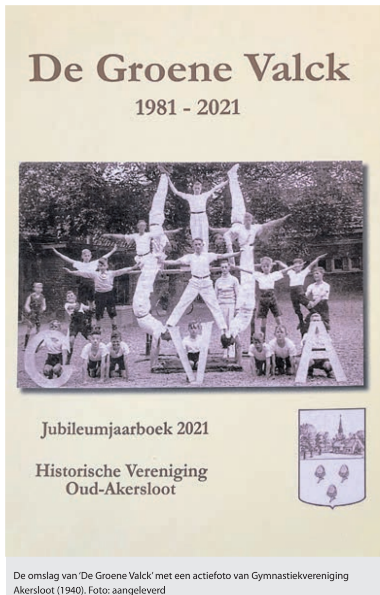
De omslag van 'De Groene Valck' met een actiefoto van Gymnastiekvereniging Akersloot (1940).