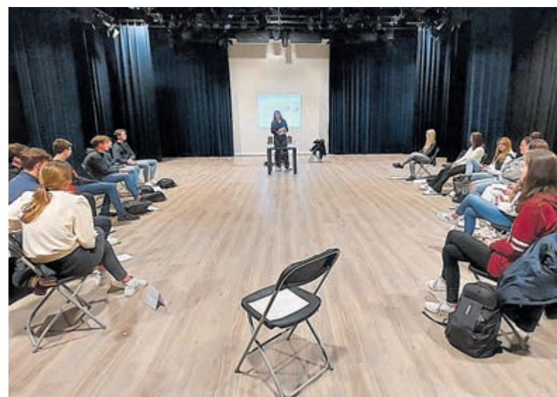
De lessen debatteren vonden plaats in cultureel centrum Geesterhage.

Na de vakantie gaan ze aan de slag met een eigen gekozen stelling en als ze dat net zo fanatiek en vurig doen als nu, belooft dat heel wat!