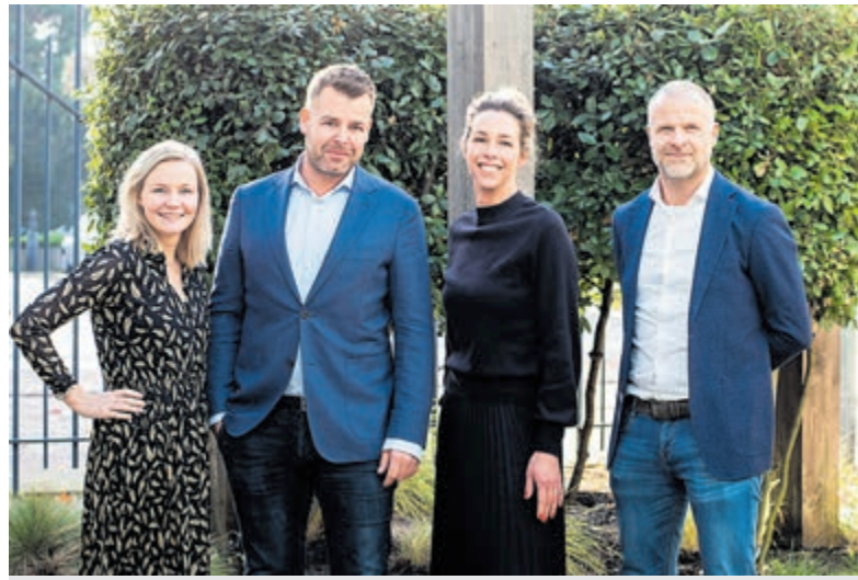
Het team van Teer Makelaars in Castricum

De Hoofdzak organiseert maandelijks een online bijeenkomst rondom een actueel thema. Deze zijn voor iedereen te volgen op de eerste donderdag van de maand van 12.00 tot 13.30 uur.