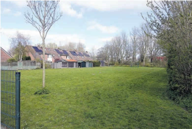
Het grasveld dat GDB en VDD willen bestemmen voor woningbouw.

Castricum - Het voormalige schoolgebouw van de Montessorischool aan de Koekoeksbloem staat alweer bijna een jaar leeg in afwachting van een nieuwe ontwikkeling. De besluitvorming hierover laat echter nog wel even op zich wachten.