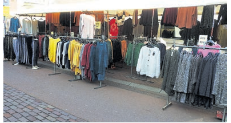
Gezelligheid weer volop met food en non-food op streek- en weekmarkt.