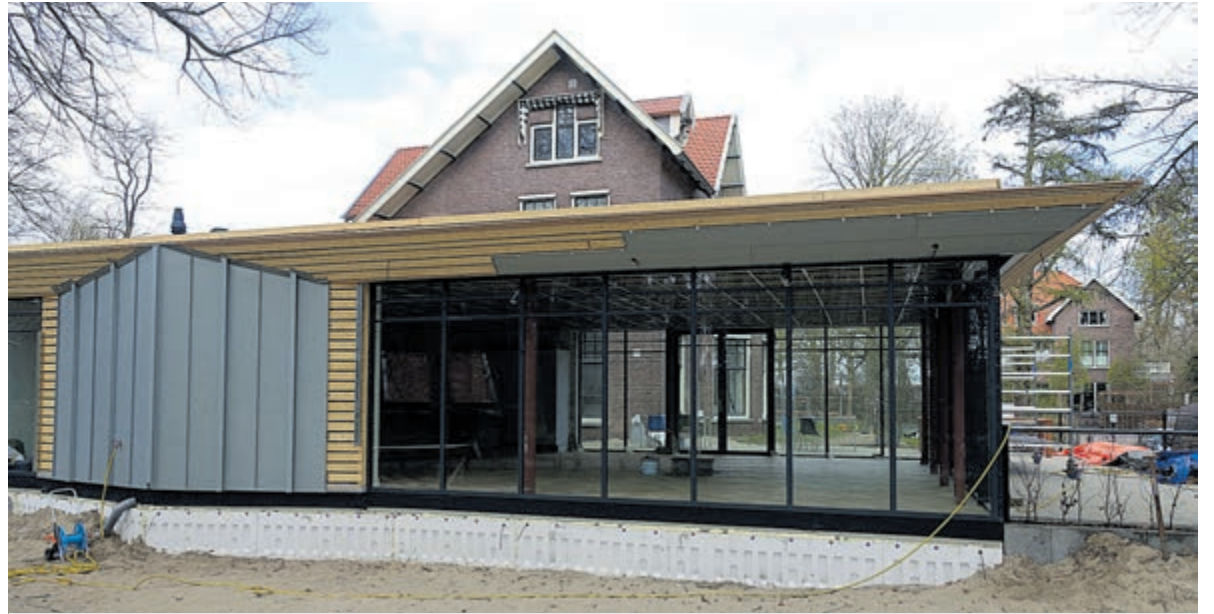
De aanbouw van de woonvorm, waarin een appartement en de gemeenschappelijke woonkamer met keuken worden gerealiseerd.