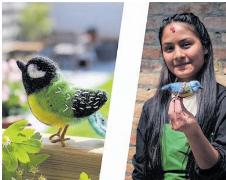
De vilten vogeltjes van 'Sjaal met een verhaal' zijn tijdelijk een euro goedkoper.

aan de C.F. Smeetslaan 4 open op de volgende tijden: dinsdag tot en met zaterdag: 10.00 - 17.00 uur. Het laatste nieuws van Wereldwinkel Castricum vind je op Facebook en Instagram.