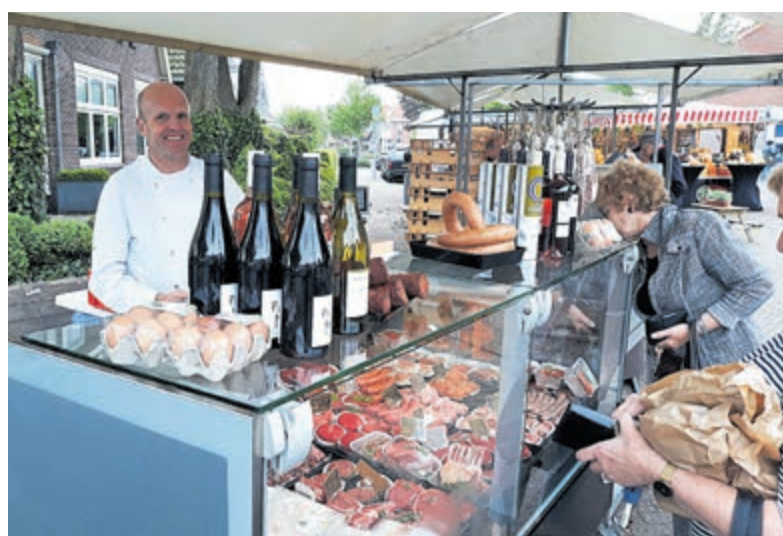
Elke woensdag een keur aan versproducten op de streekmarkt.

Een andere mogelijkheid om uw maandlasten te verlagen is natuurlijk verhuizen. Hierdoor bent u ook boetevrij van uw huidige hypotheek verlost. Een nieuw huis in een iets hogere prijs categorie als uw huidige woning zorgt er in veel gevallen evengoed voor dat uw maandlasten lager uitvallen. Dit komt door een gunstig rentepercentage van de nieuwe hypotheek. Het team van Teer Castricum informeren belangstellenden graag over de waarde van de huidige woning en kunnen helpen in het zoekproces naar een nieuwe woning. Neem contact op om de mogelijkheden te bespreken: 0251 745630 of door een e-mail naar castricum@teer.nl te sturen.