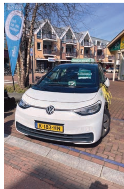
De deelauto op de zondagsmarkt in Castricum

De werkgroep mobiliteit zoekt nog enthousiaste mensen als gangmakers voor dit project in nieuwe buurten, ook in Limmen, Akersloot en de Woude. Mail ons!