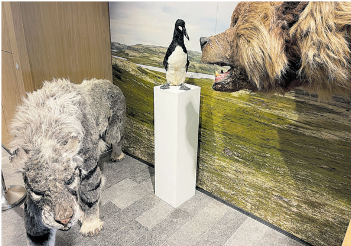
Links voor: een reconstructie van de sabeltandkat zoals te zien bij de tentoonstelling.