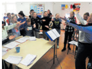
Repeteren uit volle borst bij vele scholen in de regio Castricum.

De kaartverkoop start haverwege mei, dus let op berichten in de media of kijk op www.kidsinconcert.nl voor meer informatie.