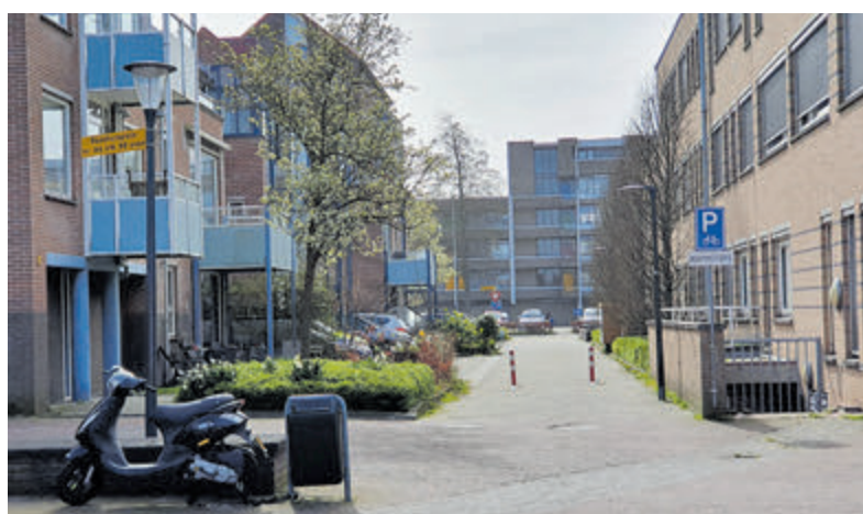
Rechts op de foto de plek waar de fietsen worden ingezameld.