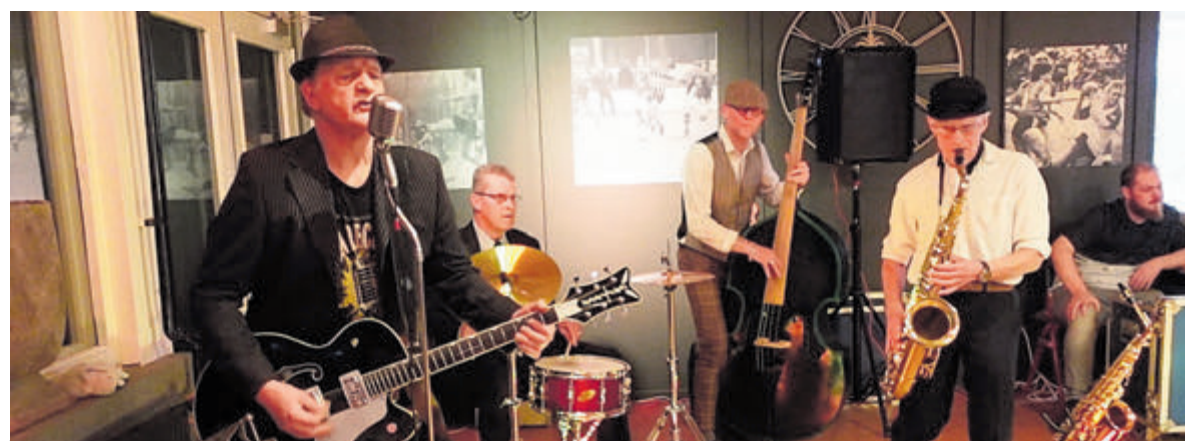
'Twisting Jive' is een swingend nummer, waarop goed gedanst kan worden.

De clip is via www.youtube.com/watch?v=oTyFg7U6tgU te bekijken. Op het kanaal Wep Music is nog meer muziek van de twee broers te vinden.