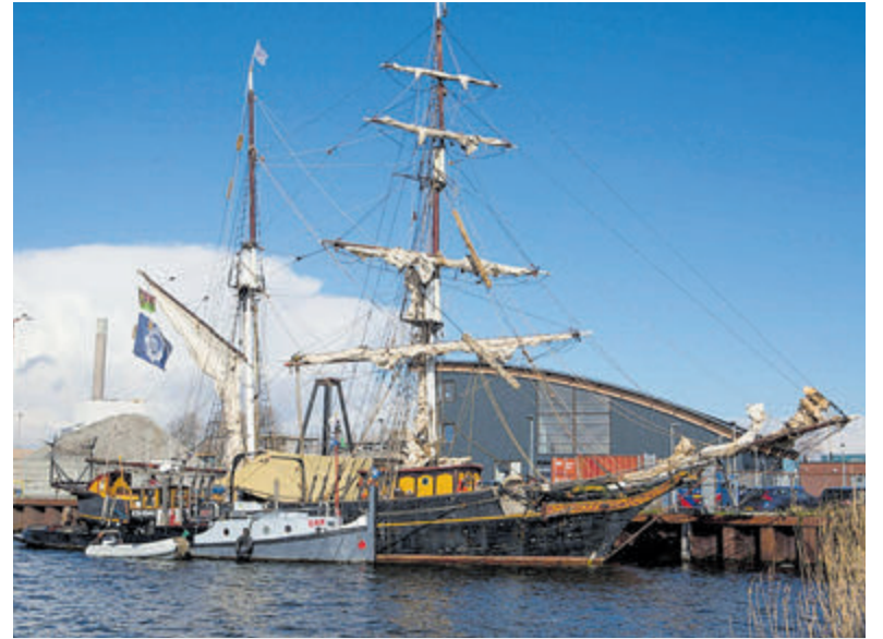
Het uit 1943 stammende schip waarmee men de cacao vanuit de Dominicaanse Republiek naar Nederland brengt.

Castricum - Drie brutale jongens van 13 en 14 jaar oud waren vorige week maandagavond op het parkeerdek bij winkelcentrum Geesterduin, waar ze voorbijgangers met behulp van waterpistolen natspoten. Niet iedereen was daarvan gediend. Twee mannen besloten (onafhankelijk van elkaar) de jongens op hun gedrag aan te spreken. Eén van hen greep daarbij één van de jongens bij zijn kraag. Hierbij ging een ketting kapot. De andere man drukte één van de jongens tegen een muur. De politie heeft de ouders van de jongens op de hoogte gesteld van hun gedrag. De ketting wordt in onderling overleg vergoed.