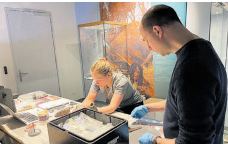
Conservatoren aan het werk met de inrichting van de tentoonstelling.

Castricum - Stel je eens voor: vanaf het Castricumse strand kijkend naar de zee. Daar was ooit land. Al in 1913 concludeerde een Britse geoloog dat er waarschijnlijk een prehistorisch en bewoond landschap onder de Noordzee ligt. Inmiddels weten we dat dit 'Doggerland' een van de belangrijkste archeologische vindplaatsen van Europa is. Anders dan het legendarische Atlantis, waarvoor nooit bewijzen zijn gevonden. Die zijn er wel voor het bestaan van Doggerland. Dat bestaat feitelijk nog en ligt diep begraven onder de Noordzee.