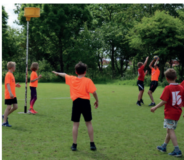
Kinderen kunnen zich via hun school aanmelden voor deelname.