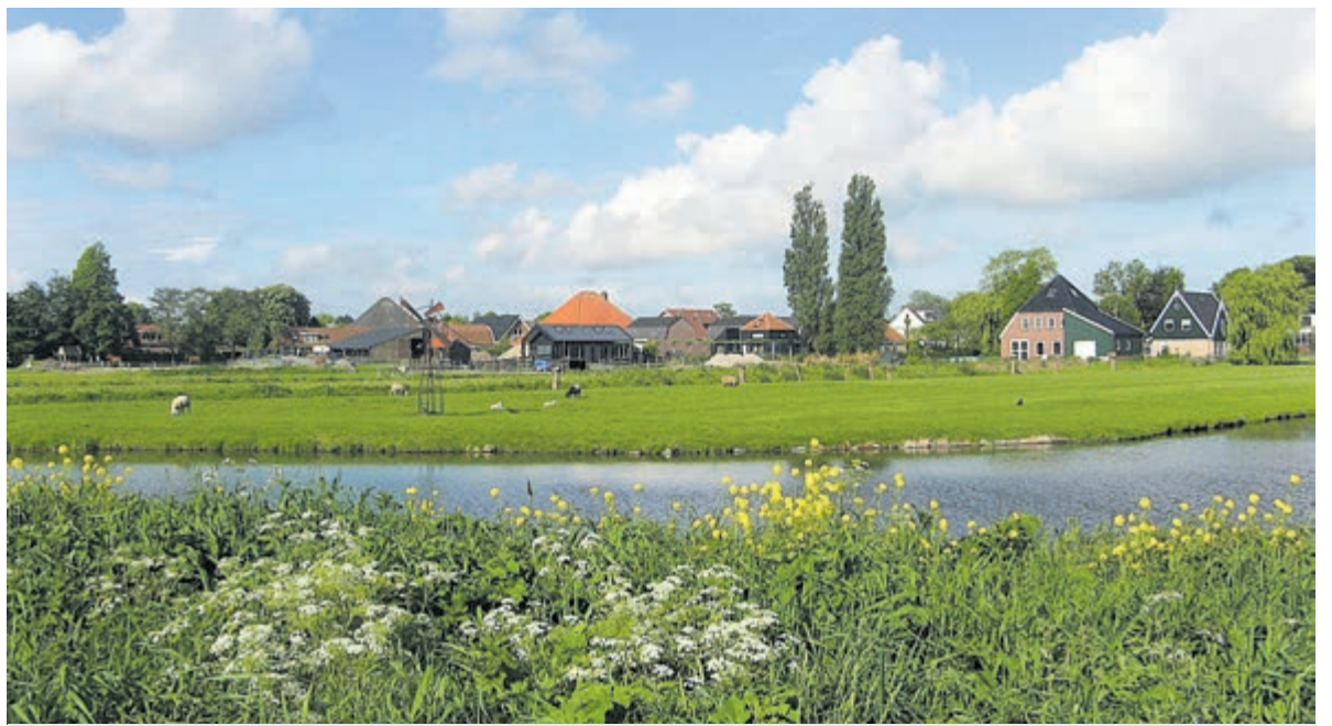
De stichting zet zich in voor het behoud van natuurlijke en cultuurhistorische kwaliteiten in het buitengebied, zoals dit mooie landschapsbeeld aan de oostrand van Uitgeest.

Evert Hofland, namens Overleggroep Zanderij Autoluw