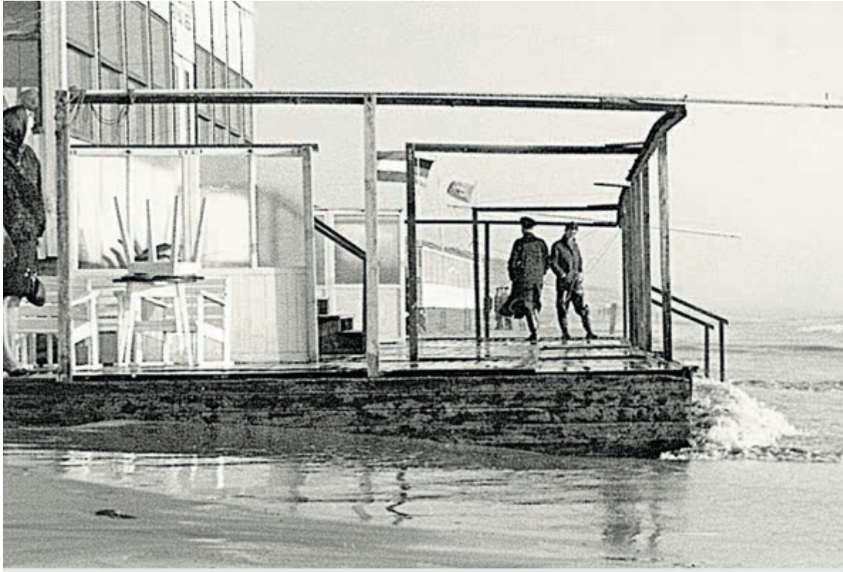
Schade aan paviljoen Zee- en Strandzicht in 1965.