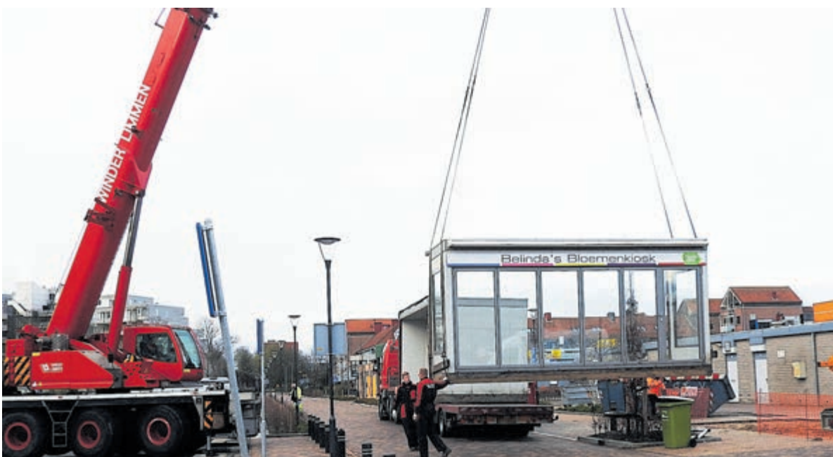
De tijdelijke verhuizing in beeld gebracht.

geleden werden verkocht voor zes à zeven ton. De villa's daarachter kenden toen al een vraagprijs van ruim een miljoen.” Overigens wordt de uitkomst van het onderzoek van Calcasa niet bevestigd als je op Funda zoekt naar woningen in deze categorie. „Op dit moment staan er boven een vraagprijs van een miljoen vier woningen te koop in Castricum en één in Limmen. In 2019 zijn er in Castricum zeven woningen van meer dan een miljoen verkocht. Dat waren er in 2020 ook zeven en in 2021 zijn dat er al drie. In Limmen ging het in 2019 om zes woningen, in 2020 om één woning en dit jaar heeft er nog geen transactie plaatsgevonden in deze prijsklasse. Dat geldt ook voor Akersloot, waar vorig jaar drie woningen werden verkocht die duurder waren dan een miljoen”, aldus Hopman.