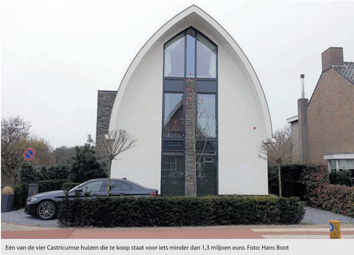
Eén van de vier Castricumse huizen die te koop staat voor iets minder dan 1,3 miljoen euro.