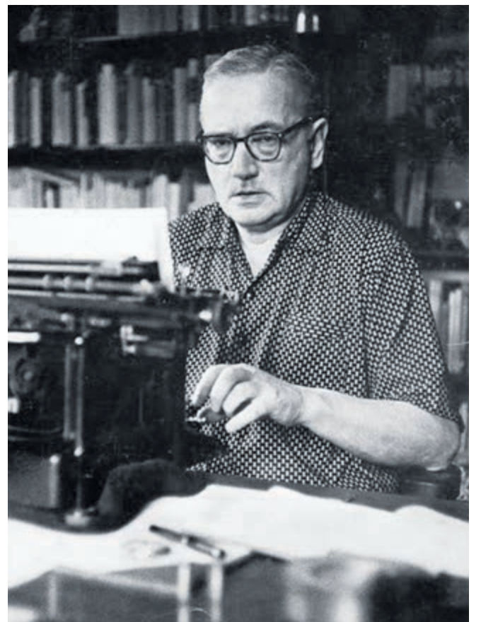
Simon Vestdijk aan het werk op zijn oude Remington, jaren vijftig.

Wat weinig mensen weten is dat Vestdijk heel veel essays heeft geschreven, alsmede complete boeken en recensies over klassieke muziek, uitgebracht in een verzameleditie van tien delen. Bijvoorbeeld over de toen relatief onbekende Finse componist en violist Jean Sibelius, die waarschijnlijk daardoor in Nederland meer populariteit genoot. Verder schreef hij onder meer over componisten Gustav Mahler en Anton Brückner. Daarnaast schreef hij een zeer theoretisch en moeilijk werk over hoe de muziek van Bach in elkaar zit.