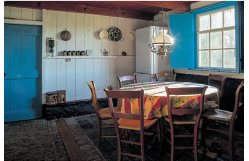
De keuken werd in 1934 verbouwd, maar bevat nog enkele elementen uit het oorspronkelijke bouwjaar.

In de aangrenzende dars toont de vloer nog meer sporen van de aanwezigheid van Duitsers. Eric wijst naar de vele inkepingen in het hout. „Als het buiten regende hakten de Duitsers binnen houtjes