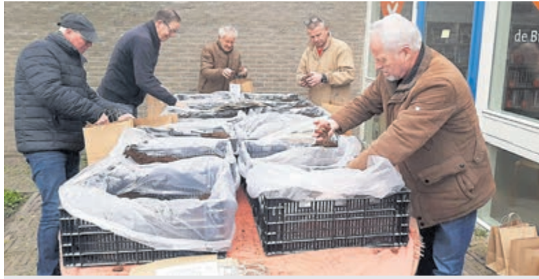
De lilies zijn geleverd door Van Diepen Bloemen, dat bovendien vele lilies extra doneerde om de gemeentelijke plantsoenen op te sieren.