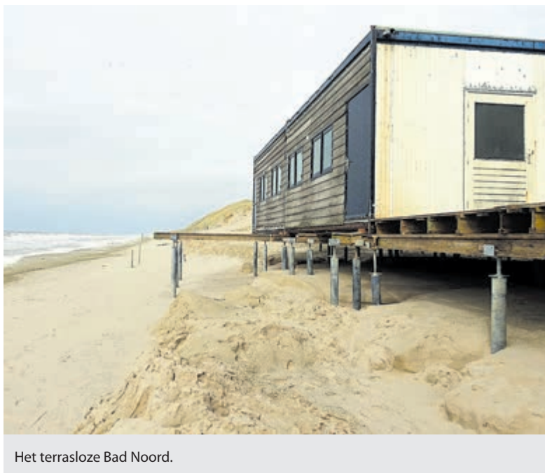
Het terrasloze Bad Noord.