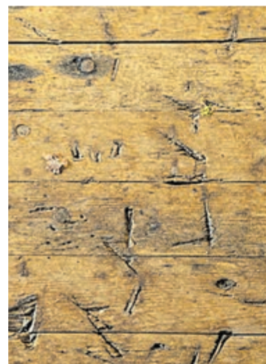
Links: inkepingen in de vloer duiden op de aanwezigheid van de Duitsers tijdens WO II. Rechts: veldmaarschalk Erwin Rommel bezocht Wn37 op 24 maart 1944.