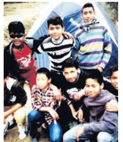
De kinderen uit het kindertehuis in Kathmandu op kampeervakantie.