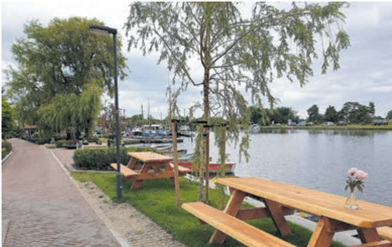
De Woude is weer ingericht voor bewoners, wandelaars en bezoekers.