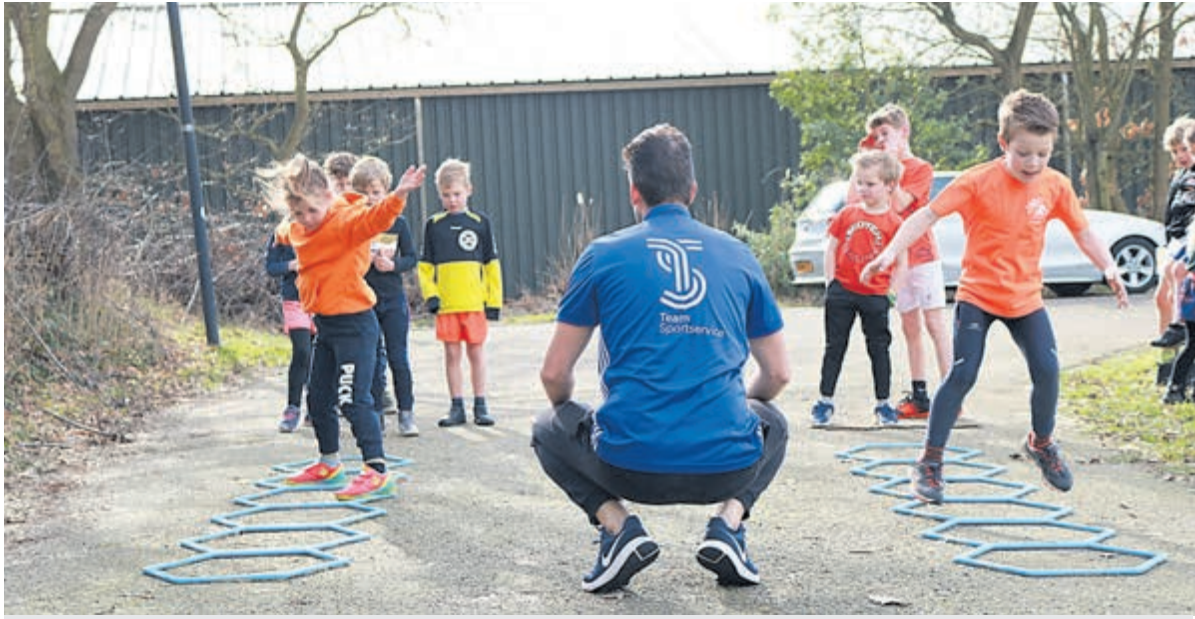
Alle genoemde sportactiviteiten worden gratis aangeboden.