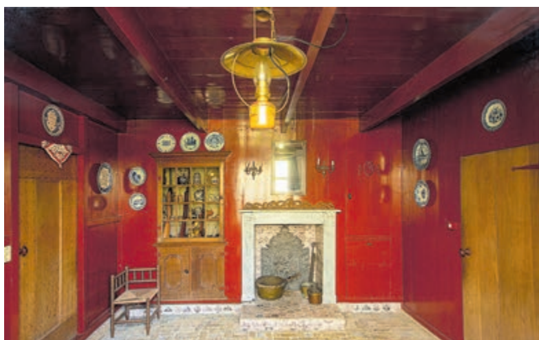
De vroegere huiskamer met links een renaissancestijl vitrinekast en rechts ervan een schouw uit 1934.

- Stichting Werkgroep Oud-Castricum - Rapportage 'Bouwhistorische Opname Boerderij Berwout' van VIS Restauratie Architecten