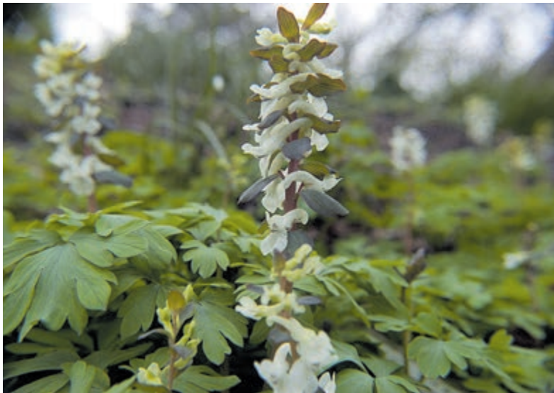
De corydalis, ook wel voorjaarshelmbloem of vingerhelmbloem genoemd, staat rond deze tijd een volle bloei.

Via www.vrijwilligersacademiebuch.nl kunnen deelnemers zich aanmelden. De workshop duurt van 20.00 tot 21.15 uur. Voor eventuele vragen kan contact worden gelegd met Sigrid Wijsman via nummer 06 48500912.