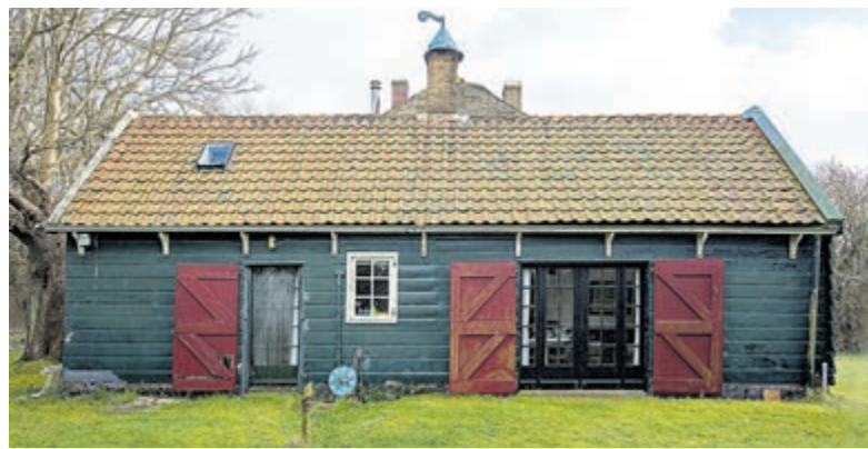
De 'Paardenstal' is eind jaren 40 omgebouwd tot vakantiehuisje.

damse slooppanden. In de zomer, als het vee buiten liep, woonde men in de stal. De woonkamer doet nu dienst als logeerkamer.“ Rooyaards' voorliefde voor de Hollandse renaissance blijkt uit de vitrinekast, die zich voorin bevindt. De schouw uit 1934 draagt bij aan de romantische sfeer.