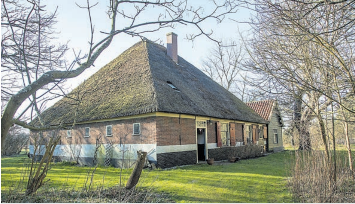
De voorgevel van boerderij Berwout vanaf de zuidoosthoek gezien. Het exterieur van de stolpboerderij is sinds de bouw (1866-1869) vrijwel intact gebleven.

Castricum - Verscholen in de duinen, op de grens van Castricum en Egmond, ligt duinboerderij Berwout. Deze stolpboerderij werd tussen 1867 en 1869 gebouwd. Binnen lijkt het of de tijd heeft stilgestaan. Je waant je terug in de jaren twintig van de vorige eeuw. Boerderij Berwout kent een rijke geschiedenis.