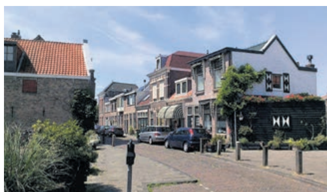
Haarlem, Dijkstraat gezien vanaf de Oostvest. Hier lag Vestdijks grootvader te vondeling. Vandaar de naam Vestdijk.