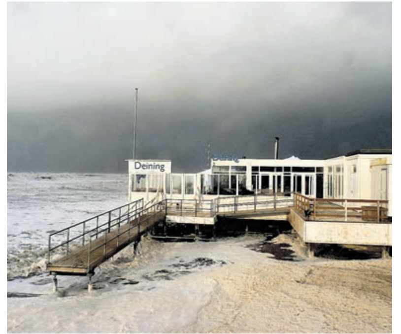
Deining op 5 januari 2012.

Kortom, het laatste woord over deze heikele problematiek is nog niet gezegd. Het is ook voor de strandondernemers te hopen dat de terrassen eind april weer open mogen, zodat er alvast iets van de omzetschade is terug te halen.