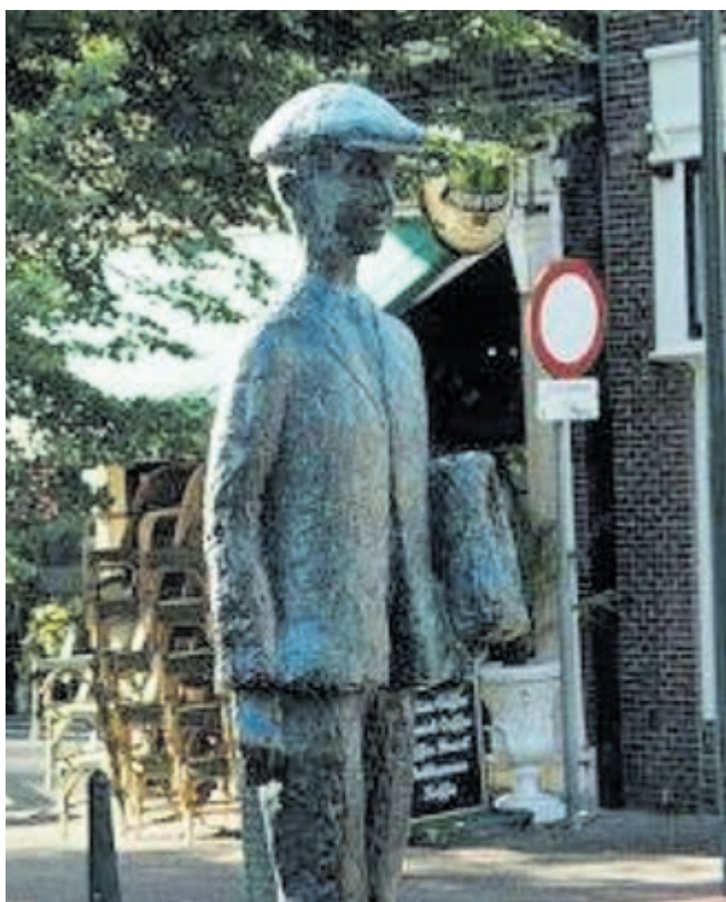
Beeldje Anton Wachter in Harlingen, de bekendste romanfiguur van Vestdijk, en Vestdijks geboorteplaats.