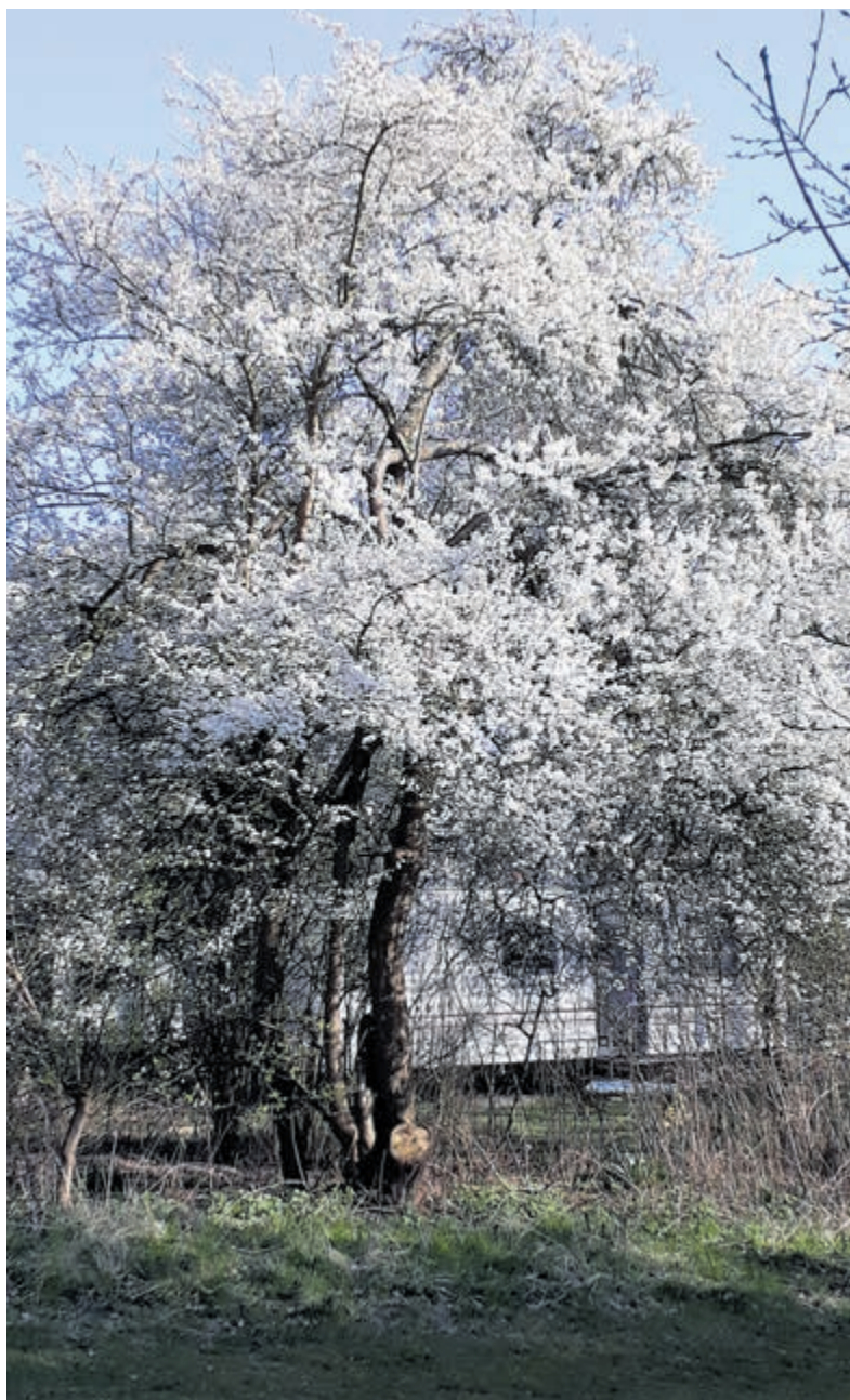
De Sleedoorn, gezien op Camping Bakkum, begin april in volle bloei.

Castricum - Elke maand wordt door Transitie Castricum de boom van de maand gekozen. Lezers van deze krant kunnen zelf hun favoriete boom hiervoor nomineren. Niet alleen de boom zelf, maar ook het verhaal erachter, is daarbij van belang. Deze maand de sleedoorn.