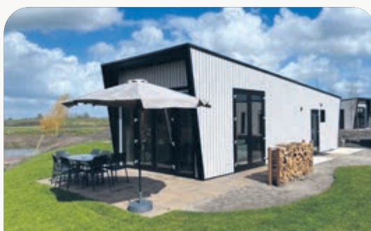
Just Nature Light