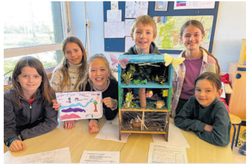
De leerlingen van de DWS-groep IJmond met hun prijswinnende idee.

tot de lente zich aandient. De afstering kan namelijk door winterstorm worden bedolven onder zand of juist in zee belanden en dat zou zonde zijn. De houten palen kunnen dankzij opslag jarenlang worden hergebruikt. Het is elk jaar een uitdagende klus voor het onderhoudsteam van HHNK, want in de twee weken voor Pasen zijn dagelijks wel tien man nodig om de klus te klaren. Toch melden zich elk jaar voldoende medewerkers. Ook enkele collega's van kantoor zien hierin een uitgelezen kans om kennis te maken met het werk buiten. Zo wordt al samenwerkend op het strand de lente ingeluid.