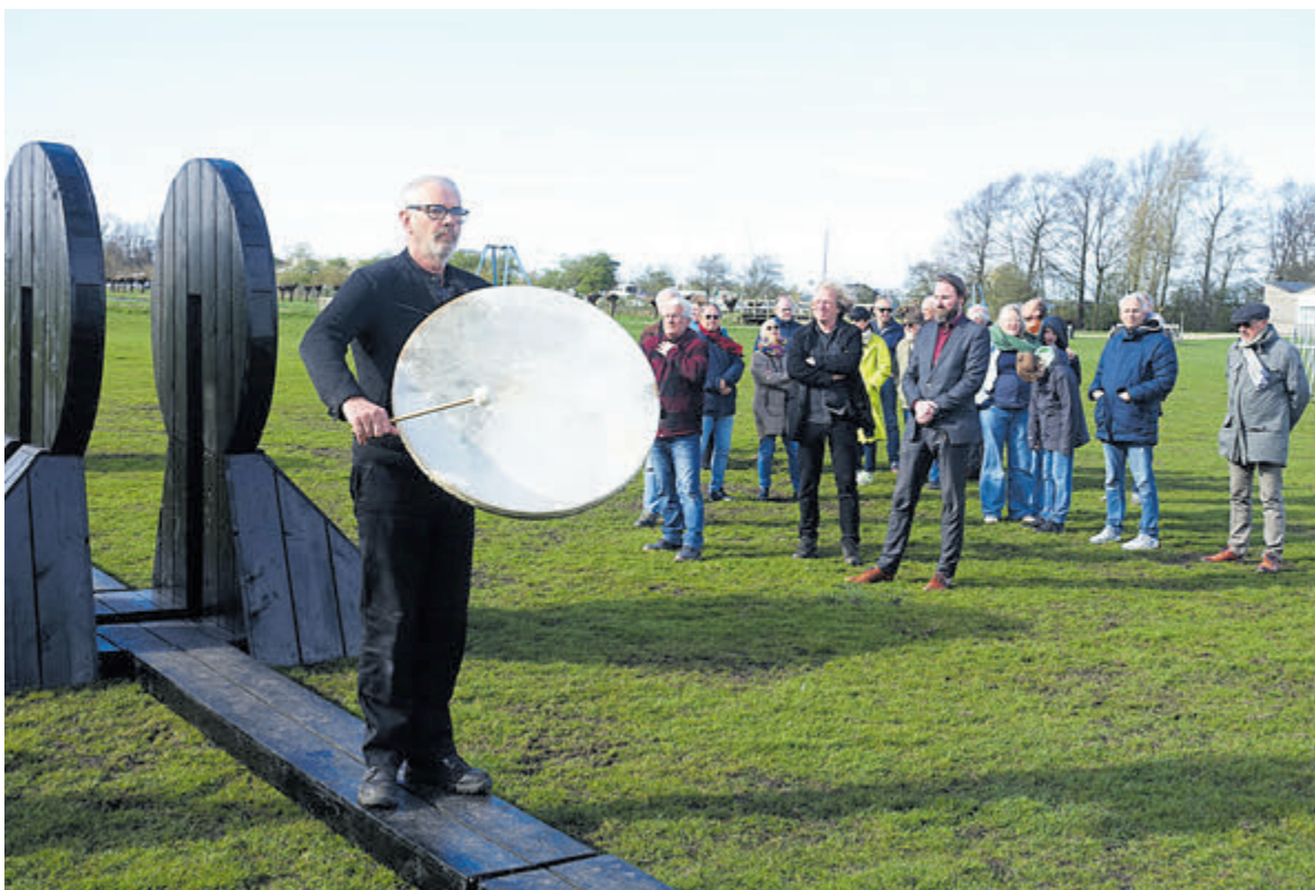
De ontwerper van Contemplatorium doorloopt het kunstwerk.

nisatoren stellen. Zij kunnen dan vertellen over de tennislessen, de competities, de toernooien en allerlei andere leuke activiteiten die de jeugdcommissie organiseert voor de jeugdleden. Graag tot 10 april op sportpark Berg en Bal!