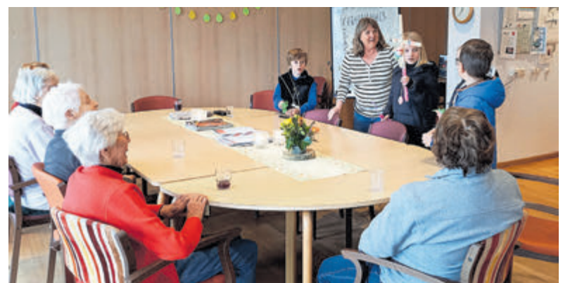
Leerlingen van kindcentrum Helmgras overhandigen paaseitjes en palmpaasstokken aan de ouderen van De Boogaert.

versierd met lint en mooie kralen. Ook tijdens de buitenschoolse opvang hebben ze hieraan gewerkt. Woensdag was het tijd om de ouderen te verrassen. In woonzorgcentrum De Boogaert hebben de kinderen de mooi versierde stokken en lekkere paaseitjes overhandigd, lente-liedjes gezongen en iedereen een fijn Pasen gewenst.