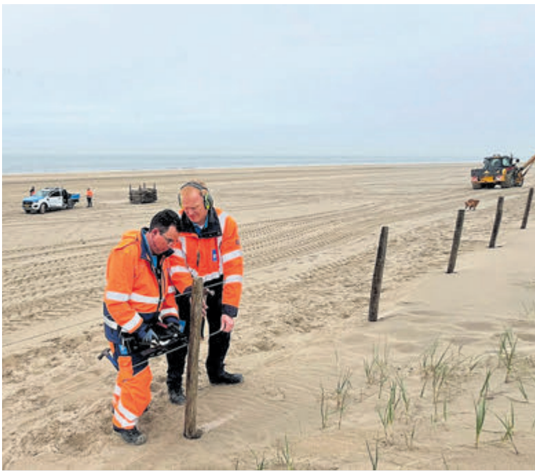
Het draad wordt gespannen en vervolgens vastgezet.

buren, bleek daar geen sprake te zijn van werkzaamheden aan het dak. Toen ze contact opnam met Oranjedak, bleek dat dit bedrijf helemaal niet actief is op de particuliere markt. De werkwijze van de man was daar echter wel bekend, aangezien er vorig jaar meerdere soortgelijke meldingen zijn geweest, onder meer uit de regio Hilversum. De redactie van deze krant vond ook een melding van een soortgelijk incident in Scheveningen, afgelopen najaar. De politie laat desgevraagd weten de melding te onderzoeken. Men raadt aan om vermoedens van oplichting altijd bij de politie te melden en bij een verdachte situatie altijd direct 112 te bellen. Op www.castricummer.nl geeft de politie een aantal tips om te voorkomen dat je slachtoffer van oplichting wordt.