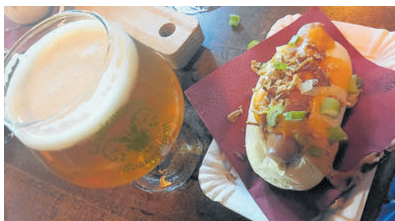
Een lekker hapje bij het eerste glas bier op elke locatie.