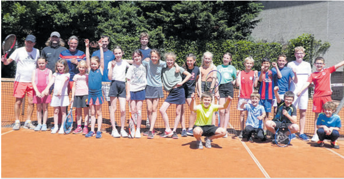
Groepsfoto na afloop van een eerder georganiseerde tennisclinic.