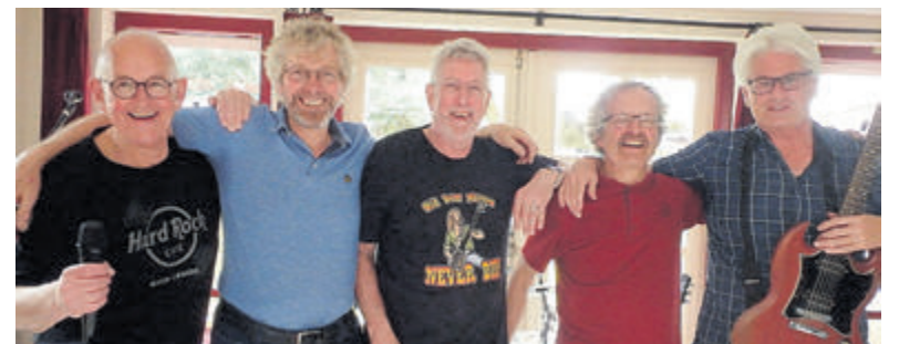
Alle bandleden van Oker zijn inmiddels met pensioen en brengen gezamenlijk een paarhonderd jaar aan muzikale ervaring mee.