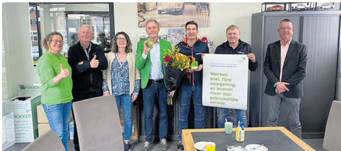
Het team van P. Zonneveld BV is trots op de erkenning van de klanten.

Limmen - Dat Autoschadespecialist P. Zonneveld BV een betrouwbaar en deskundig adres is voor autoreparaties, hoeft je de vaste klanten allang niet meer te vertellen.