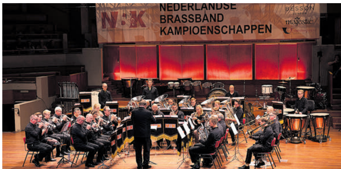
Backum Brass tijdens de Nederlandse Brassband Kampioenschappen in Utrecht