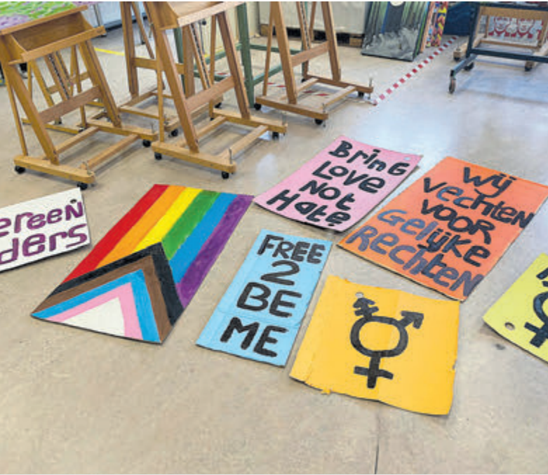
De gemaakte decorstukken voor de nieuwe musical 'Super-strak Haarlak'.

Castricum - Vorige week bundelden leerlingen en ouders van JPTeens on Stage hun krachten om het decor te maken voor de aanstaande voorstelling 'Super-strak Haarlak', geïn-