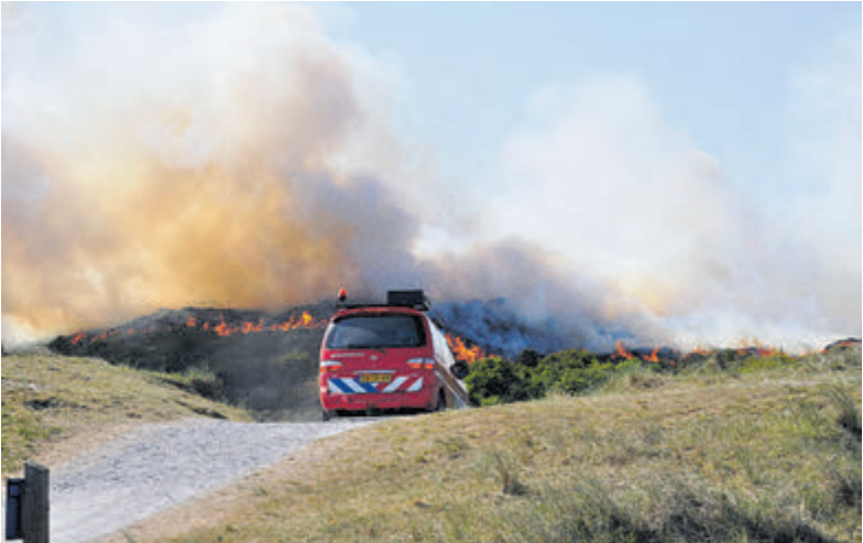
Duinbranden kunnen zich door de unieke begroeiing zeer snel uitbreiden. Door nieuwe technieken kan de bestrijding ervan sneller en efficiënter plaatsvinden.

Wervingscampagne Het enthousiasme en de beleving van Pascal kan anderen wellicht inspireren om ook eens een kijkje te nemen bij de brandweer. Deze mogelijkheid is er, want vanuit de Veiligheidsregio Noord-Holland Noord is op 1 maart een wervingscampagne gestart waarbij de brandweerkorpsen in de regio (waaronder Castricum) open oefenavonden organiseren. Geïnteresseerden kunnen hierbij ruiken aan het vak van brandweerman. De open oefenavond in Castricum is op dinsdag 2 april om 19.30 uur. Er zijn wel een paar voorwaarden om bij de brandweer te komen: je moet minimaal 18 jaar zijn, een goede gezondheid hebben en de brandweerkazerne moet binnen enkele minuten vanaf je woon- of werkadres te bereiken zijn. Meer informatie, ook over het aanmelden, is te vinden op brandweervrijwilligerworden.nl . Het is kort dag, dus meld je snel aan.