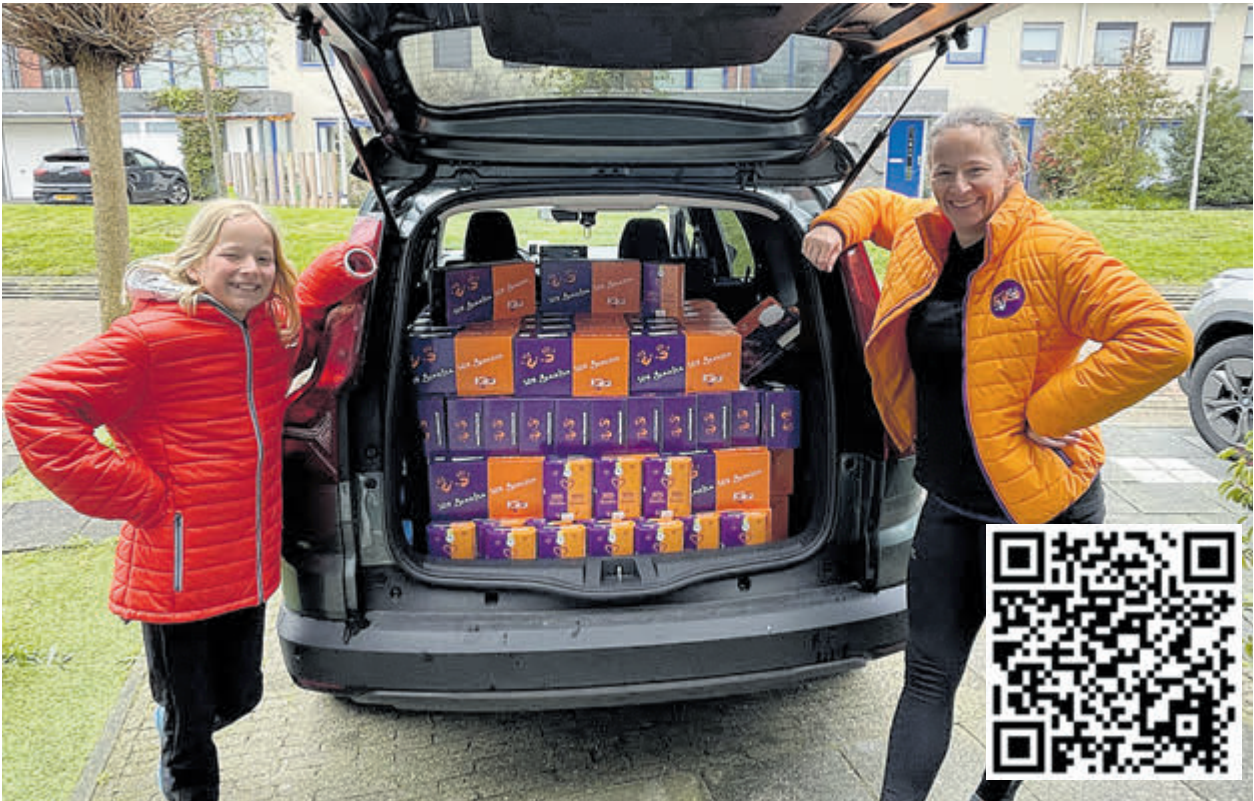
Alle bestellingen zijn inmiddels bezorgd.

seren van buurtgerichte acties, je verdiepen in een nieuwe dienst van CALorie (of een bepaald aspect van verduurzaming), het houden van een presentatie en het onderhouden van contacten in de regio. In veel gevallen komt in de projecten een IT-component naar voren; kennis op dit gebied is zeer welkom. Je krijgt een opleiding tot energiecoach om ontbrekende kennis te verbreden en te onderhouden. Ook krijg je de beschikking over meetapparatuur en software om het gesprek te ondersteunen. Oriënteer je verder via www.calorieenergie.nl en stuur een e-mail naar energiecoaches@calorie-energie.nl om een belafspraak te maken.