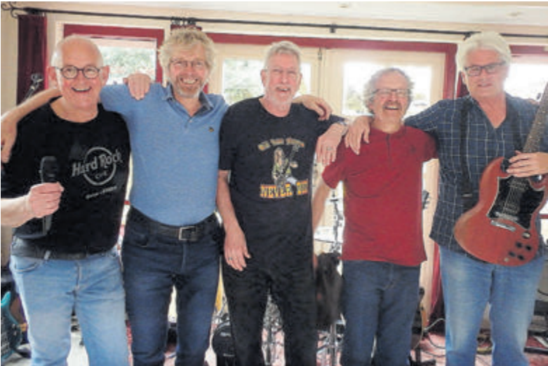
Rock en bluesband Oker.

Kaarten zijn via de QR-code op posters in de gemeente en via www.jpthejsse.nl te bestellen.