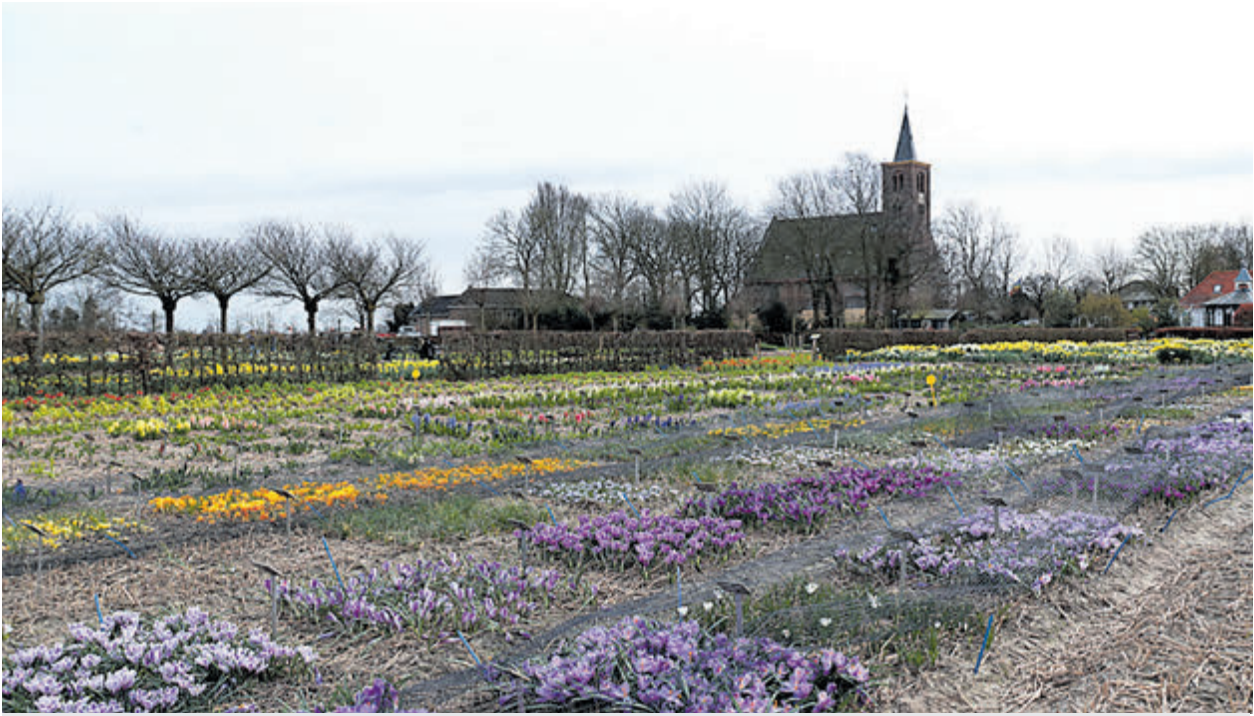
De Hortus Bulborum bevindt zich naast de protestantse kerk in Limmen.