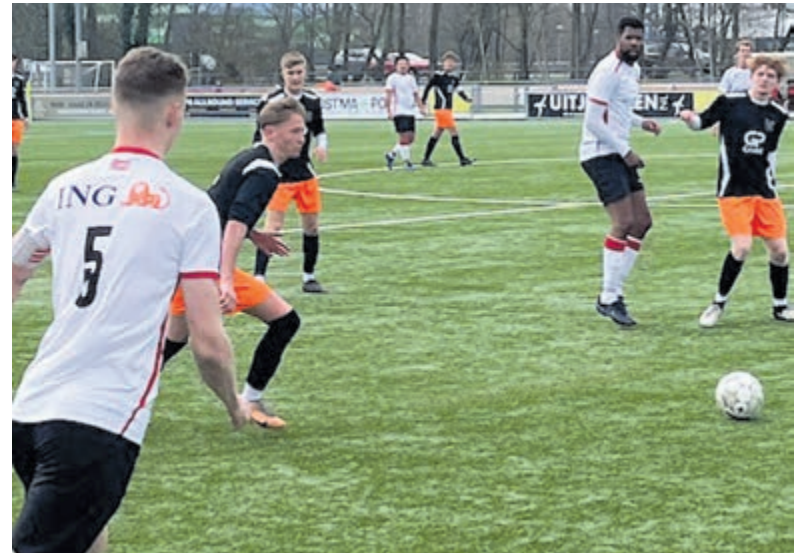
Limmen domineerde de wedstrijd tegen Alcmaria Victrix.