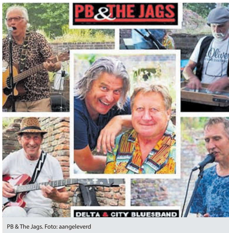
PB & The Jags.

straat 1 in Alkmaar. Het betreft werken van onder meer Moszkowski, Mozart, Händel en Bortkiewicz. Het programma begint om 14.00 uur (inloop 13.30 uur) en de toegang is gratis. Een vrijwillige bijdrage na afloop is welkom.