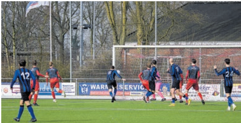
Verder dan een kopbal op de paal en een schot op de lat kwam Vitesse '22 zondagmiddag niet.

zonen zich stuk op de solide verdediging. Pas ver in blessuretijd scoorde Stormvogels destijds, maar toen was het al te laat. Zaterdagmiddag hield FCC een kwartier stand voordat Stormvogels een keer schakelde. Toegegeven, de vijf doelpunten waren van een redelijk niveau maar konden niet op tegen de oerknal van Tjidde Geerts. Met één van zijn befaamde rushes vloog de boomlange speler richting het strafschopgebied. Opeens drukte hij af en kon FC Castricum in ieder geval de tegengoal laten noteren en hier moesten ze het mee doen.