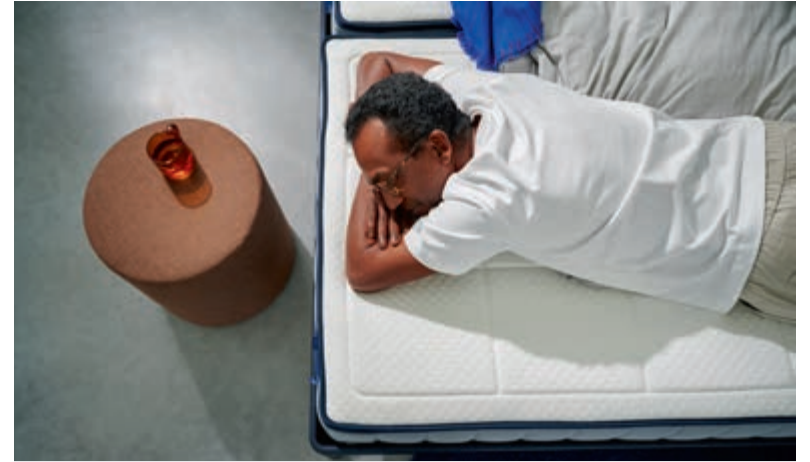
De slaapadviseurs van Slaapkenner Lute nemen de tijd voor persoonlijk matrasadvies.

ontstaansgeschiedenis en kruisbestuivingen. Zo blijken bekende popliedjes hun wortels te hebben in Napels! De spreektaal is Nederlands en alle deelnemers krijgen een boekje met de liedteksten in het Napolitaans, Italiaans en Nederlands. De lezingen zijn van 19.30 tot 21.30 uur met een pauze en de kosten voor deelname bedragen 25 euro. Inschrijven kan door een bericht naar informazioni@ladolcelingua.nl te sturen.