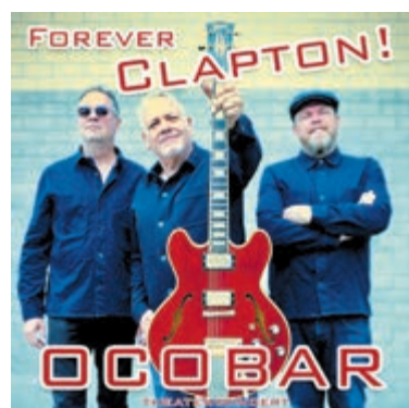
De band Ocozar.