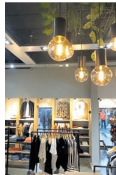
De winkel onderging tijdens de lockdown een complete metamorfose.

graag duidelijk maken dat we blij zijn met ieder bezoek aan de winkel, ook al koop je niets. Daarom is de kopregel van dit stuk niet 'kom nu shoppen' maar 'kom binnenkijken' in onze vernieuwde winkel! Wees welkom als nooit tevoren en stap alsjeblieft over het verplichtingsgevoel heen! Op weg naar een vrijer gevoel!" Een afspraak maken kan door te bellen naar 0251 659933 of door het te vragen bij de deur als je langsloopt. Voor een afspraak bij ZinQ, de andere winkel van dezelfde eigenaren, kan gebeld worden naar 0251 671915. Kijk ook eens op www.blueworld.nl of www.zinqmode.nl voor inspiratie of om direct te bestellen. In de winkels blijven uiteraard de RIVM-voorschriften van toepassing, dus anderhalve meter afstand en het dragen van een mondkapje is verplicht.