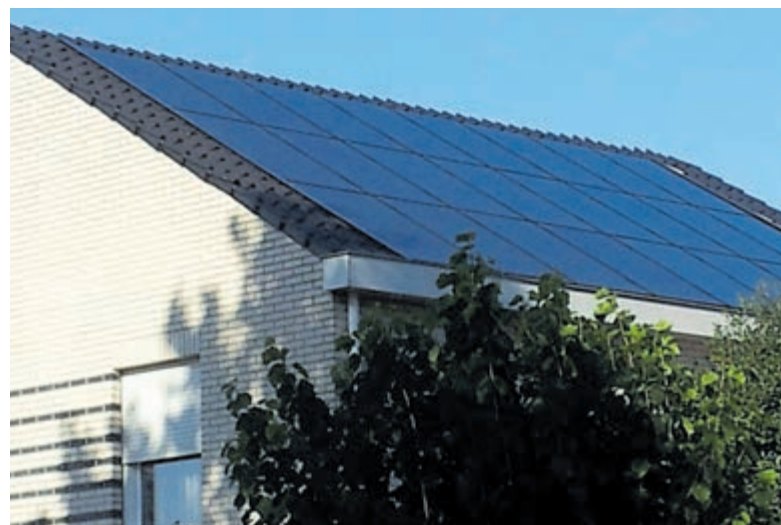
Geleidelijk zie je steeds meer zonnepanelen op de daken.

Castricum - De actie van de gemeente en het Duurzaam Bouwloket zorgt opnieuw voor een run op zonnepanelen. In februari hebben alle huiseigenaren in Castricum een uitnodiging ontvangen om mee te doen met deze lokale zonnepanelenactie. Tot nu toe hebben zeker 350 inwoners zich aangemeld om eens geheel vrijblijvend de woning te laten bekijken door een adviseur.