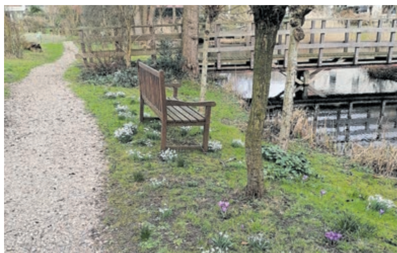
Een fraai kleurenspeel in de Tuin van Kapitein Rommel.

vanaf 8 jaar doen mee aan een escapecourt rondom de baan (maximaal 32 deelnemers). Jongens en meisjes van 12 jaar gaan spelen met tegenslagen en Kubb (maximaal 16 deelnemers). Via www.noordhollandactief.nl kunnen de kinderen zich aanmelden voor deelname. Het evenement vindt plaats op tennis-park Berg en Bal aan De Bloemen 69 te Castricum.