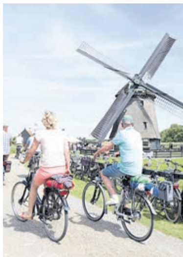
Met de fiets op pad in het paasweekende.

27,50 euro per persoon (inclusief hapjes, drankjes en verrassingen onderweg). Je koopt een ticket voor een starttijd tussen 12.00 en 15.00 uur, elke vijf minuten kunnen twee fietsers starten. Kijk op www.karavaan.nl voor meer informatie of om tickets te reserveren. 'Naar Buiten' is een project van Karavaan in samenwerking met de Schermer Molens Stichting, de Theetuin van Mevrouw CHA, Boerderijwinkel Smit's Boer&Goed, café De Rode Leeuw, korenmolen De Otter en Zwirs Wijngaard.