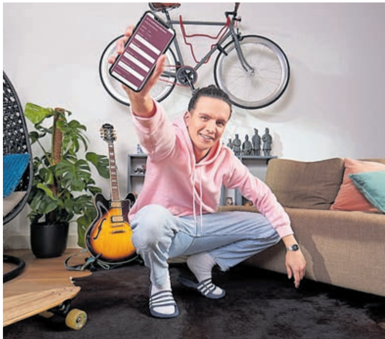
Thuis collecteren met behulp van een speciale app.

Castricum - ReumaNederland kiest dit jaar door corona voor een thuiscollecte, waarbij iedereen gewoon kan collecteren vanaf de bank. Normaal gesproken zouden van 22 tot en met 27 maart ook in Castricum de collectanten weer langs de deuren gaan, maar nu is in die week uw hulp nodig als thuiscollectant! Door te helpen collecteren strijdt u mee tegen de rem van reuma op de levens van meer dan 2 miljoen Nederlanders. Met de Thuiscollecte kunt u met uw mobiele telefoon gemakkelijk collecteren in eigen kring. Bijvoorbeeld onder vrienden, familie, de buurtapp of collega's. Het is een leuke, nieuwe manier, waarbij u precies kunt zien hoeveel u straks hebt opgehaald. Met de opbrengst maakt ReumaNederland levensveranderend onderzoek en baanbrekende oplossingen voor mensen met reuma mogelijk. Kijk op www.thuiscollecte.nl voor meer informatie.