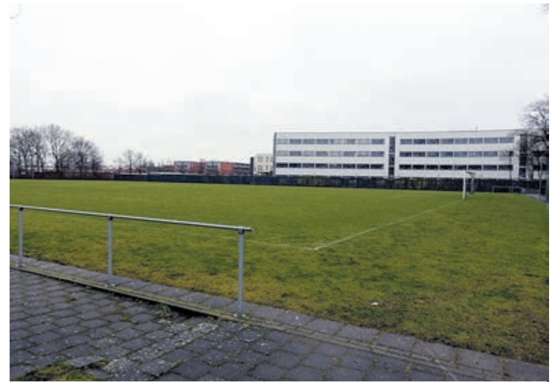
Over twee weken buigt de raad zich opnieuw over de locatie voor het nieuwe zwembad.

Op de site www.join-us.nl is meer informatie over het project te vinden.