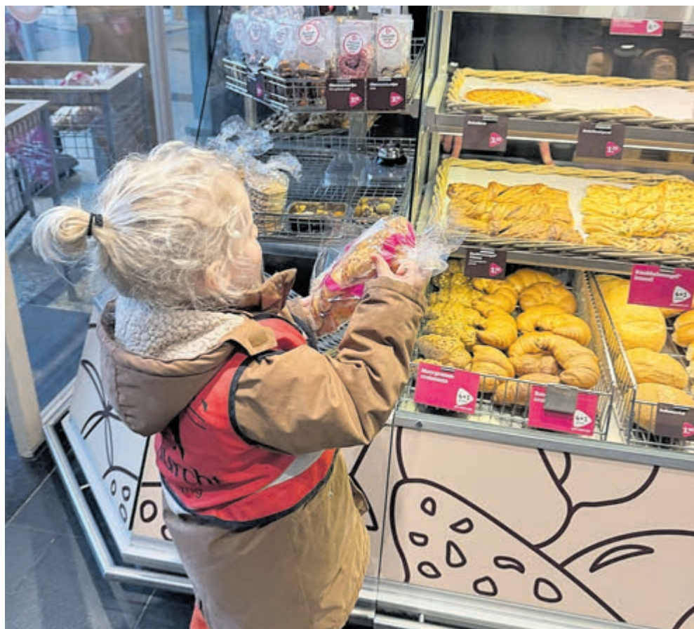
Een kijkje in een echte bakkerswinkel.

60 jaar ervaring in kwaliteit en service!