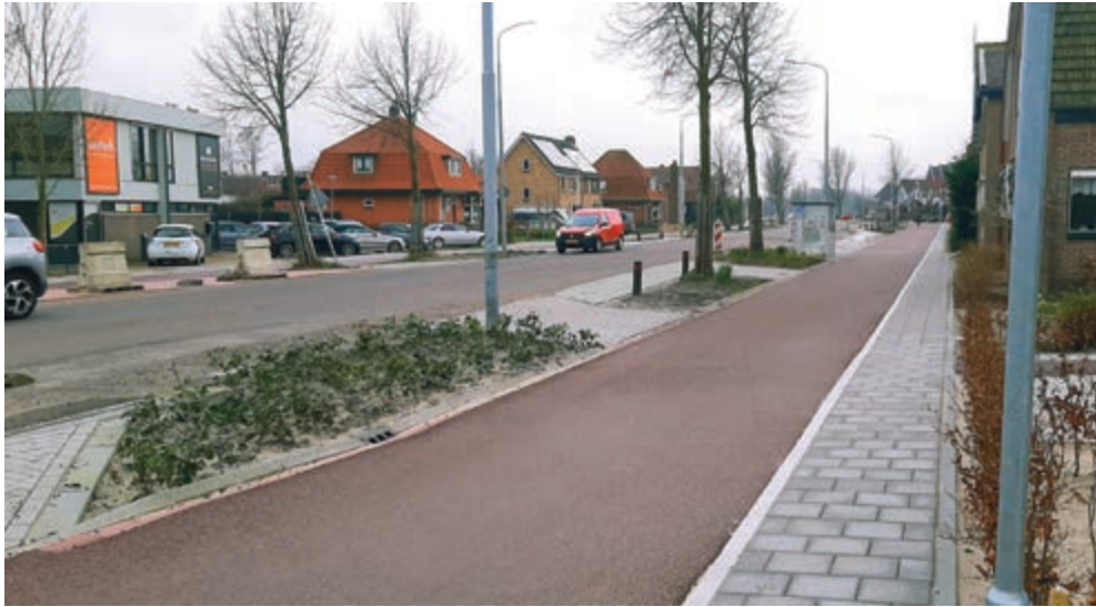
Het werk aan het zuidelijke deel van de Rijksweg is inmiddels zo goed als afgerond.

Werk aan de Rijksweg schuift op naar fase 6