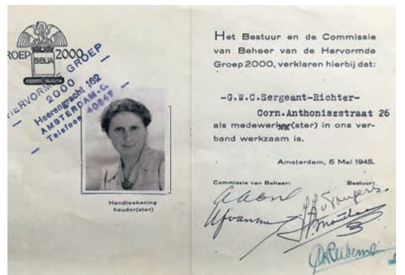
Lidmaatschapskaart Groep 2000.