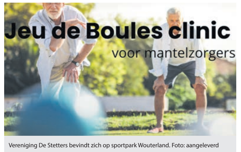
Vereniging De Stetters bevindt zich op sportpark Wouterland.

Aanmelden kan via www.mantelz.nl/activiteiten of neem contact op met Pauline Landwehr Johann ( p.landwehr@mantelz.nl / 06 39331563).