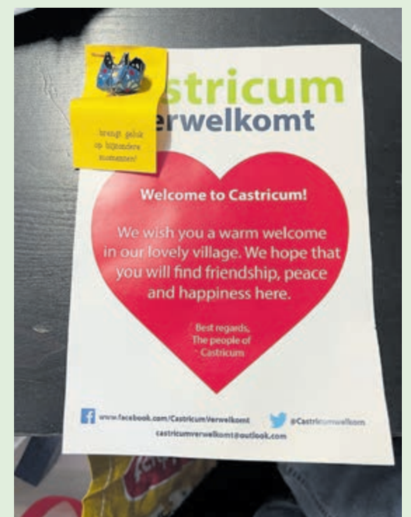
Het pakket van Castricum Verwelkomt heeft Rima altijd bewaard.

Protesten tegen het corrupte regime van Assad in Syrië beginnen rond 2010 met vreedzame demonstraties. De protesten nemen toe nadat meerdere demonstranten gedood zijn en afzetting van het regime wordt geëist. Er ontstaat een oorlog tussen allerlei staten en groeperingen. Miljoenen Syriërs worden gedwongen te vluchten in het land en naar het buitenland. Het oorlogsgeweld neemt toe en velen vluchten via illegale wegen. In 2015 komen enorme aantallen Syrische vluchtelingen de hele wereld over. Het aantal Syrische vluchtelingen ligt rond de 13,5 miljoen volgens de VN. In Nederland wonen ruim 105.000 Syrische vluchtelingen. De meesten van hen kwamen hier in 2015 en 2016. Elk jaar wordt de situatie in Syrië opnieuw beoordeeld. Tot nu toe is Syrië niet veilig genoeg voor vluchtelingen om terug te keren.