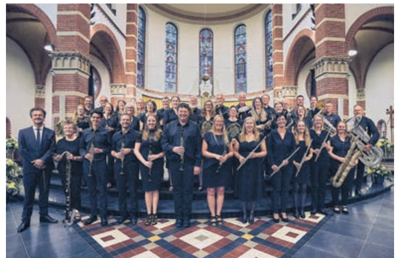
Harmonie Excelsior.

beleeft voordat het een echt jongetje wordt. Aangevuld met gevoelige filmmuziek uit 'Out of Africa' en 'Cinema Paradiso' belooft het een boeiende middag te worden. Het concert begint om 15.00 uur (inloop vanaf 14.30 uur) en de toegang is gratis. Volg de accounts van Excelsior voor berichtgeving over het 100-jarig bestaan, dat in 2024 uitgebreid gevierd zal worden. Ook kan Excelsior nog nieuwe muzikanten gebruiken. Speel je een blaasinstrument of slagwerk, kom dan eens luisteren bij een repetitie op dinsdagavond van 19.45 tot 22.15 uur of meld je aan door een bericht naar bestuur@excelsiorlimmen.nl te sturen.