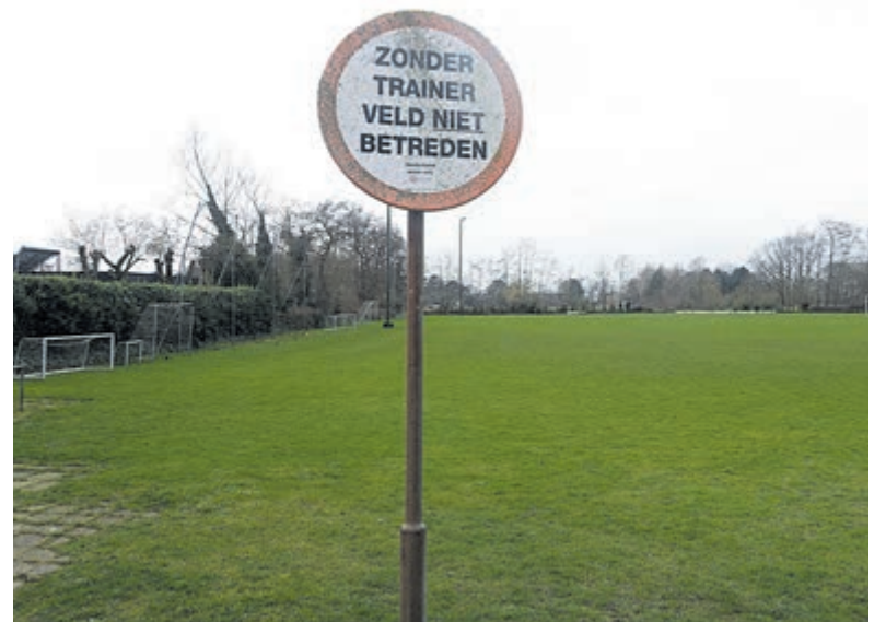
Het trainingsveld aan de Hogeweg dat moet wijken voor herontwikkeling.

Tot slot is volgens het college de bouw van een nieuwe sporthal bij het sportcomplex Damppegheest van vv Limmen een optie, waar de voorzitter van de voetbalclub ook enthousiast op reageerde: „Met een nieuwe hal kan de gemeente de sportbehoefte van onder andere de scholen blijven waarborgen. Als voetbalvereniging zien we die voor-