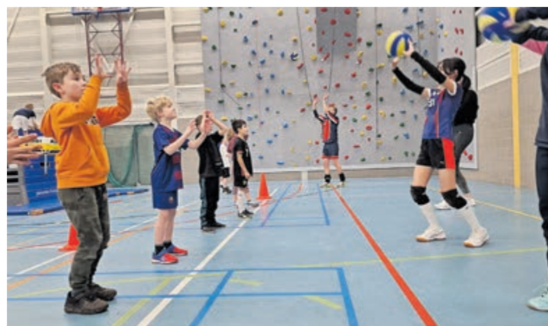
De 'VolleyHoe?'-oefening laat de jeugd van Castricum kennismaken met de eerste volleybaltechnieken.

Castricum - Ruim tachtig basisschoolleerlingen namen op 20 februari deel aan een sportief evenement in het teken van de Olympische Spelen. Ze konden er deelnemen aan handbal, basketbal, korfbal, hockey en volleybal. Voor laatstgenoemde sport zorgden de jeugdleden van Croonenburg. In de feestelijk aangeklede zaal hingen slingers en ballonnen klaar bij vier onderdelen waar de kinderen in roulatie razendsnel kennis maakten met leuke varianten van volleybal.