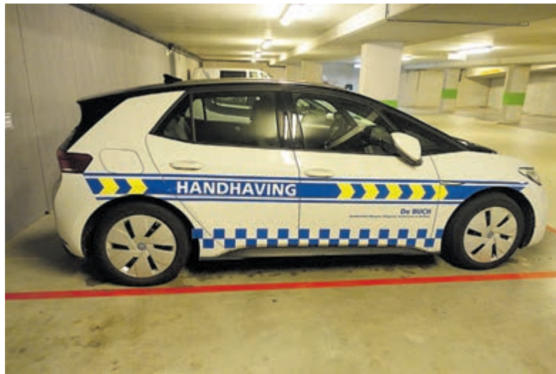
Een voertuig van het gemeentelijk handhavingsteam.

Castricum - De buitengewoon opsporingsambtenaren (boa's) in de gemeente Castricum worden vanaf 1 maart uitgerust met handboeien. De maatregel volgt op het uitbreiden van de bevoegdheden van de boa's begin dit jaar.