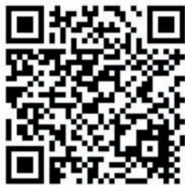
De QR-code voor het bestellen van de paasstol.

Fleur is geen type om tot november te wachten met andere acties. Daarom bedacht ze de paasstolactie. Hiermee wil ze ruim voor november al een flink bedrag voor KiKa bij elkaar zien te krijgen. „De meeste mensen eten graag een plakje paasstol of een extra chocolaatje met Pasen. En dat smaakt extra lekker als je weet dat je hiermee ook een belangrijk doel steunt: het streven naar honderd procent genezing van kinderen met kanker. Iemand die vóór 13 maart een KiKa-paasstol of de KiKa-chocolade bestelt kan er op rekenen dat ik deze persoonlijk in de week voor Pasen gratis bij hem of haar thuis kom bezorgen. Men hoeft alleen maar de QR-code te scannen en tien euro over te maken. De helft van dit bedrag gaat naar KiKa, de andere helft gaat op aan het produceren van de paasstollen. Mensen kunnen ook een e-mail sturen (fleurlooptvoorkika@hotmail.com) wanneer ze de QR-code niet kunnen scannen, dan help ik ze om zo'n heerlijke stol te krijgen.”