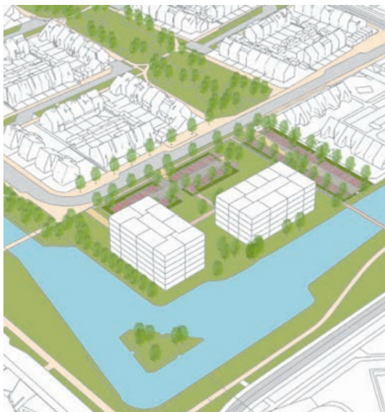
Het conceptplan dat de voorkeur heeft van het college.

Castricum - Sinds de laatste inloopavond voor de herontwikkeling van de voormalige locatie van de Montessorischool aan Koekoeksbloem 55 is er volgens het buurtcomité bitter weinig gebeurd, behoudens het voorstel van het college om het gebouw tijdelijk te bestemmen voor de huisvesting van statushouders. Het comité dringt in een brief aan de gemeenteraad aan op een nieuw ontwerp voor woningbouw op deze plek.