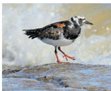
Steenloper op het wad.

onderscheiden vanuit de BBC Wildlife Photographer of the Year. De lezing begint om 14.00 uur (inloop vanaf 13.30 uur) en is voor leden van VWG Midden-Kennemerland gratis toegankelijk. Overige geïnteresseerden betalen 3 euro. Koffie, thee en dergelijke zijn verkrijgbaar, maar uitsluitend met pin te betalen.