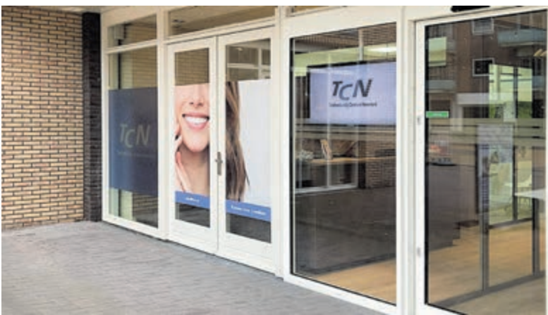
De praktijk van TCN aan het Bakkerspleintje 79.