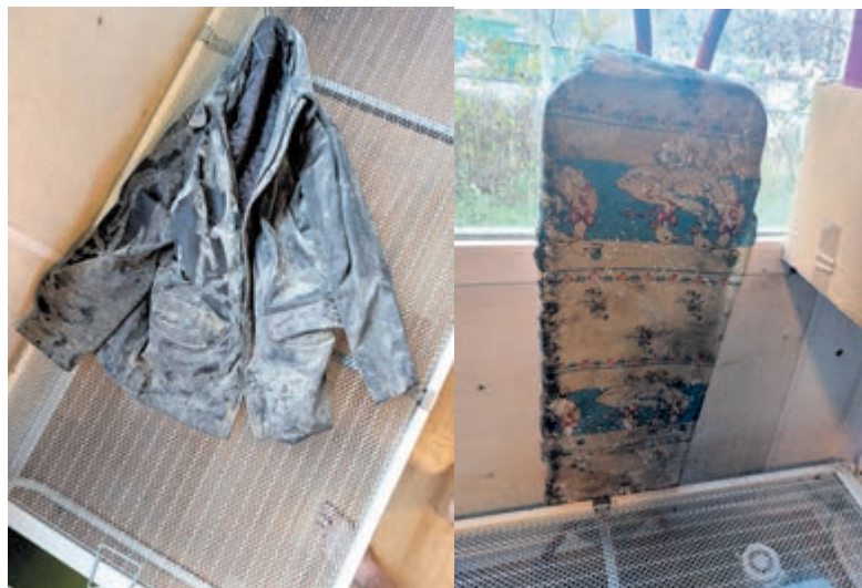
Schimmel in kledingstukken en op de strijkplank.

Waarom dit? Waarom zo? Waarom behandelen jullie ons zo slecht?”, vraagt Yusuf zich vertwijfeld af.