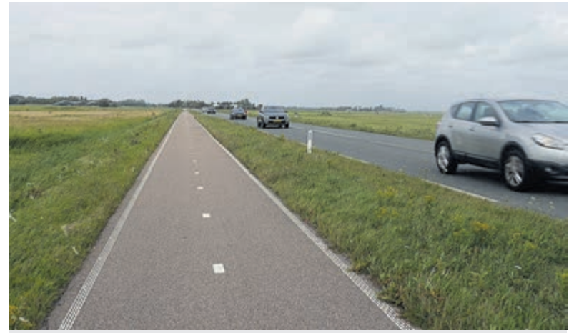
De 'dodenweg', goed voor 22.000 motorvoertuigen per etmaal.