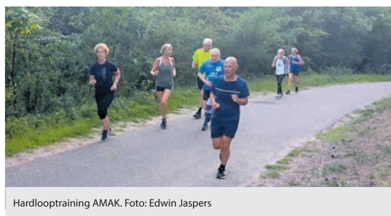
Hardlooptraining AMAK.