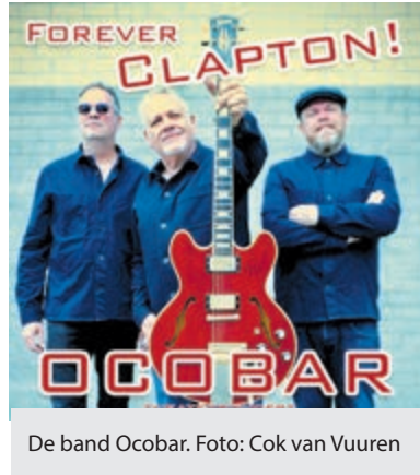
De band Ocoabar.