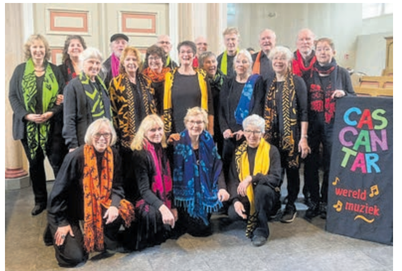
Het wereldkoor Cascantar uit Castricum.

kan echt overal! Wil jij ook overal waar je salsamuziek tegenkomt een leuk dansje ter plekke kunnen doen? Aanmelden zonder partner is ook mogelijk. Wisselen van partner tijdens de les is niet verplicht, wel is het leuk en leerzaam! Ben jij klaar voor de salsadansverslaving?! Meld je aan door de QR code te scannen, via de social media-accounts of stuur een e-mail naar infosalsasiempre@gmail.com voor meer informatie.