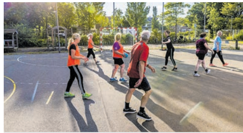
Een eerdere editie van het beweegprogramma.

start in week 13. De deelnemers gaan vier weken achter elkaar, twee keer per week verschillende sporten uitproberen bij sportaanbieders uit de buurt. Alle activiteiten worden begeleid door vakkundige trainers