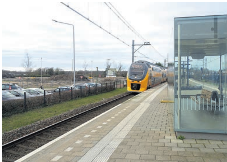
Stopt er straks ook een nachttrein in Castricum?

In de motie wordt onder andere geconstateerd dat een nachttrein de inwoners van Castricum de kans biedt om in Amsterdam of Alkmaar een late voorstelling of een lang concert te bezoeken. Ook maakt deze voorziening het voor jongeren mogelijk om op een veilige manier uit beide steden naar huis te komen en kan het verblijf in horecagelegenheden in Castricum aantrekkelijker worden gemaakt. Daarnaast wordt Schiphol beter bereikbaar voor nacht- en hele vroege vluchten. Tauber licht vervolgens de verzoeken aan het college toe: „Wij vragen onze interesse kenbaar te maken bij het college van Alkmaar om bij de proef aan te sluiten en te onderzoeken of het mogelijk is de trein ook in Castricum te laten stoppen indien de proef tot stand komt. Tot slot is ons verzoek om aan de raad terug te koppelen wat hiervoor de consequenties en voorwaarden voor de gemeente Castricum zijn, inclusief de te treffen maatregelen om de veiligheid te waarborgen.”