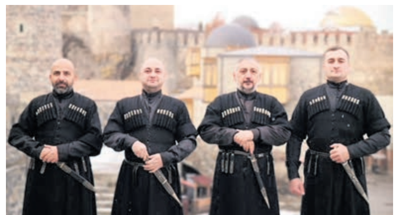
De groep Dzmano uit Georgië.