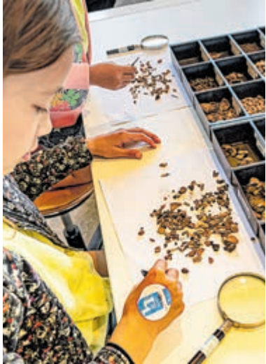
In de ArcheoHotspot kruipt je zelf in de huid van een archeoloog.

Castricum - Archeologiemuseum Huis van Hilde is sowieso al een bezoekje waard met wel duizend archeologische schatten en de reconstructies van vroegere bewoners van onze provincie, maar in de voorjaarsvakantie is er extra veel te doen in het museum, met speciale aandacht voor kleding. Waarvan maakten de mensfiguren in Huis van Hilde vroeger hun kleding en wat kunnen we daarvan leren om nu