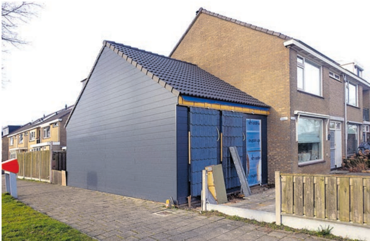
Ook aanbouwen tellen mee bij het bepalen van de taxatiewaarde.