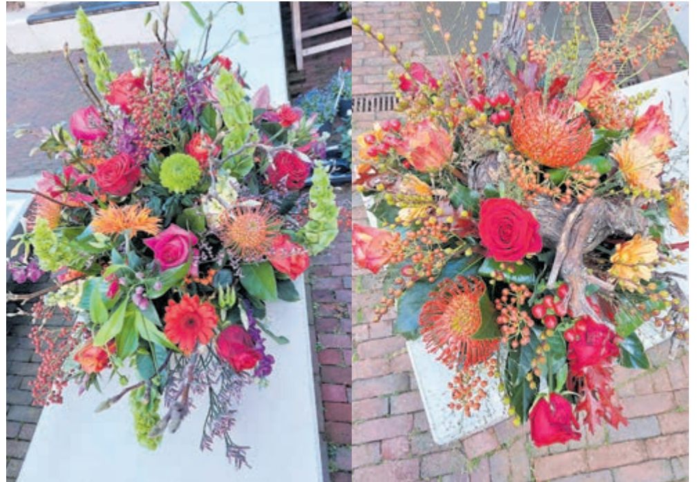
De wensen van de klant worden verwerkt tot een fraai eindresultaat.