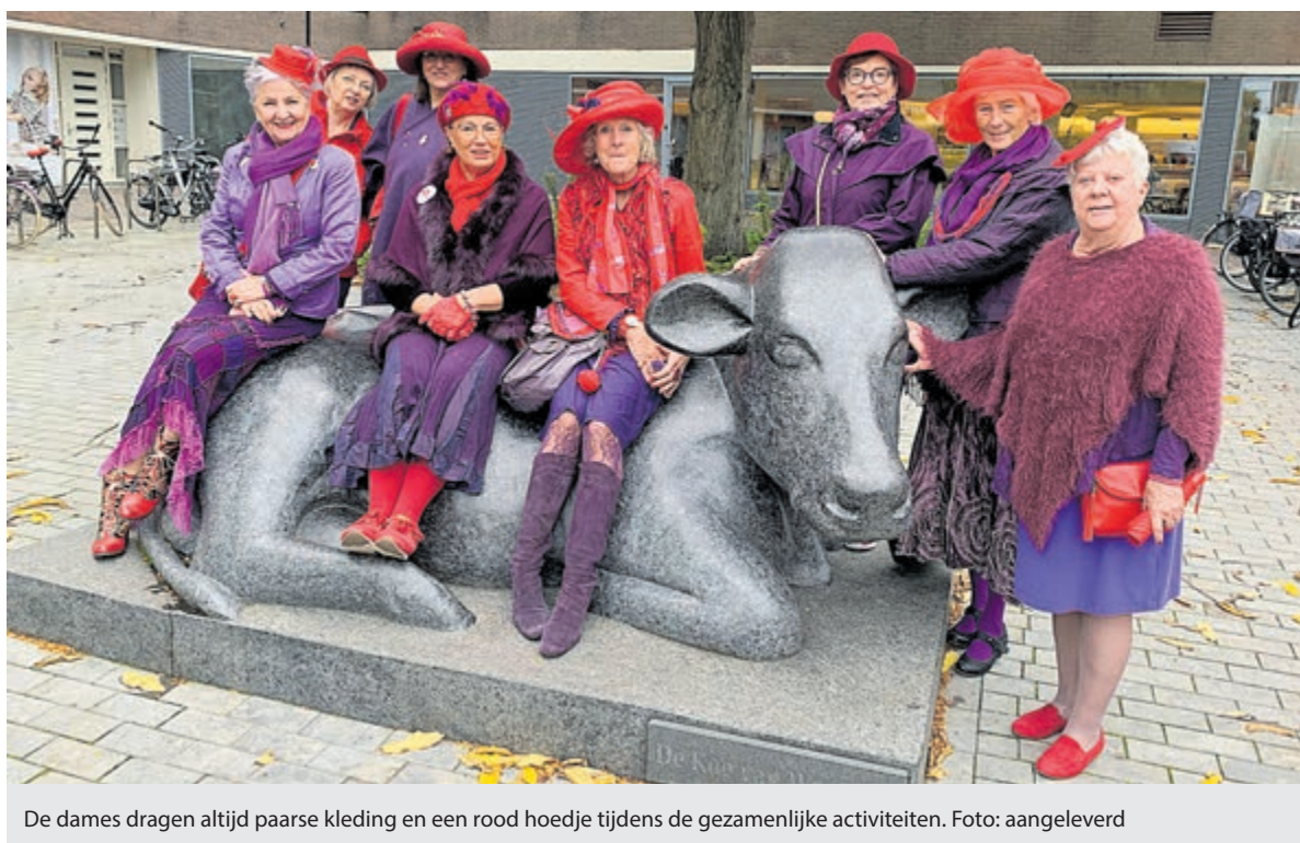
De dames dragen altijd paarse kleding en een rood hoedje tijdens de gezamenlijke activiteiten.

Oud brood wordt door de plaatselijke bakker gesponsord en ook voor de benodigde wortelen is een gulle gever. Een groep vrijwilligers beheert en onderhoudt het terrein. De medewerkers van de groenvoorziening verzorgen het openbaar groen om het hertenkamp heen. De samenwerking met de gemeente verloopt goed en gemaakte kosten voor onderhoud kunnen worden gedeclareerd. Wat betreft het uitsterfbeleid zegt Piet Veldt; „Dit is waanzin, de regels schieten hun doel voorbij!”