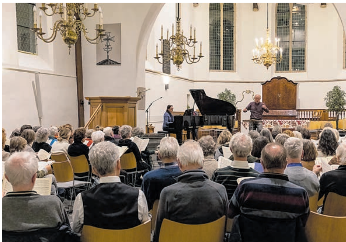
Repetitie COV in de dorpskerk.