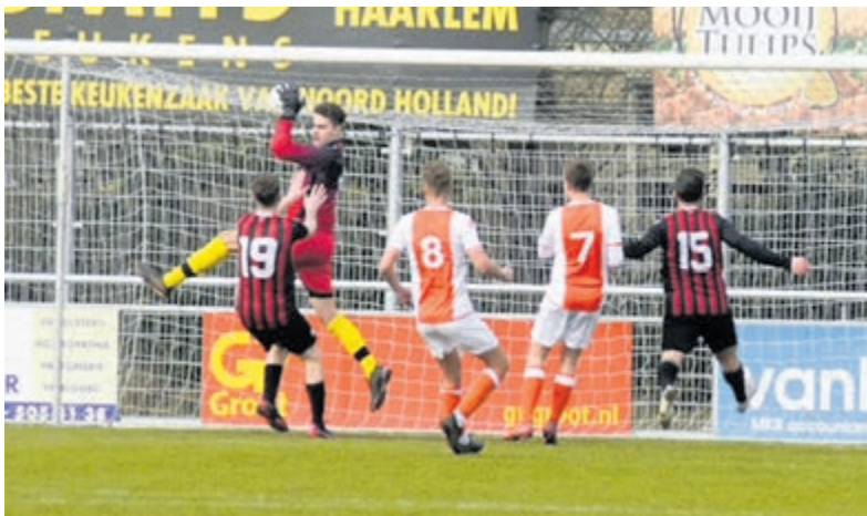
Keeper Glorie plukt een voorzet uit de lucht.

Limmen - Het bekerduel tussen Limmen en Zwaluwen '30 pakte niet positief uit voor de thuisploeg. Het duel, dat zaterdagmiddag werd gespeeld, eindigde in 0-2 en daarmee is voor Limmen het bekeravontuur voorbij. Limmen trad aan met een heel ander team dan een week eerder. Oorzaak: schorsingen en ziek en zeer.