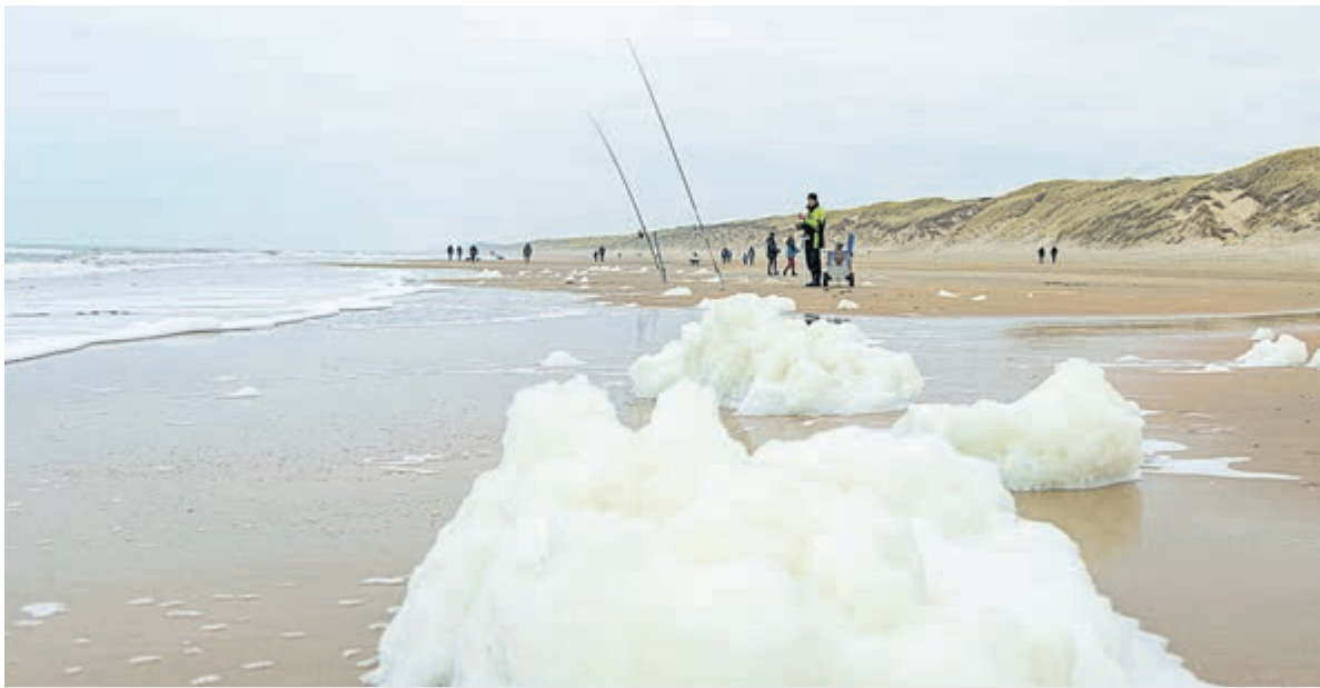
Strandvissen is niet alleen een sport, maar ook een manier om één te zijn met de natuurelementen. Tekst en foto: Henk de Reus