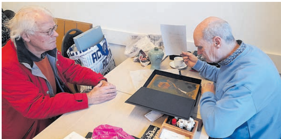
Cees uit Alkmaar kocht zijn kunstwerk in een kringloopwinkel. Hij vermoedt dat het een werk van Vincent van Gogh is.

Castricum - Onlangs kwam een team van Heritage Auctions Europe naar dorps huis De Kern om geheel kosteloos de munten, postzegels, schilderijen, antiek en curiosa van bezoekers te taxeren. Wie dat wilde, kon objecten van waarde direct laten inschrijven voor een veiling. Ook onze verslaggever wachtte zijn beurt af om vier kleine schilderijtjes te laten taxeren. Intussen sprak hij met taxateurs en bezoekers.