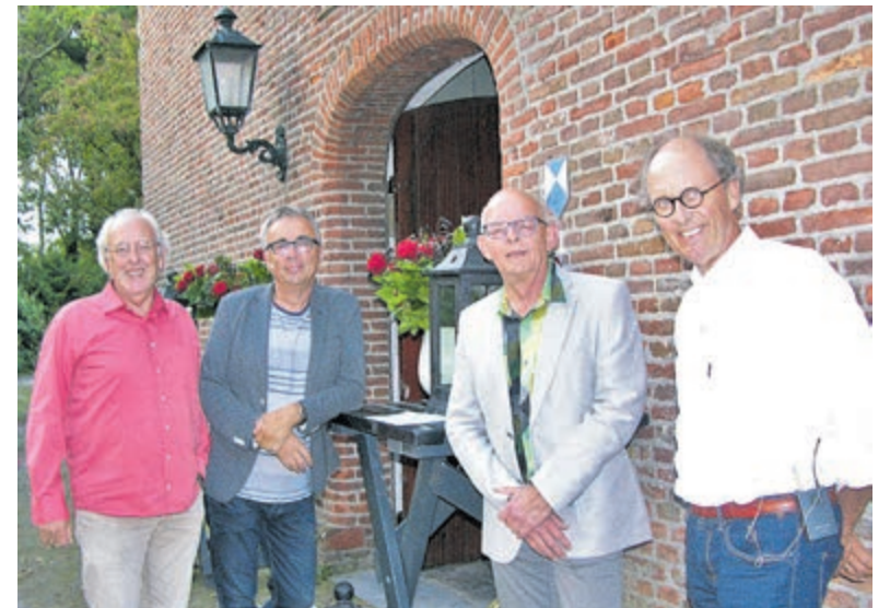
Achterom brengt een nostalgisch en poëtisch repertoire.

straat 113. De kerk is open vanaf 19.15 uur. Toegangsprijs € 32,50 (jeugd t/m 23 jaar € 10,-) inclusief programmaboekje en een consumptie. Kaarten zijn verkrijgbaar via de QR-code op www.oratorium-castricum.nl . Op 2 en 9 maart zijn van 19.30 tot 20.00 uur tevens kaarten verkrijgbaar voorafgaand aan de repetitie in de dorpskerk, als ook op de avond van het concert vanaf 19.15 uur aan de deur van de St.-Pancratiuskerk.