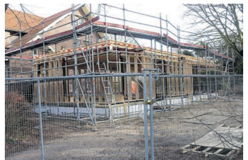
De aanbouw aan de oostzijde, waarin ook een appartement wordt gerealiseerd.