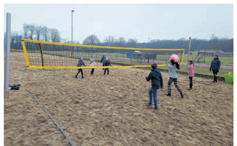
De jeugd U12 van Croonenburg volleybalt al vanaf januari op het zand van 2beach.

De trainingen starten op woensdag 3 maart van 18.00 tot 19.00 uur. Ben je ook weer aan buitensport toe? Mail naar jeugdcommissie@croonenburg.nl voor informatie.