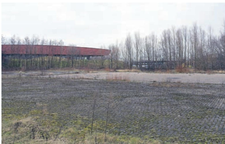
Het terrein aan de Puikman met uitzicht op Huis van Hilde en het station.

de afgelopen maanden zowel ambtelijk als bestuurlijk overleg is gevoerd met diverse betrokken partijen over het tijdelijk huren van een deel van het terrein om tot exploitatie van de flexwoningen te komen. De komende maanden wordt er met elkaar gesproken om de voorwaarden vast te stellen waaronder de samenwerking mogelijk kan plaatsvinden. Projectontwikkelaar BMB werkt momenteel aan een definitief plan voor woningbouw op deze locatie, waarin dertig procent sociale koop of huur wordt opgenomen. Er wordt van uitgegaan dat het flexwo-