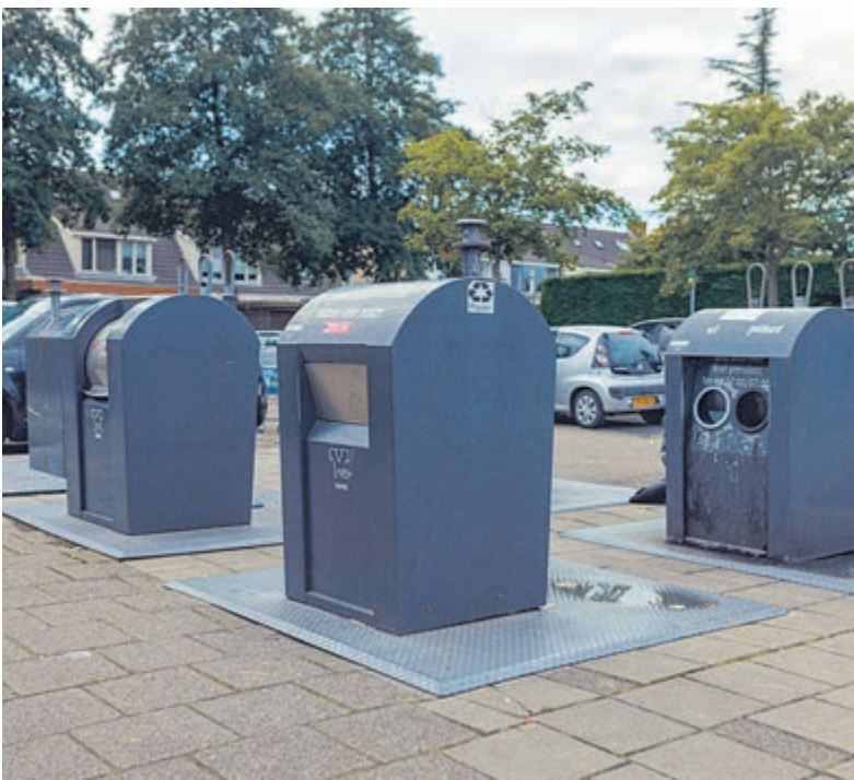
Door afval beter te scheiden, moet de hoeveelheid restafval afnemen.

De vier willen dat er een vangnet komt voor al die ondernemers en hun gezinnen die met al hun energie een zaak hebben opgebouwd en die nu met grote stress in hun dagelijks leven te maken hebben. Nationale en lokale overheid moeten hun verantwoordelijkheid nemen en gezamenlijk optrekken om werkende Nederlanders uit het lokale MKB toekomstperspectief te bieden in coronatijd.