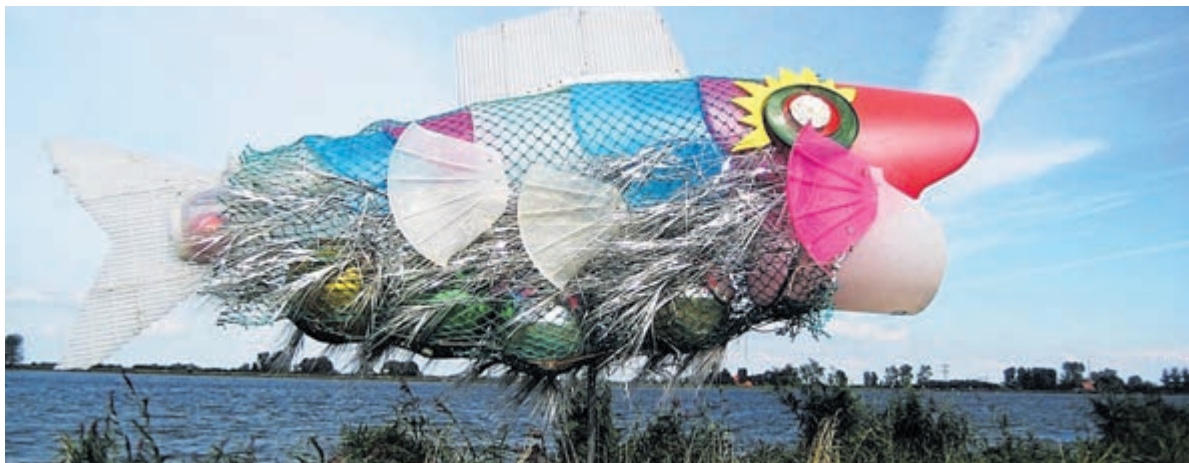
Vis op het droge.

Klimaatalarm Castricum is een samenwerking van burgers en organisaties als Transitie Castricum, Ploeging Castricum en XR Castricum. Ze organiseren samen de lokale activiteiten ter gelegenheid van het landelijke Klimaatalarm op 14 maart, een initiatief van de Klimaatcrisis Coalitie: Milieudefensie, FNV, Greenpeace, DeGoedeZaak, Extinction Rebellion, Code Rood, Fridays For Future, Fossielvrij NL, Oxfam Novib, De Woonbond en Grootouders voor het Klimaat. Klimaatdichters.org is een snel groeiende beweging van Vlaamse en Nederlandse woordkunstenaars. Ze strijden met poëzie in al haar verschijningsvormen voor een klimaatvriendelijke wereld.