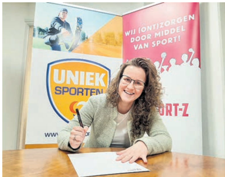
Madelaine wil kennisdeling en nieuwe samenwerkingsverbanden tussen maatschappelijke organisaties stimuleren.

Sinds 2014 is hij bestuurslid van de Stichting Castricum Monument. Hij coördineert daarbij het onderhoud. Bovendien is hij medeorganisator van het beklimmen van de kerktoeren en de Candlelight Shopping in de Castricumse winkels