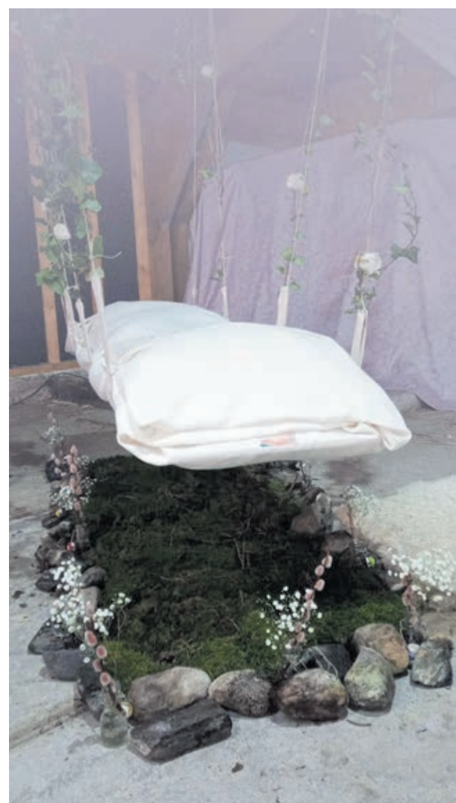
Diverse opstellingen, elk met een geheel eigen sfeer.

Wees welkom om bij een kopje koffie/thee vrijblijvend over uw wensen, gedachten en misschien dromen rondom uw laatste reis te komen praten. Charon uitvaartbegeleiding: 072 5070477, www.charonuitvaartbegeleiding.nl . Natuurbegraafplaats Geestmerloo is dagelijks geopend van 09.00 tot 17.00 uur.