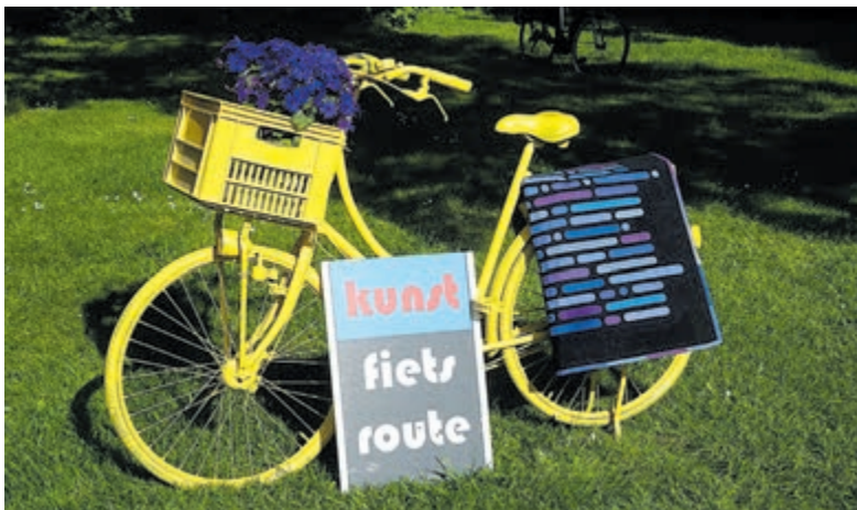
De kunstfietsroute gaat ook dit jaar niet door.

Castricum - Vorig jaar hoopten de deelnemers aan de Kunstfietsroute het dertigjarig jubileum te vieren. Het coronavirus gooide echter roet in het eten en ook dit jaar is dat weer het geval. Er zijn veel onzekerheden over wat in juni mag en niet ieder atelier zal coronaproof zijn volgens de dan geldende regels. Volgend jaar zullen de meeste mensen ingeënt zijn, dat biedt volgens de organisatie een beter perspectief voor het alsnog uitbundig vieren van het jubileum. Op www.kunstfietsroutecastricum.nl kan iedereen alvast een indruk krijgen van de deelnemers.