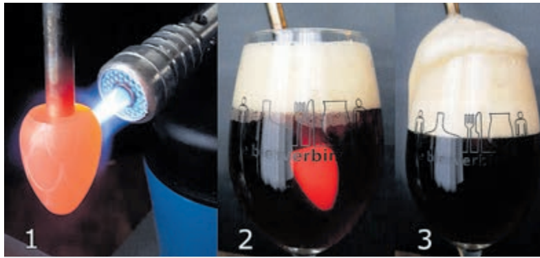
De drie fasen van het stacheln.