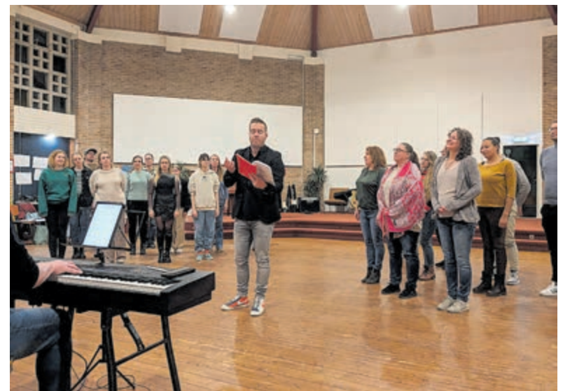
Een repetitie van musicalgroep The Cast.

De eerste repetitie is op zaterdag 17 februari. Deelname is gratis en je krijgt de muziek op de eerste repetitie aangereikt. Opgeven via jellejan@jkklinkert.nl is niet verplicht maar wel prettig.