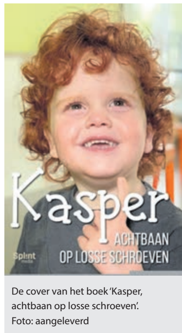
De cover van het boek 'Kasper, achtbaan op losse schroeven'.

Steunt u de actie van Jeroen voor onderzoek en behandelmethoden voor kinderen met kanker? Kom dan op 3 maart 's middags naar het Horecaplein of doneer een bijdrage en ga naar de site https://www.maximaal-inactie.nl/fundraisers/sponsorloper . Wie geeft Jeroen het laatste zetje naar het miljoen?