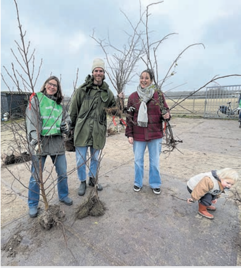
Vorig jaar was er veel animo voor de gratis bomen en struiken.

Castricum - Enthousiaste vrijwilligers delen op 24 februari gratis jonge bomen en struiken uit bij de MeerBomenNU bomenhub aan de Duinenboschweg in Castricum. Er zijn duizenden zaailingen op te halen. „De boompjes en struiken zijn inheems en goed voor de biodiversiteit.“