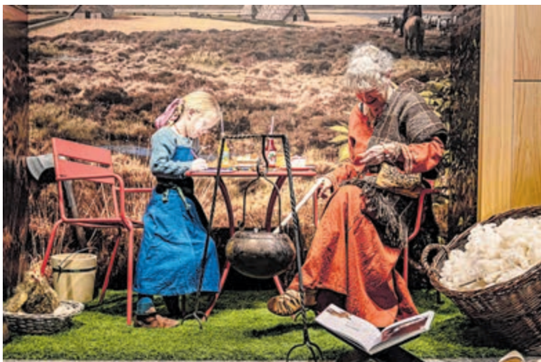
Huis van Hilde en Springlevend Verleden laten zien hoe men duizend jaar geleden de maaltijden bereidde.

Castricum - Hildes Heerlykhyd, het museumcafé van archeologiemuseum Huis van Hilde, heropent haar deuren in de voorjaarsvakantie met een nieuwe menukaart. Duurzaamheid, eerlijke producten, lokale leveranciers en social return staan centraal in dit nieuwe concept. Maak in de voorjaarsvakantie kennis met ‘het menu van de toekomst’ maar kom ook proeven van het ‘menu van vroeger’!