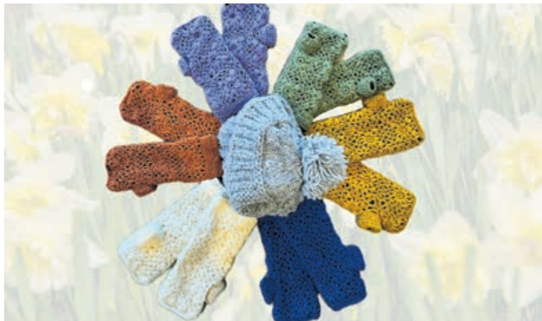
Handwarmers in vele kleuren bij Wereldwinkel Castricum.

het bier en krijgt het koolzuur een 'hitteschok' van de 600 graden hete staaf, waardoor er een deel van uit het bier ontsnapt. Hierdoor ontstaat er een smaakverandering én krijgt het bier een zachter mondgevoel! Vooral wat zoetere donkere bieren als een Dubbel, Bockbier of Quadrupel lenen zich hier goed voor. Naast de smaakbeleving is het ook nog eens een visueel spektakel! Proeflokaal Dampegheest aan de Schoolweg 1 is op zondag 18 februari open van 15.00 tot 20.00 uur.