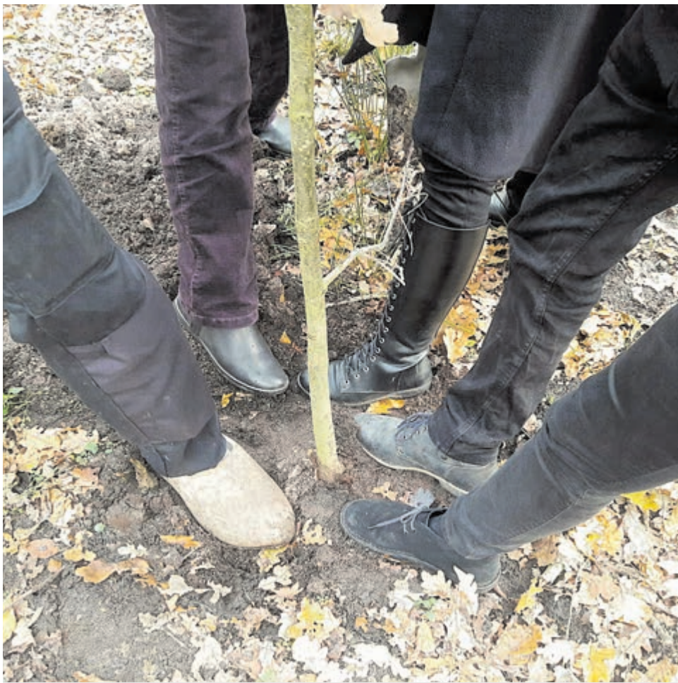
Jake's ouders, broer en zus planten samen een eik voor hem.