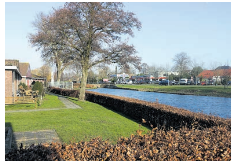
De locatie bij verzorgingshuis Strammerzoom die in aanmerking komt voor herplaatsing van de fontein.

De oplevering van dit appartementencomplex is ook gepland in het najaar, zodat ook de bewoners hiervan straks uitkijken op een fraai herboren Raadhuisplein.