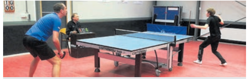
Wout Slokker speelt tegen een tegenstander van Rijsenhout.

Goedlopende aanvallen werden schaars en echte kansen werden er niet of nauwelijks meer gecreëerd. Zo leek het duel te gaan eindigen in een kleine zege voor Vitesse, maar in de blessuretijd moest Tom Laan nog wel gestrekt naar de linkerbenenhoek om puntverlies te voorkomen na een onverwacht schot van de verder onzichtbare LSVV-spits Toine Merk.