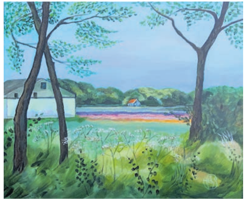
De Zanderij in Castricum, geschilderd door Hetty Spaander-Sonnemans.

Castricum - Op maandag 13 februari gaat weer een stiltewandeling van start. De deelnemers wandelen ongeveer anderhalf uur over een afstand van vijf à zes kilometer door het duingebied. Wie mee wil wandelen, kan om 09.30 uur aansluiten bij de groep op de parkeerplaats bij bezoekerscentrum De Hoep aan de Johannesweg 2 in Bakkum. De wandeling start om 09.45 uur. Deelname is gratis, maar een geldige duinkaart is wel noodzakelijk. Bel 0251 654064 voor nadere inlichtingen.