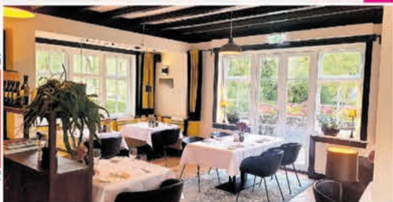
Het restaurant opgedekt met tafellinnen.