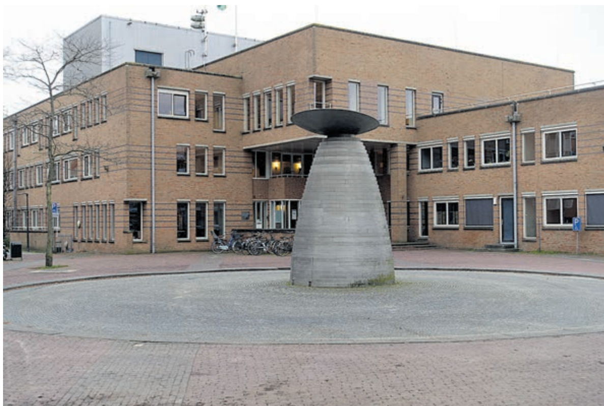
De huidige situatie van het sterk verouderde Raadhuisplein.

Castricum - Het is alweer bijna tweeënhalve jaar geleden dat de gemeenteraad akkoord ging met het vergroenen van het Raadhuisplein, waarvoor een voorlopig ontwerp werd gemaakt. Verwacht wordt dat de werkzaamheden komend najaar starten in aansluiting op de oplevering van het woningbouwproject 'Eerste Kwartier'.