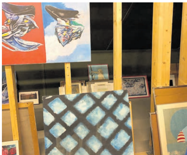
Een deel van de collectie in de 'schatkamer' van Dijk en Duin.

U vindt De Oude Keuken aan de Oude Parklaan 117. Kijk op www.deoudekeuken.net voor meer informatie.