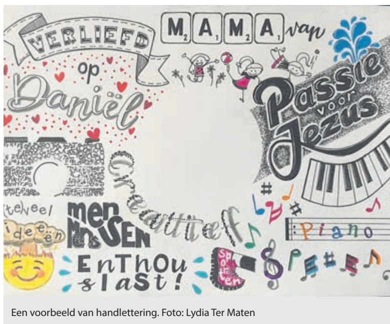
Een voorbeeld van handlettering.

Castricum - Elk jaar belanden 105.000 mensen van 65 jaar of ouder op de spoedeisende hulp, in veel gevallen naar aanleiding van valpartijen. Voor 1,1 miljoen ouderen geldt dat er sprake is van een verhoogd valrisico. In 2020 was 1 miljard euro aan medische zorgkosten te relateren aan valpartijen (bron: veiligheid.nl). Uit deze cijfers blijkt de ernst van het vallen door ouderen. Wynzen Pauzenga van Fruns Pré-Fysiotherapie, praktijk voor preventieve fysiotherapie, vertelt op uitnodiging van Stichting Welzijn Castricum hoe 65-plussers worden geactiveerd door te werken aan hun stabiliteit, waardoor het vallen wordt belemmerd. Maar ook hoe de dagelijkse activiteiten aangepast kunnen worden, zodat het risico om te vallen wordt verkleind. Ook het deelnemen aan danstrainingen is preventief voor met name het vallen en hersendisfunctioneren. Tijdens zijn lezing zal Wynzen alle vragen beantwoorden wat te doen om vallen te voorkomen in de toekomst, zodat u niet één van de velen bent die op de spoedeisende hulp terecht komt. Dit is een lunchlezing op vrijdag 24 februari om 12.00 uur in gebouw De Landbouw aan de Dorpsstraat 30. Deelname kost 5 euro inclusief lunch en deelnemers moeten zich vóór 20 februari aanmelden ( info@welzijncastricum.nl / 0251 656562) onder vermelding van 'Lezing valpreventie'.