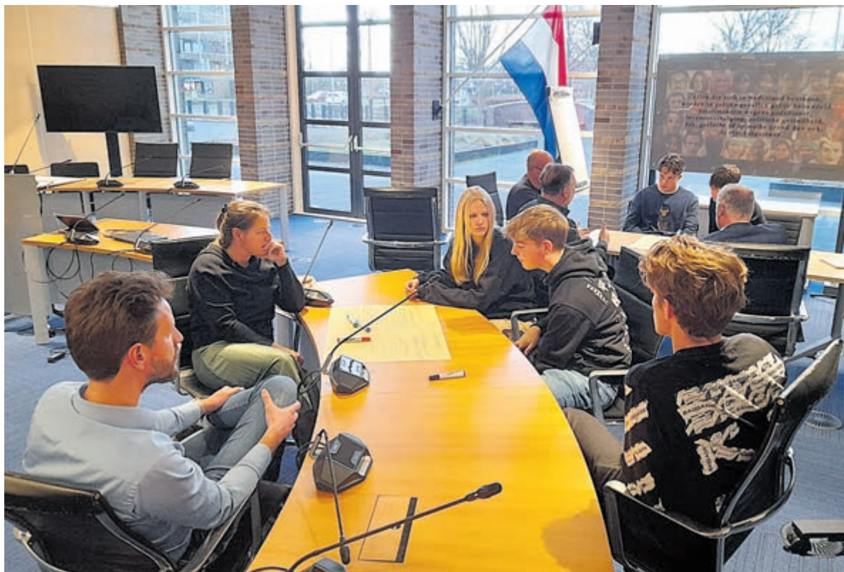
In kleine groepjes werd over de toekomst van de Castricumse dorpskern gediscussieerd.