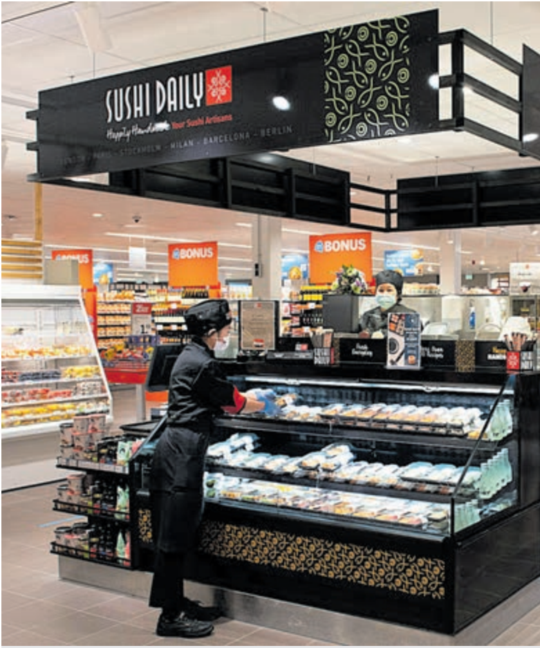
Dagelijks verse sushi, terplekke bereid in de nieuwe sushibar.