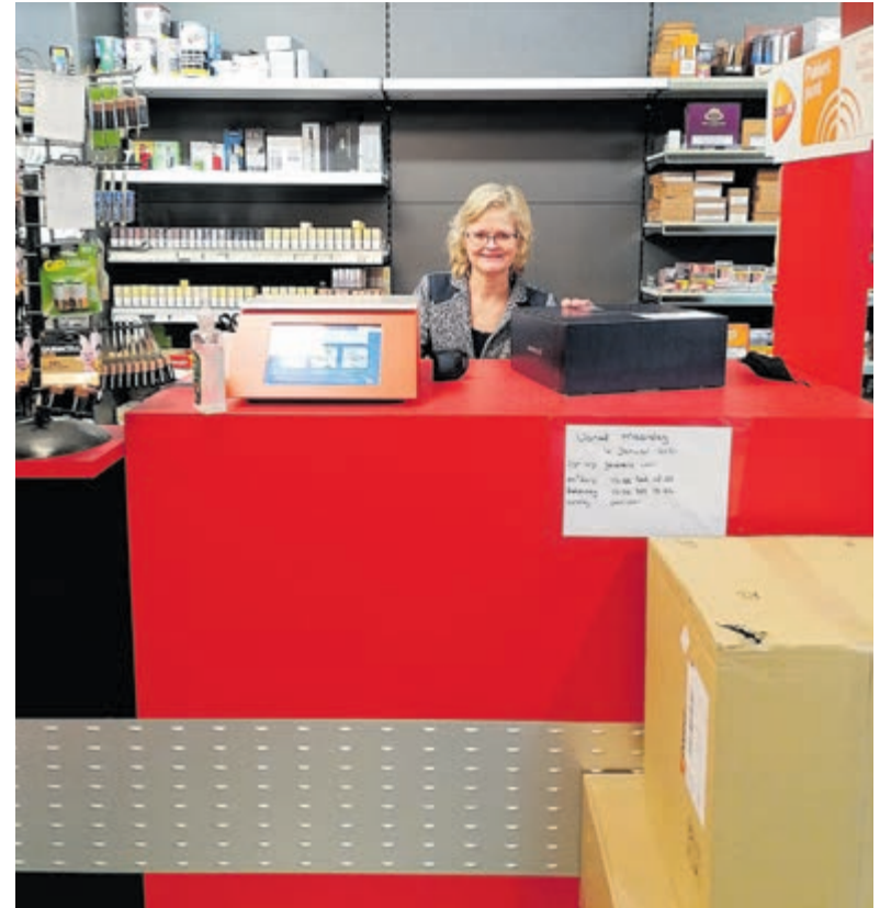
Het postkantoor van PostNL is nu ondergebracht bij Vivant Rozing.

Het college vraagt de raad op 11 maart in te stemmen met de voorkeurslocatie en kennis te nemen van de start van de aanbesteding die leidt tot de keuze van een ontwerpteam en een voorlopig ontwerp van het zwembad.