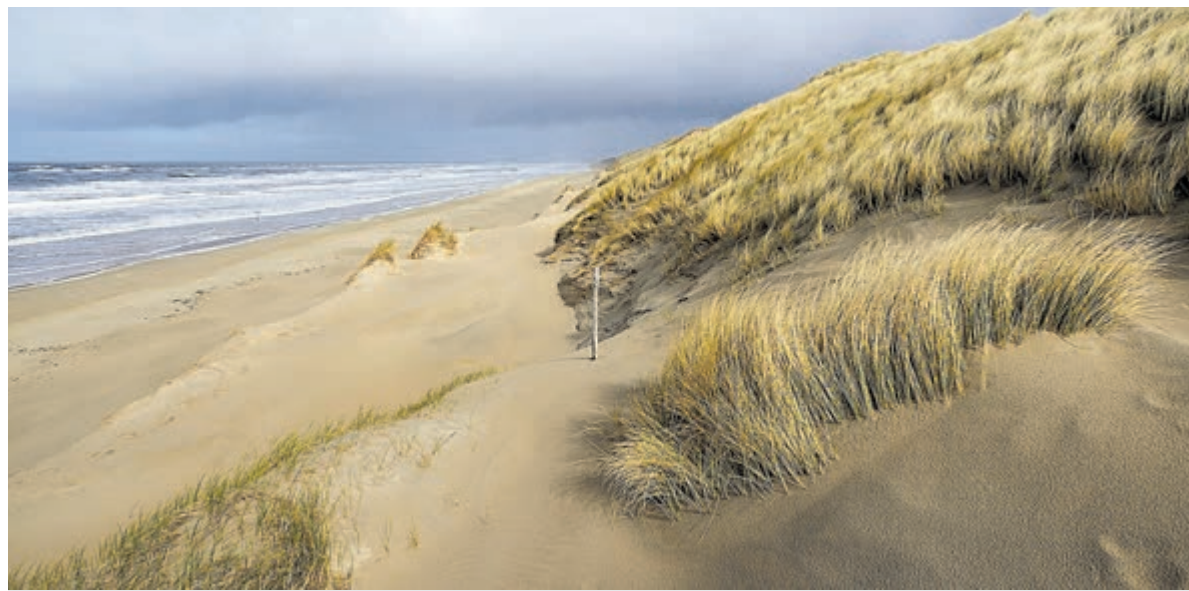
Landschap Noord-Holland wil samen met jongeren het huidige strandbeheer veranderen.

De makelaars van Teer houden uiteraard alle ontwikkelingen nauwkeurig in gaten. Door het grote netwerk in de regio zitten zij letterlijk boven op de woningmarkt zodat zij hun klanten goed kunnen informeren.