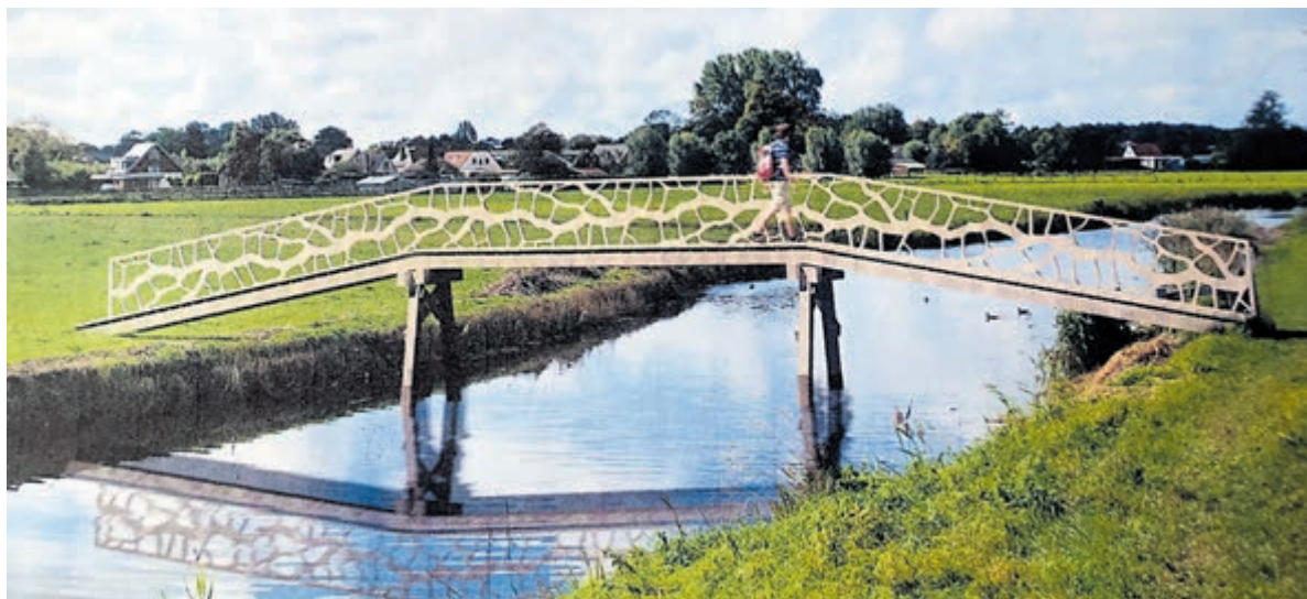
Een artist impression van de brug. Afbeelding: Bureau Vista