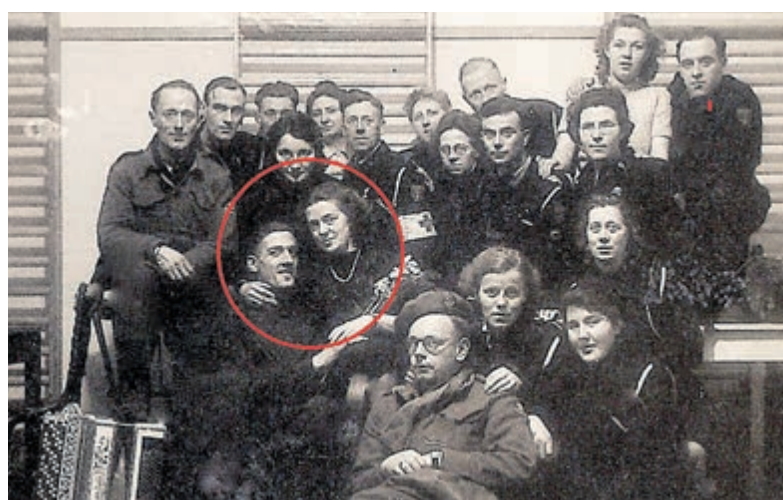
Foto van de groep kampbewaakers. De twee personen in de rode cirkel zijn Merels grootouders.

De verbazing is duidelijk van Merels gezicht af te lezen. „Dus ze hebben hier beiden gewerkt, begrijp ik?“, vraagt Merel. Heideman antwoordt bevestigend. „Maar als dit zo is, hebben ze elkaar hier dan ook leren kennen?“, vraagt ze. Heideman knikt en toont Merel een foto waarop de