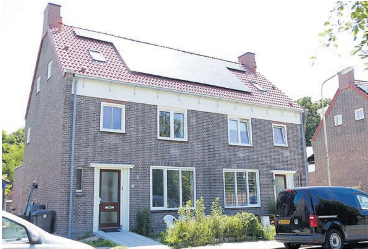
De woningen aan de Poelven in Castricum.