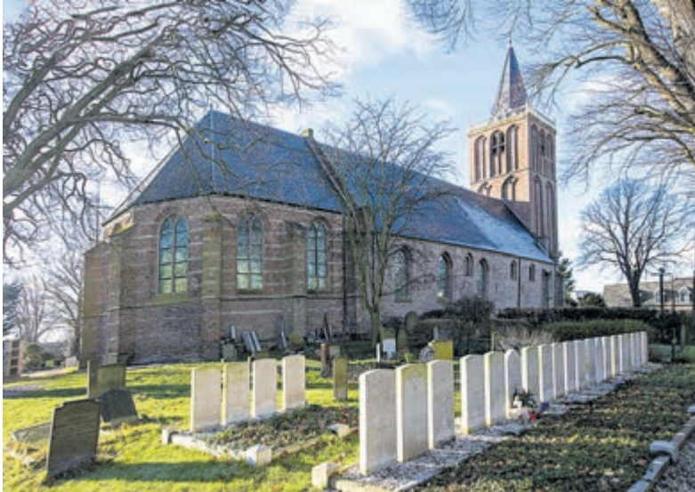
Van de 24 oorlogsgraven bij de Dorpskerk hebben er inmiddels 19 een gezicht gekregen.

Castricum - Tijdens de Tweede Wereldoorlog kwamen heel wat vliegtuigbemanningen boven zee om het leven. Ze kregen een zeemansgraf of spoelden aan op de kust. In Castricum zijn zo'n 60 lichamen geborgen. Geallieerde slachtoffers werden meestal begraven in de plaats waar zij aanspoelden. Bij de Dorpskerk bevinden zich 24 oorlogsgraven waarin 36 mensen liggen.