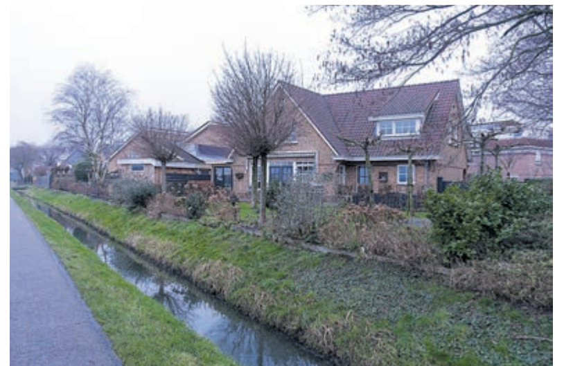
Eind februari kunnen de Castricumse woningen hun WOZ-beschikking over 2021 verwachten.

Tot slot noemt de woordvoerder nog wat cijfers uit Castricum om die met de landelijke te vergelijken: „Over de laatste tien jaar genomen is de ontwikkeling van de WOZ-waarde hier nagenoeg gelijk aan de landelijke ontwikkeling. De WOZ-waarde van een woning in Castricum, die in 2011 werd getaxeerd op € 300.000, heeft in 2020 een waarde van € 361.500. Landelijk ligt dat op € 362.000. Hierbij is rekening gehouden met de procentuele jaarlijkse stijging en daling van de WOZ-waarde. De hoogte van de aanslag OZB is gebaseerd op de WOZ-waarde. Om de OZB te berekenen wordt er een tarief in de vorm van een percentage van de WOZ-waarde gehanteerd. Het tarief voor woningen in Castricum lag in 2020 ruim 22% onder het landelijk gemiddelde. De gemeente houdt bij de berekening van het OZB-tarief rekening met de waardeontwikkeling van de woningen in Castricum. Als dat niet gebeurt, dan werkt het percentage van de prijsstijging van woningen namelijk door in de aanslag OZB en zou deze fors hoger uitvallen. Omdat er sprake is van een waardevermindering van woningen in Castricum, heeft de gemeente het OZB-tarief 2021 voor woningen daarom met ongeveer 7% verlaagd.” Meer informatie: https://castricum.cocensus.nl .