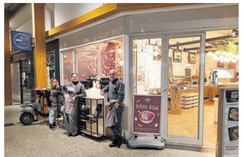
Het team van Cebi's Dish in winkelcentrum Geesterduin.

van Cebi's Dish verkrijgbaar waren, kon het team het werk amper aan. Het is dan ook een voor Castricum en wijde omgeving uniek concept. „Bij bezorgmaaltijden heb je veel van hetzelfde. Wij pakken het anders aan, door gerechten te leveren zoals je ze ook thuis voor je gezin zou koken. We bieden ook luxe vegan borrelboxen en charcuterie borrelboxen!” Cebi's Dish is voor afhalen en bezorgen van maaltijden dinsdag tot en met zondag tussen 15.00 en 20.00 open. Bel vanaf 11.00 tot 20.00 uur op nummer 0251 296737 voor het doorgeven van bestellingen en vragen of kijk op Thuisbezorgd.nl voor een overzicht van alle gerechten. Instagram: cebidish .