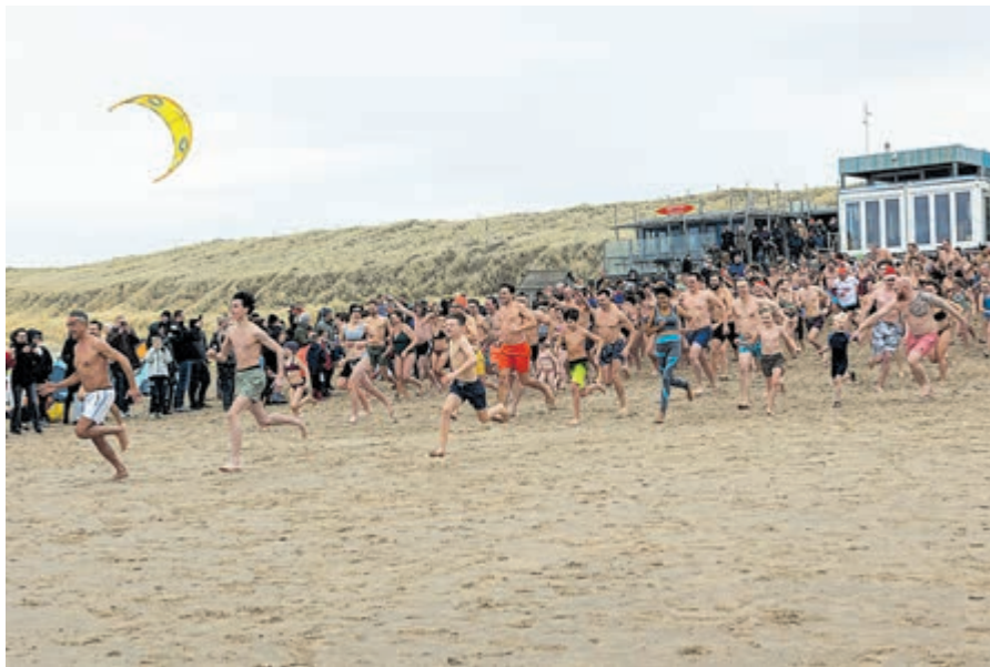
Als er één schaap over de dam is volgen er meer...

Terwijl een enkeling de handen buiten bij een houtvuurtje opwarmt zijn de meeste bezoekers inmiddels een van de strandpaviljoens ingegaan om zich te goed te doen aan koffie, chocolademelk of glühwein. Tekst en foto's: Henk de Reus