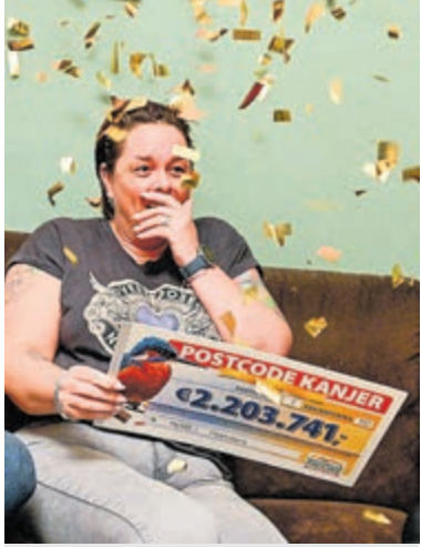
Claudia wint 2,2 miljoen euro.

Heemskerk - Zondagavond werd bekendgemaakt dat de Postcode Kanjer van 58,9 miljoen euro in Heemskerk is gevallen. Postcode Loterij-ambassadeurs Caroline Tensen en Quinty Trustfull verrasten de winnaars met dit nieuws. Beelden van de feestelijke uitreiking waren die avond te zien in het programma 'Beat The Champions VIPS' bij RTL 4.