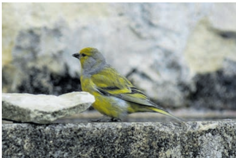
De citroensijts.

Castricum - Op zaterdag 14 januari houdt de Vogelwerkgroep Midden-Kennemerland in samenwerking met PWN een lezing met beelden onder de titel 'Vogelen in Frankrijk'. Deze lezing wordt verzorgd door Harm Niesen, een uitstekende vogelaar van de vogelwerkgroep Alkmaar en vicevoorzitter en woordvoerder van De Faunabescherming.