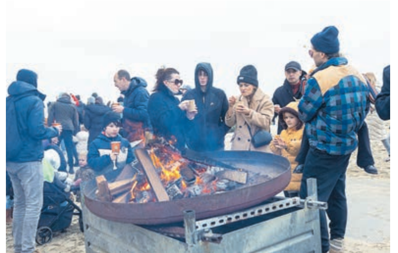
Na afloop even doorwarmen bij een houtvuurtje.