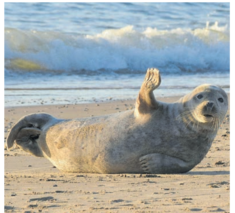
Ook fotografe Karin Cijssouw neemt deel aan de KunstFietsRoute. Deze foto was vorig jaar bij haar te zien.

mensen bij de Voedselbank hebben moeten aanmelden. Zij kunnen niet meer voor een dagelijkse maaltijd zorgen. Daarom vragen de vrijwilligers u om – net zoals in 2022 – in groten getale houdbare producten te komen doneren bij de maandelijkse inzameling bij de St. Pancratiuskerk op vrijdag 6 januari tussen 10.00 en 12.00 uur. Zolang de nood hoog is, blijven zij actief en blijven zij een beroep op u doen. Bij voorbaat dank.