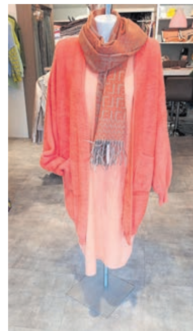
Volop leuke items in de nieuwe collectie van Label White.