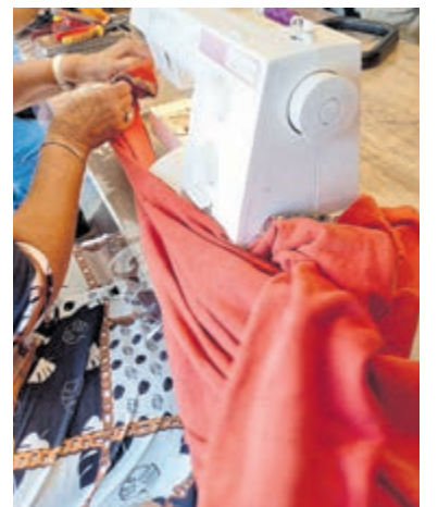
In het Repair Café zitten vrijwilligers klaar om allerlei zaken te repareren.

maanden georganiseerd. Transitie Castricum is een netwerk van Castricumers die aan de slag zijn om door middel van simpele oplossingen hun leven meer duurzaam, sociaal en lokaal te maken. De Groene Bak is een groep jonge mensen die wil inspireren om duurzamer te leven. CALorie is een coöperatie van en voor bewoners van de gemeente Castricum met als missie de uitstoot van CO2 te beperken en het gebruik van duurzame energie te bevorderen om zo de opwarming van de aarde tegen te gaan. Bibliotheek Kennemerwaard, vestiging Castricum, zet zich in voor duurzaamheid. Kijk op www.transitiecastricum.nl en www.calorieenergie.nl voor meer informatie. Wanneer het druk is, kan men mogelijk aan het eind van het Repair Café niet meer iedereen helpen. Wil je zeker zijn van reparatie, kom dan bijtijds. Repareren en laten repareren is uiteraard op eigen risico.