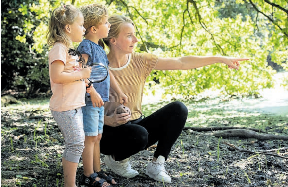
Opgeleid worden tot pedagogisch medewerker en direct aan de slag.