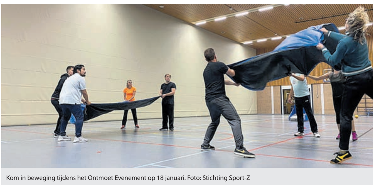
Kom in beweging tijdens het Ontmoet Evenement op 18 januari.

Ben of ken je iemand die kinderen graag de beste basis voor de toekomst wil geven? Die nieuwsgierig, betrokken en sociaal is? En graag in de kinderopvang zou willen werken, maar nog niet het juiste diploma heeft? Solliciteer dan naar één van de twintig beschikbare plekken. Meer informatie is op www.fortekinderopvang.nl/werken te vinden.