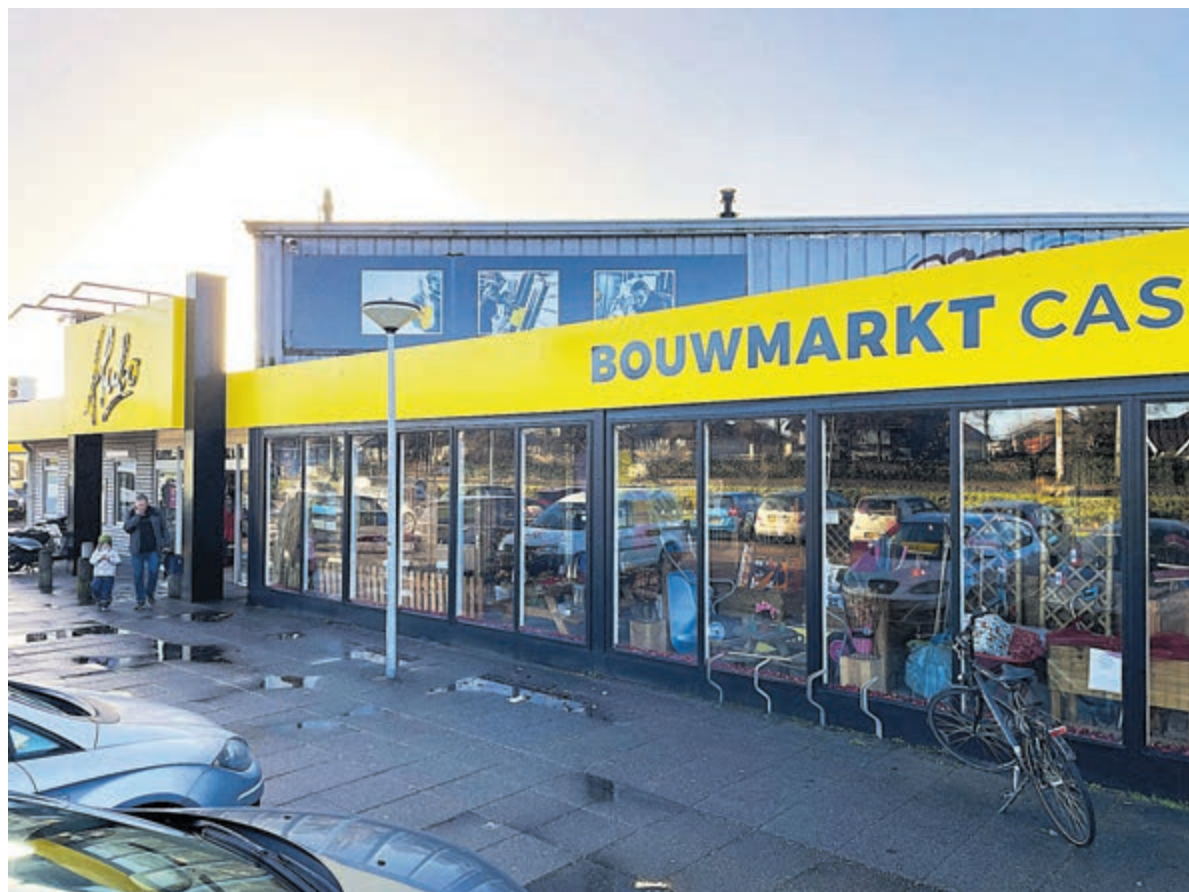
Hubo Castricum is gevestigd aan de Castricummer Werf 70