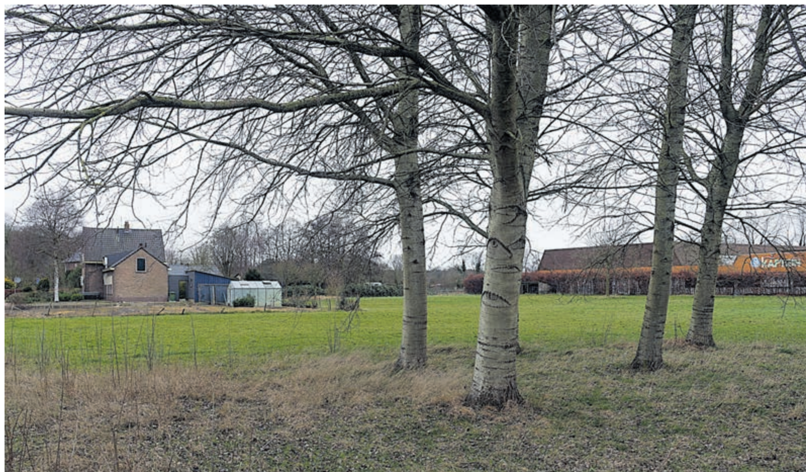
Op deze locatie achter het station van Castricum wordt vóór 2025 geen woningbouw verwacht.

nieuwbouw nodig hebben om onze ambitie te halen. Projecten lopen nu eenmaal vaker vertraging op dan dat ze versnellen. Inmiddels beschikken we gelukkig over een grotere planvoorraad. Maar bovenal ben ik ervan overtuigd dat we de nieuwbouw in Noord-Kennemerland alleen samen van de grond krijgen, dus samen met onze Huurderskoepel, samen met zorg- en welzijnsorganisaties en samen met de gemeenten in ons werkgebied die hiervoor hun grondposities kunnen gebruiken. En als ze geen grondpositie hebben, kunnen ze zogenaamde anterieure overeenkomsten sluiten met commerciële ontwikkelaars en hen verplichten om sociale huurwoningen te bouwen. En dan uiteraard duurzame en betaalbare woningen van een goede kwaliteit. Bovendien moeten deze woningen sociaal blijven en dus niet na enkele jaren worden verkocht of verhuurd in de vrije sector. Daar draagt Kennemer Wonen graag aan bij.”