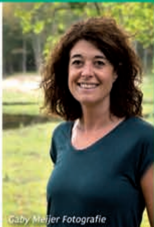
Gaby Meijer Fotografie

Bezoek mijn website en vul het contactformulier in voor een gratis kennismakingsgesprek. Bij het maken van een afspraak in de maand januari krijgt u €30 korting op de intake! Mijn praktijk is geopend en afspraken kunnen online doorgaan.