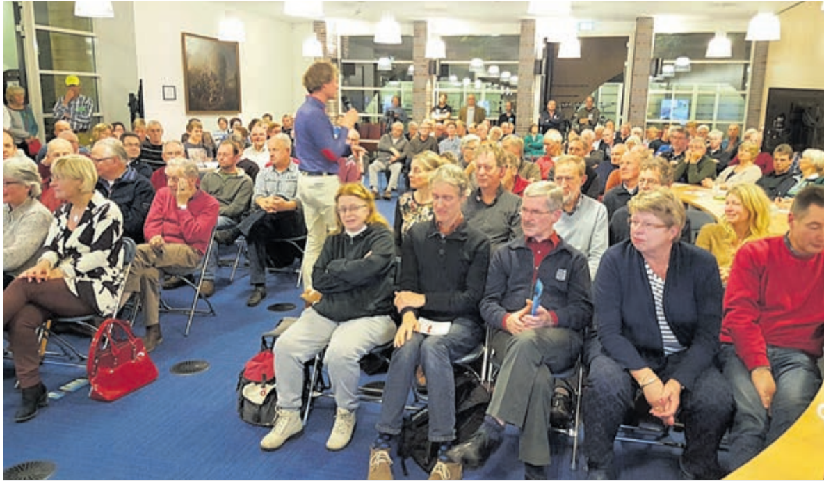
2015: grote belangstelling in het gemeentehuis voor de informatieavond van CALorie.