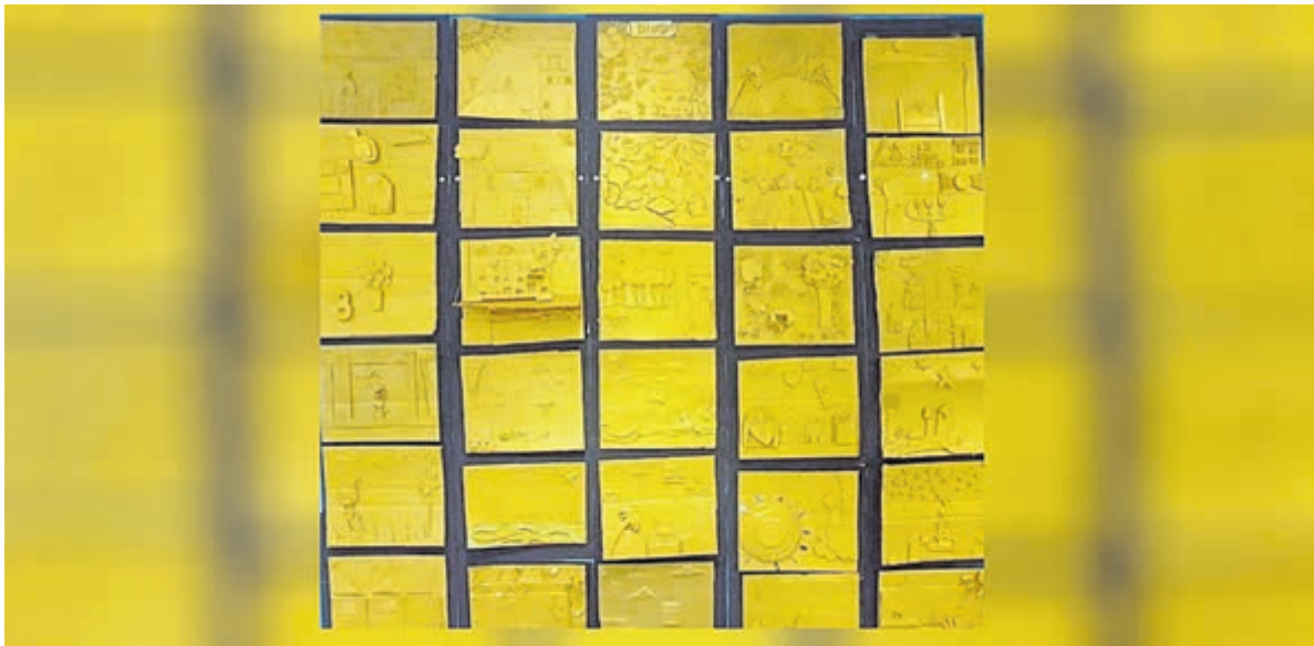
Deze 'Clusiusdeuren' getuigen van een grote dosis creativiteit bij de leerlingen.

Castricum - Doorgaans nodigt de eerste dag van het nieuwe jaar uit om een frisse neus te halen. Het strand is hiervoor een geliefde plek. Alleen vragen de coronamaatregelen ons om zo veel mogelijk thuis te blijven en drukke plekken te mijden. Niet iedereen bleek zich hieraan te houden en 's middags toch het strand op te zoeken. Echt druk werd het echter niet. Het zonnetje zorgde soms voor fraaie beelden.