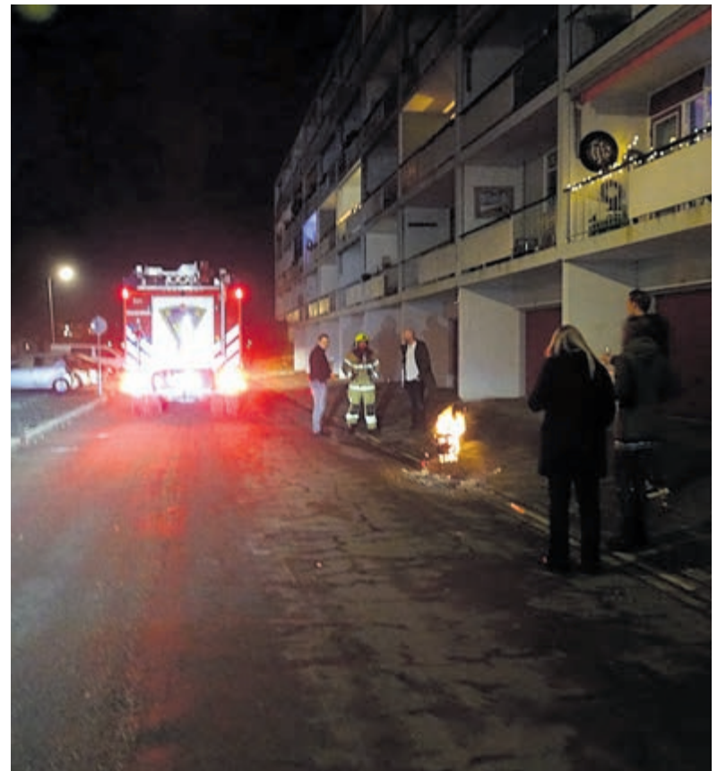
De vuurkorf hoefde van de brandweer niet gedooft te worden.