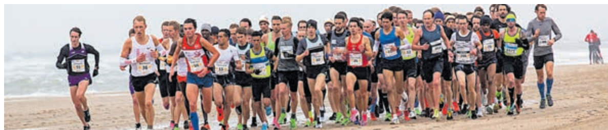
Deelnemers tijdens een eerdere editie van de halve marathon.