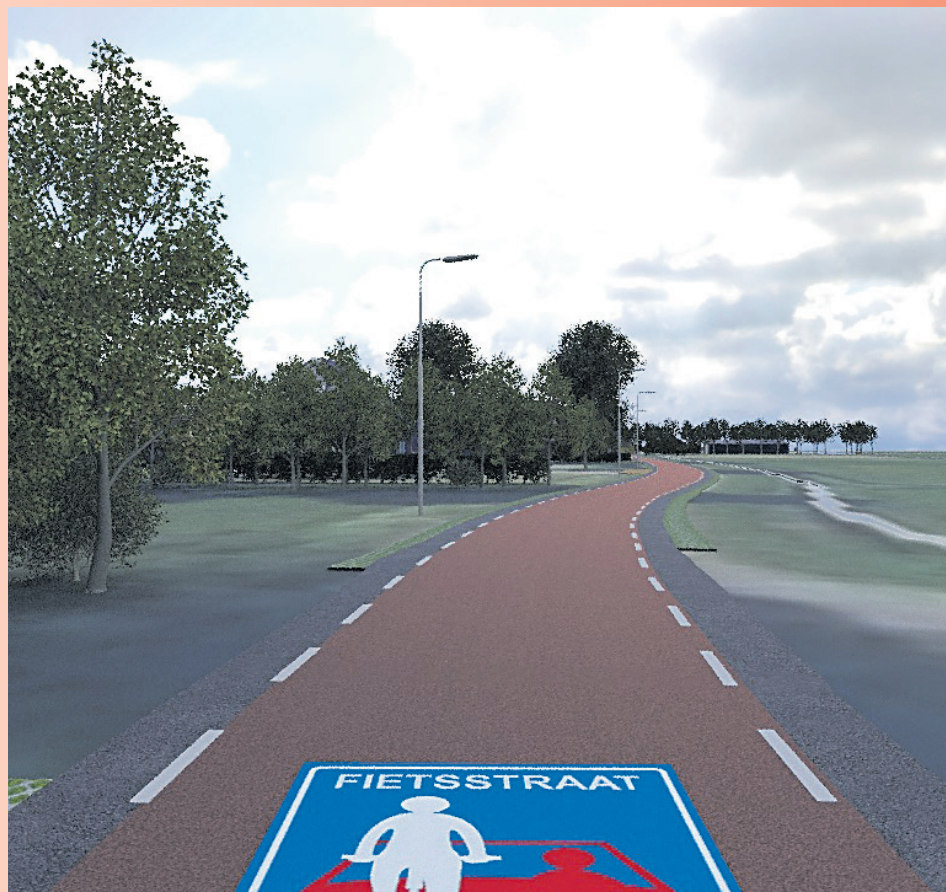
Een impressie van de Uitgeesterweg als fietsstraat, half juli 2018.

De werkzaamheden worden naar verwachting uitgevoerd tussen half juni en half juli 2018.