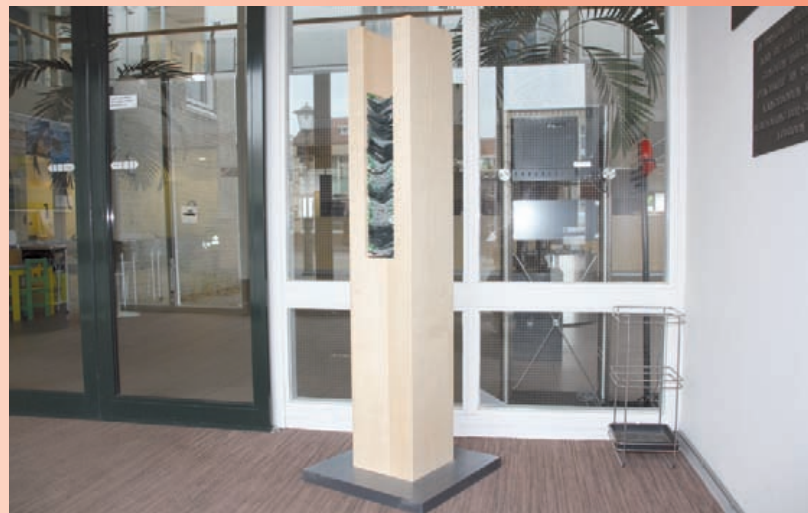
De zuil met de verzamelzakken in de hal van het gemeentehuis aan de Middeleweg.