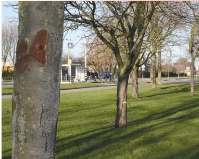
De kastanjabomen op de voorgrond moeten helaas worden verwijderd vanwege ziekte.

In dringende gevallen kan te- lefonisch een regeling worden getroffen voor een afspraak buiten de openingstijden.