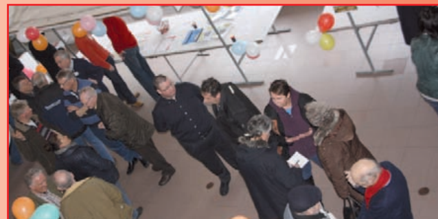
Een kijkje bij de informatiemarkt van afgelopen zaterdag in het gemeentehuis. Daar kwamen een kleine honderd bezoekers op af. Voor het Politiek Café wordt een nog grotere toeloop verwacht.

van Uitgeest. Dit alles in aanloop naar de besluitvorming in de ge- meenteraadsvergadering van donderdag 30 januari. Tijdens het Politiek Café wordt ook de uitslag van de enquête over de toekomst van Uitgeest bekend- gemaakt.