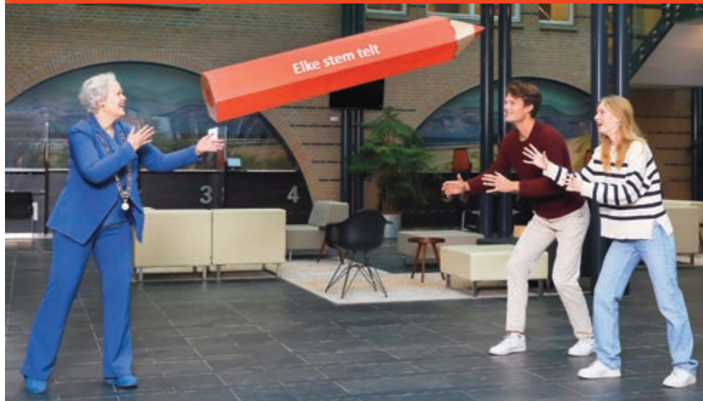
Burgemeester Heerschop moedigt iedereen aan om te komen stemmen. 18-jarigen die voor het eerst mogen stemmen kregen vorige week een persoonlijke oproep per post.

Alles weten? Kijk op de webpagina over Verkiezingen www.castricum.nl/verkiezingen