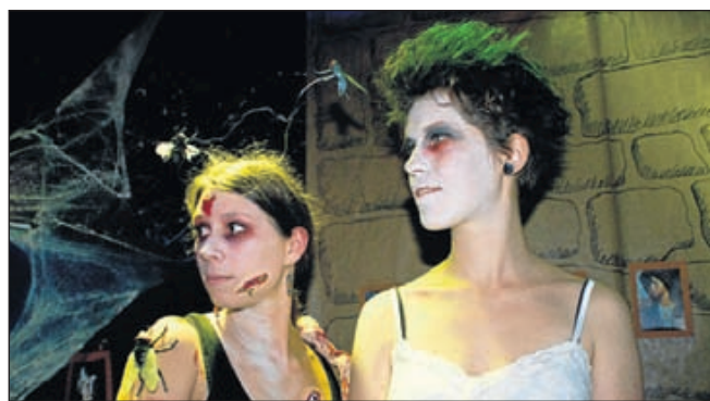
Bezoekers dosten zich helemaal uit tijdens Halloween 2011 in De Bakkerij."