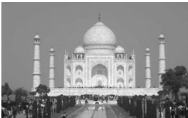
Taj Mahal in Agra, India, is een van de moderne wereldwonderen

Woensdag, tweede kerstdag wordt een superkerstfeest worden georganiseerd met kerstmutsen en de bekendmaking van Miss X-mass 2007 en dj Toine. Alle feestdagen zijn de cafés open tot 3.00 uur. Kaarten voor oud en nieuw zijn verkrijgbaar aan de bar.