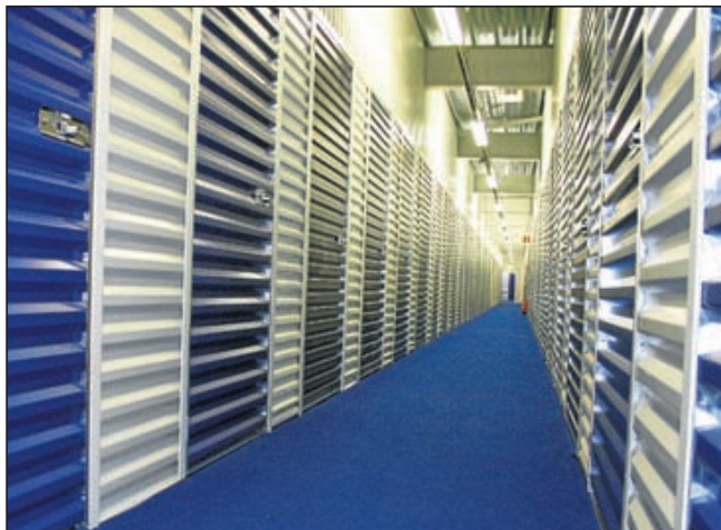
Nog steeds zijn er veel mensen die nog nooit in een mini opslag bedrijf zijn geweest, Rent a Box de lezers graag een kijkje in het bedrijf

Beverwijk - Rent a Box biedt de oplossing voor particulieren en bedrijven die (al dan niet tijdelijk) kampen met ruimtegebrek. Men kan hierbij denken aan stalling van de kampeerspullen en tuinsets gedurende de winterperiode, maar ook even een maandje extra ruimte huren tijdens een verbouwing komt veel voor. Een andere service die Rent a Box nu veel biedt is tijdelijke opslag voor een deel van de inboedel voor mensen die een woning te koop hebben staan. Net even wat meer ruimte door een kastje van oma tijdelijk te stallen en aangezien de diensten per maand opzegbaar zijn, is het een flexibele oplossing. En bij de daadwerkelijke verhuizing kan men makkelijk gebruik maken van de gratis Rent a Box verhuisbus. Voor de ondernemer is het een flexibele mogelijkheid om een deel van de voorraad te stallen, welke per dag mee kan groeien of krimpen en maandelijks opzegbaar is. Het in ontvangst nemen van goederen maakt ook deel uit van de service. Self Storage ofwel Mini Opslag bedrijven worden ook wel goederen