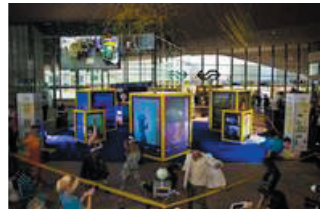
FOTO-EXPOSITIE. National Geographic bestaat 125 jaar en viert dat samen met NS en ProRail. In oktober is er een expositie van beeldmateriaal dat ze verzameld hebben van 1888 tot nu. Tevens een Augmented Reality show. Via groot digitaal scherm waant men zich tussen de wilde dieren en do-naosaurussen. Centraal Station, Utrecht. Gehele maand oktober.

VAN ZUYLEKOM - 300 JAAR STOKEN IN AMSTERDAM. Amsterdam Museum, Kalverstraat 92 en Sint Luciënsteeg 27, Amsterdam. Deze presentatie geeft een indruk van de kunst van het distilleren en laat op sprekende wijze de historie van een echt ambachtelijk Amsterdams bedrijf zien. Dage-lijks tot 14 oktober van 10.00-17.00 uur.