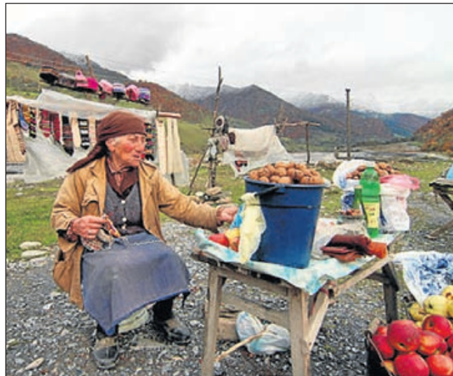
Koopvrouwje in Georgië.

Het programma is aan te vragen op werkdagen tussen 9.00 uur en 12.00 uur op telefoonnummer 035-5245156. Het overzicht met voorstellingen van Vier het Leven is ook te vinden op: www.4hetleven.nl . Het programmaboekje is ook af te halen bij Stichting Welzijn aan de Geesterduinweg 5 in Castricum.