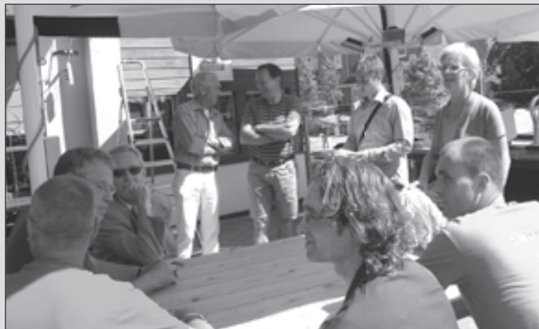
Burgemeester Emmens (staand, rechts) vertelt aan horeca-ondernemers, bewoners en ambtenaren over de maatregelen die afgelopen jaar werden genomen.

Tijdens de schouw is stilgestaan bij de ontwikkelingen van de afgelopen jaren binnen het gebied. Ook zijn er afspraken gemaakt om de leefbaarheid verder te bevorderen. Naast een periodieke schouw in het horecaconcentratiegebied zijn er ook elk kwartaal constructieve bijeenkomsten met bovengenoemde partijen om operationele en beleidsmatige zaken af te stemmen.