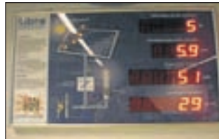
De display die in de aula hangt.

jaren te werken aan een schoolgebouw dat zo 'groen' mogelijk is. Naast de maatschappelijke relevantie, zal dit in de komende jaren ook vanuit de overheid opgelegd worden. Het plaatsen van de zonnepanelen is de eerste stap om tot een zo groen mogelijke school te komen.